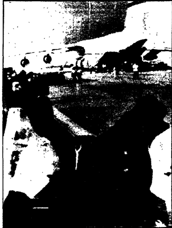
Uno degli aerei da trasporto degli USA che alimentano il ponte di rifornimenti per le truppe di Thieu all'aeroporto di Saigon. Tra gli altri materiali bellici trasportava 14 obici

Il Presidente americano ha fatto diramare una dichiarazione dal suo portavoce, parlando sfacciatamente di «violazione degli accordi» da parte del governo di Hanoi — « Monumentale » la perdita di materiale USA — Seicento marines inviati sulle navi al largo di Danang