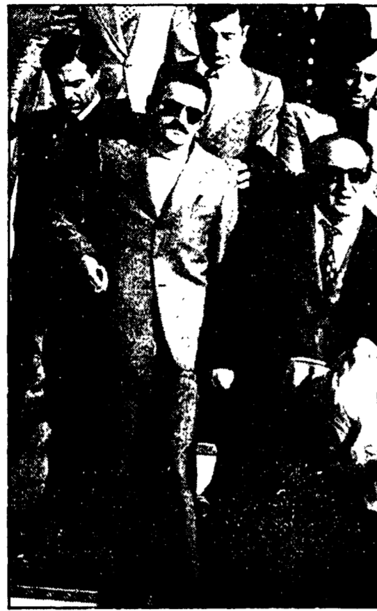
IL FASCISTA MASSAGRANDE A ROMA