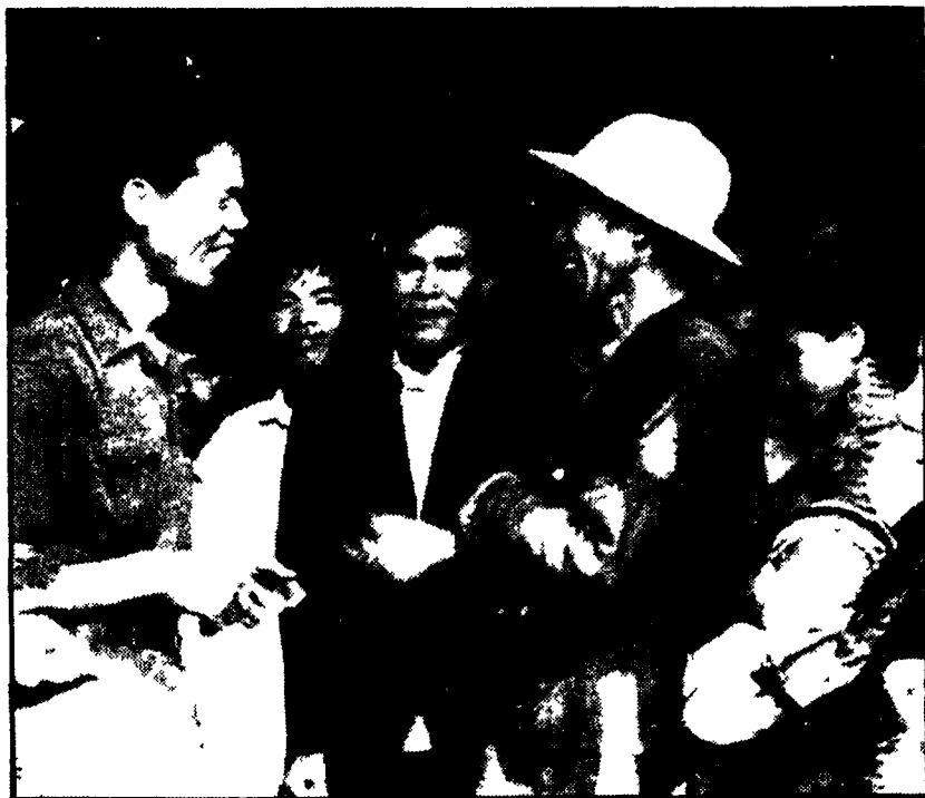
Cittadini di Huế e soldati del GRP a colloquio nelle vie della ex capitale imperiale subito dopo la sua liberazione

La collera contro coloro, diffusa tra i dirigenti della borghesia, ha il suo centro in tre accuse che tendono a gettare tutte sugli americani le colpe di una sconfitta dovuta in primo luogo al marciame del regime di Saigon di aver « incoraggiato » il ricorso alla guerra e di far mancare oggi ad essa nuovo sostegno. La collera contro coloro, diffusa tra i dirigenti della borghesia, ha il suo centro in tre accuse che tendono a gettare tutte sugli americani le colpe di una sconfitta dovuta in primo luogo al marciame del regime di Saigon di aver « incoraggiato » il ricorso alla guerra e di far mancare oggi ad essa nuovo sostegno.