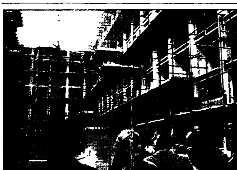
Il folto gruppo di autorità intervenuto in via Mantegna il primo giorno dei lavori di abbattimento

Al momento dello scoppio il direttore dell'«Avanti!» e i familiari erano fuori Roma - L'ordigno di notevole potenza è stato collocato su un balcone dell'appartamento - Probabilmente si tratta di frullo inteso con una miccia - Ingenti i danni