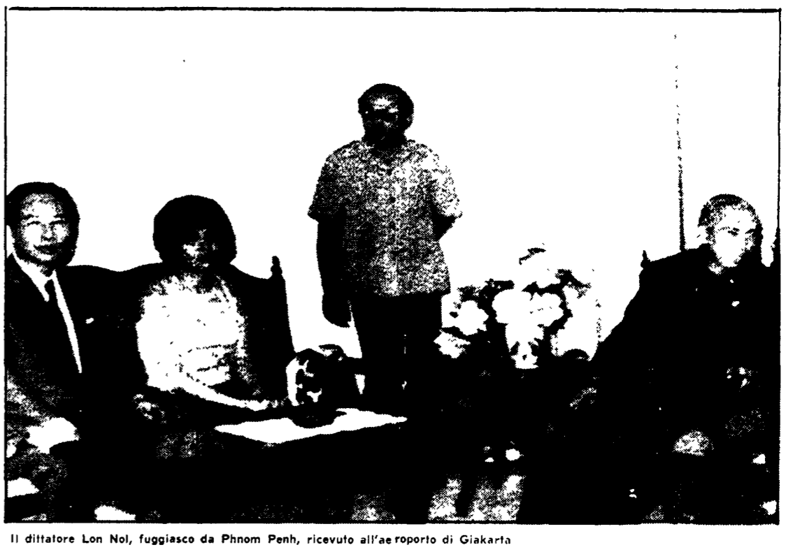
Il dittatore Lon Nol, fuggiasco da Phnom Penh, ricevuto all'aeroporto di Giacarta

Centrata dalle artiglierie guerrigliere la sua residenza durante la cerimonia di saluto — Si fermerà una decina di giorni nell'isola indonesiana per poi recarsi negli Stati Uniti — L'India riconosce il GRUNK di Sihanuk quale legittimo governo della Cambogia