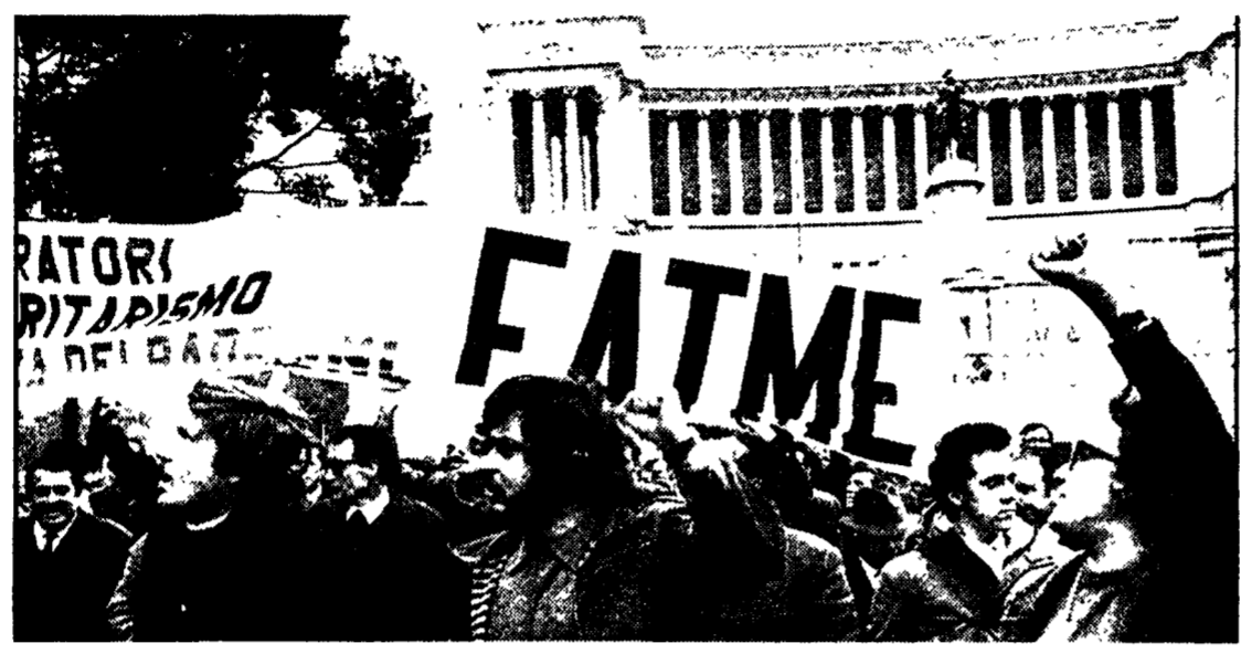
FERMA PER DUE ORE LA FATME