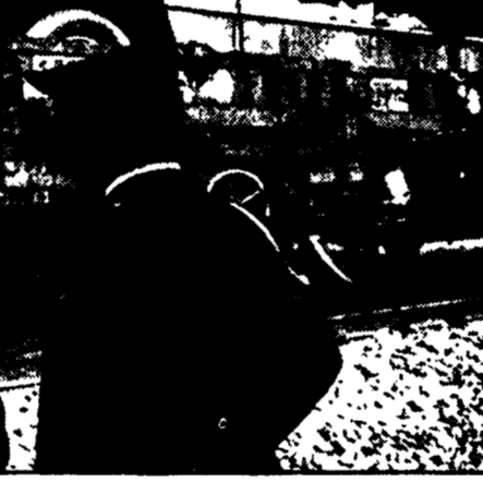
IN FIAMME DUE VAGONI DEL CIRCO

Una manifestazione di comunisti e di altri partiti democratici si è svolta in piazza Verdi ai Parioli. Il comitato di coordinamento per la difesa dell'ordine democratico ha promosso l'iniziativa.