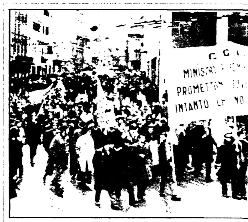
Entro maggio Fermata di 12 ore dei lavoratori Italcantieri

Questo atteggiamento negativo di parte della UIL, secondo notizie diffuse da agenzie di stampa - avrebbe provocato a grosse perplessità - nella CISL, la relazione ai Consigli dovrebbe essere tenuta da Storace sulla opportunità di andare alla riunione dei Consigli con un progetto contrastato sia pure da parte di una minoranza. Nel corso della riunione durata diverse ore, la CGIL ha ribadito le necessità di dare concretezza al progetto per l'unità organica, a partire, appunto dalla riunione dei Consigli generali. Al termine della discussione è stato deciso di aggiornare la riunione a lunedì mattina.