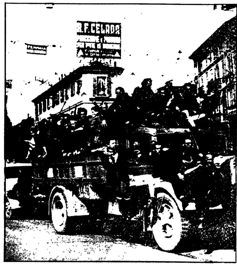
Gli studenti preparano anche mostre fotografiche sulla Resistenza. Nella foto: i partigiani entrano in una città liberata