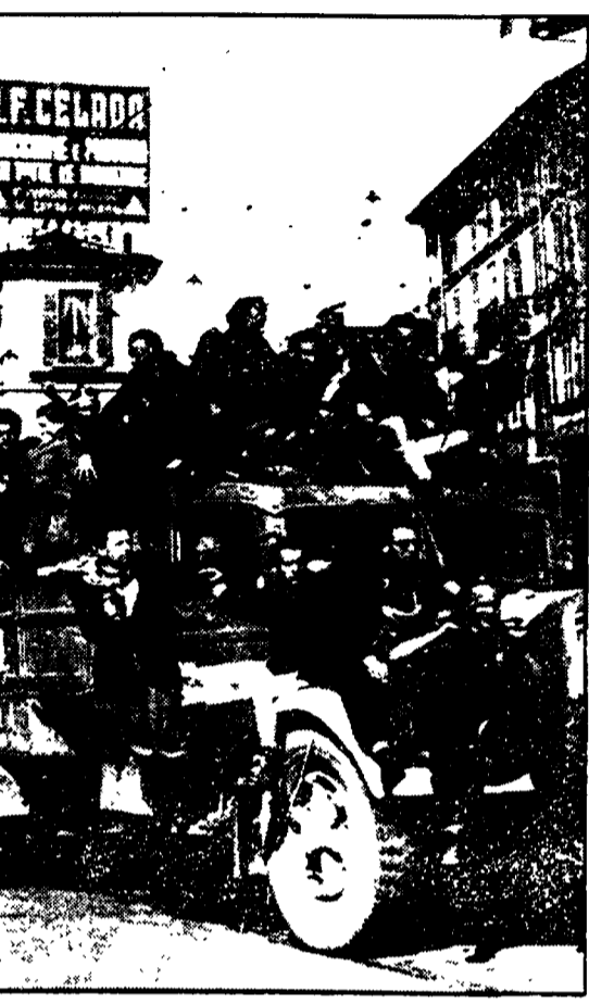
Gli studenti preparano anche mostre fotografiche sulla Resistenza. Nella foto: i partigiani entrano in una città liberata