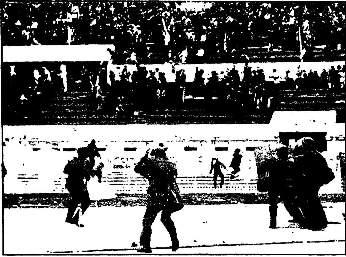
Un momento degli incidenti creati da un gruppetto di teppisti nel corso di Lazio-Torino

Gli incidenti causati da pochi teppisti durante Lazio-Torino sono costati molto cari ai biancoazzurri