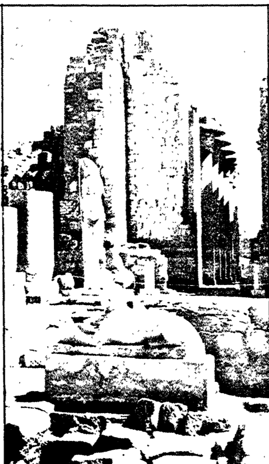
«Civiltà del passato», edito da Rizzoli. Intrinseca libreria è un volume di Leonardo Cotroneo dedicato alla civiltà da quella dell'antico Egitto, alla cretese, alla micenea, alla sumerica, alla cinese...