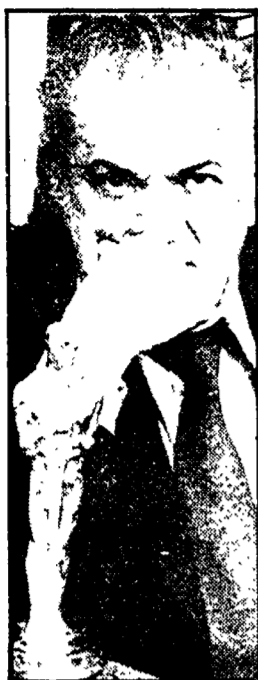
Federico Fellini fotografato davanti al suo terzo Oscar...