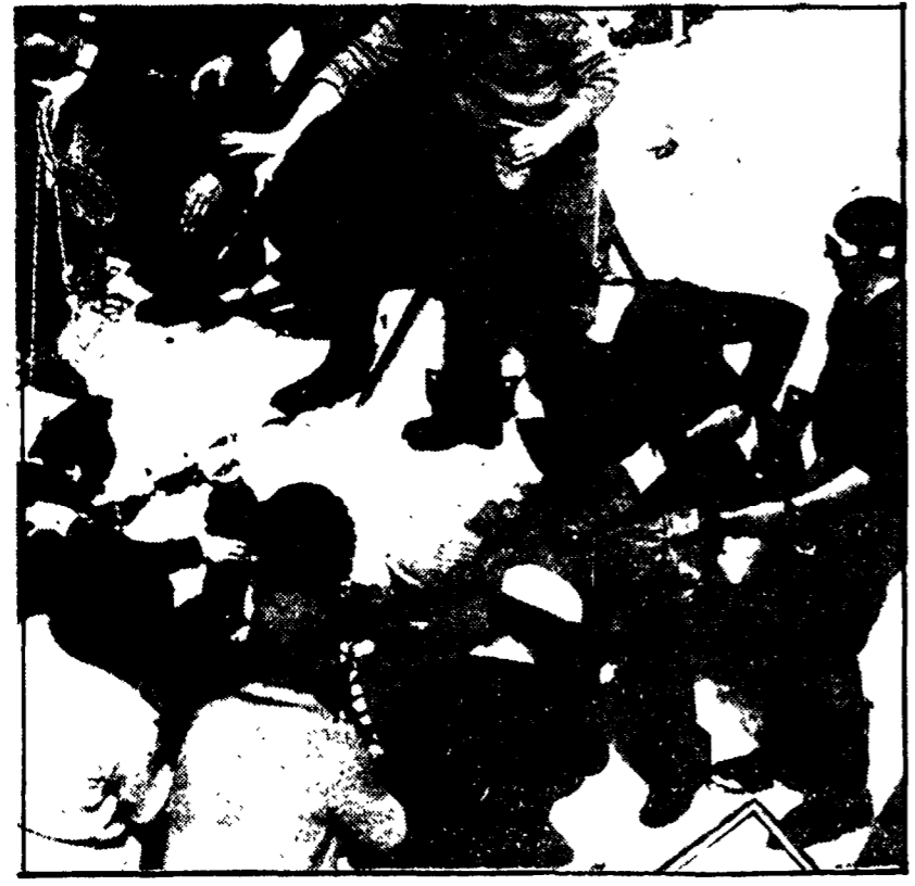
Squadre di soccorritori estraggono il corpo di una delle vittime della valanga in Alto Adige

Sono turisti tedeschi - Cominciano le polemiche mentre continua il lavoro - Potevano essere salvate tante vite? - Avrebbero dovuto essere subito utilizzate le speciali sonde austriache per localizzare le auto sepolte - Transitato il primo convoglio ferroviario