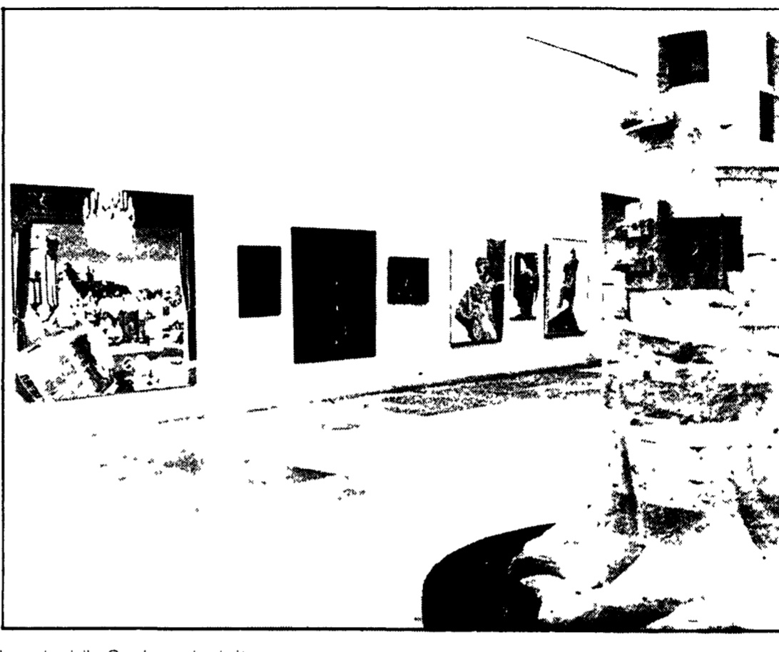
Una sala della Quadriennale di Roma.

Ma il problema è più complesso. Ma il problema è più complesso. Ma il problema è più complesso. Ma il problema è più complesso. Ma il problema è più complesso.