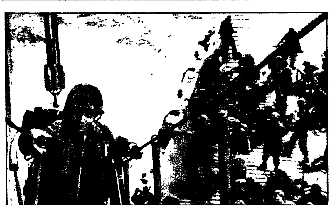
Un «marine» statunitense sale a bordo della nave trasporto «Transcolorado», mentre altri marines attendono il loro turno. Questi marines sono incaricati di «mantenere l'ordine» tra i profughi. Si sa che le navi americane impegnate nell'operazione scaricano i profughi nell'isola di Phu Quoc, dove vengono interrogati dalla polizia di Thieu. Quelli che risultano «sospetti» vengono uccisi sul posto. È questo il primo documento fotografico sull'azione dei marines USA nelle acque vietnamite.

L'ex presidente aveva promesso al dittatore di continuare l'intervento anche armato, senza informarne il Congresso - La Casa Bianca ammette la sostanza della cosa, pur negando che essa si fosse concretizzata in un «accordo segreto» - Le rivelazioni suscitano profonda eco a Washington