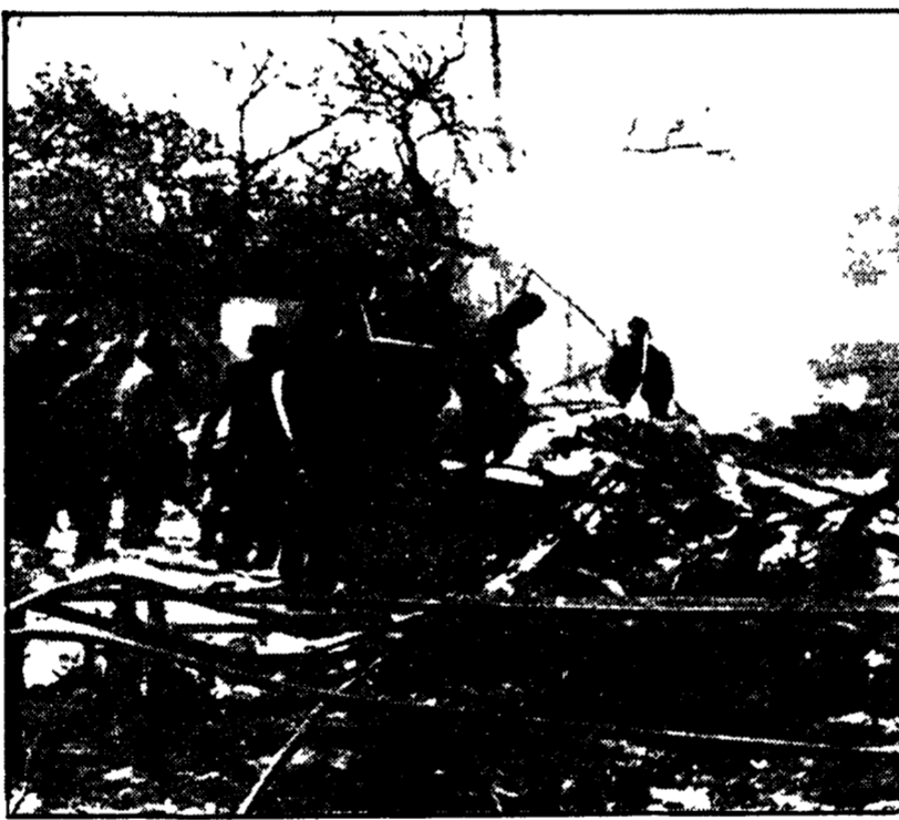
NAPOLI - Squadre di vigili del fuoco tra le macerie e i ferri contorti della fabbrica