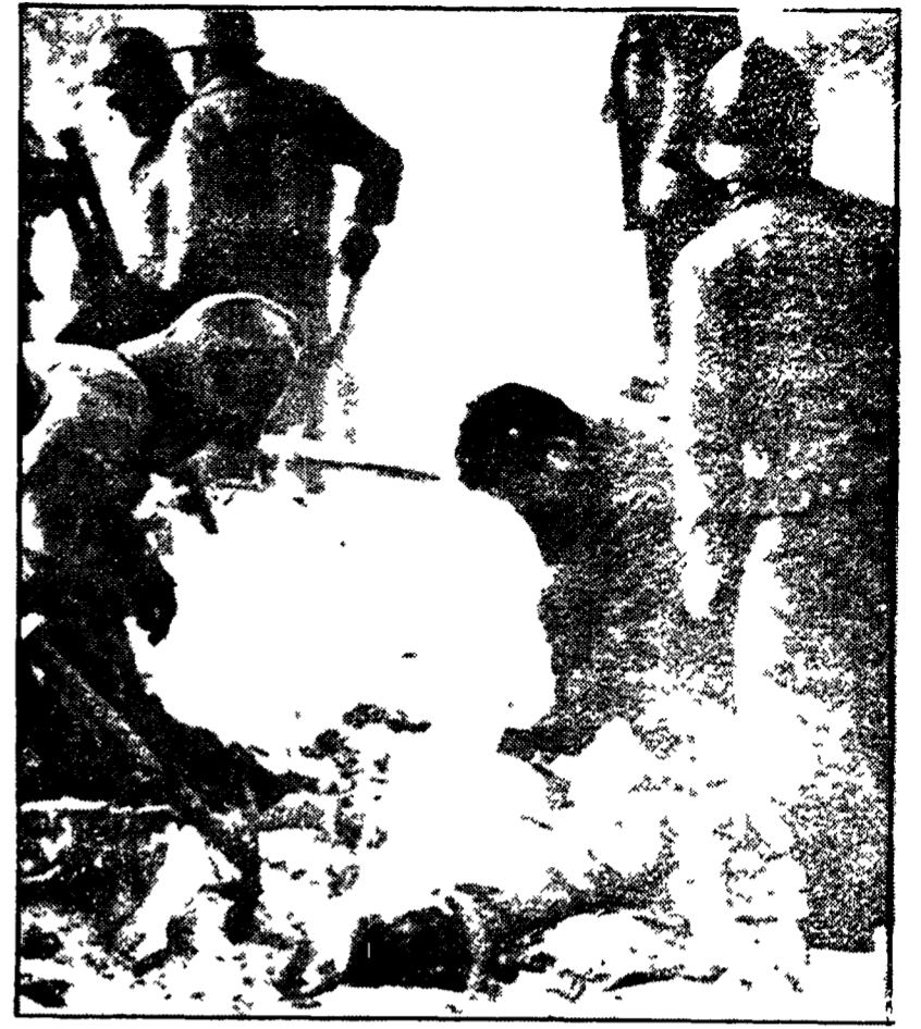
I vigili del fuoco recuperano fra le macerie il corpo di un operaio

La delegazione del Pci è giunta sul luogo della sciagura per esprimere il cordoglio e la solidarietà alle famiglie delle vittime.