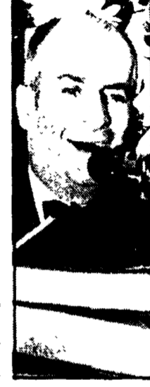
Louis De Funès