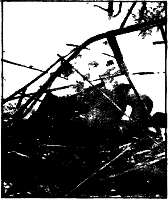
Si scava fra le macerie alla ricerca dei superstiti

Gli operai erano appena entrati dopo l'intervallo del pranzo - La deflagrazione ha scagliato corpi e macerie per centinaia di metri intorno - Irreperibili i titolari dell'azienda - Gran parte delle vittime erano state assunte soltanto da pochi giorni - La difficile e pericolosa fabbricazione di pistole-giocattolo, munizioni e razzi