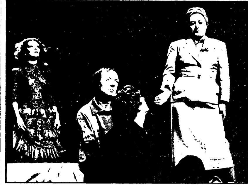
PARIGI - Un singolare spettacolo va in scena in questi giorni al teatro Daniel Sorano di Vincennes: si tratta di una rievocazione della vita di Fausto Coppi, che fu - com'è noto - popolare anche in Francia...