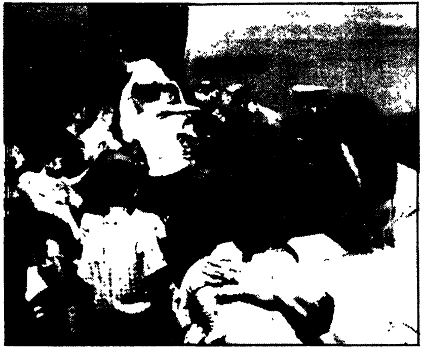
Un altro drammatico documento che dimostra come il «ratto degli orfani» sia, puramente e semplicemente, il «ratto dei bambini». La didascalia originale di questa foto A.P. dice: «L'attrice Ina Balin conforta una madre vietnamita (in basso a destra) il cui figlio viene caricato a bordo di un C-141 statunitense all'aeroporto Tan Son Nhut di Saigon, venerdì, per essere adottato negli Stati Uniti»

A Saigon, contrastanti reazioni al discorso di Ford — Manovre di Cao Ky per tornare al potere — Attacchi delle forze di liberazione a 10 km. dalla capitale — Crisi governativa a Phnom Penh — Nuovo tipo di bombe USA sperimentato in Cambogia