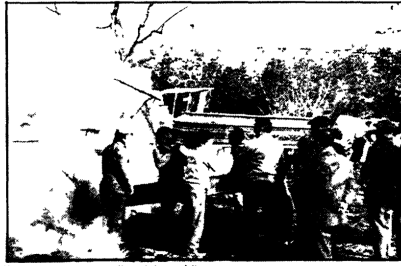
Una tragica immagine colta sul luogo della sciagura

Una folla di parenti, di operai dei vicini stabilimenti di Pomigliano d'Arco e accorsa subito dopo il tremendo boato - La Flobert's sorgeva in piena campagna - Arduo e pericoloso lo sforzo dei soccorritori - Forse 2 le deflagrazioni - Le prime ipotesi