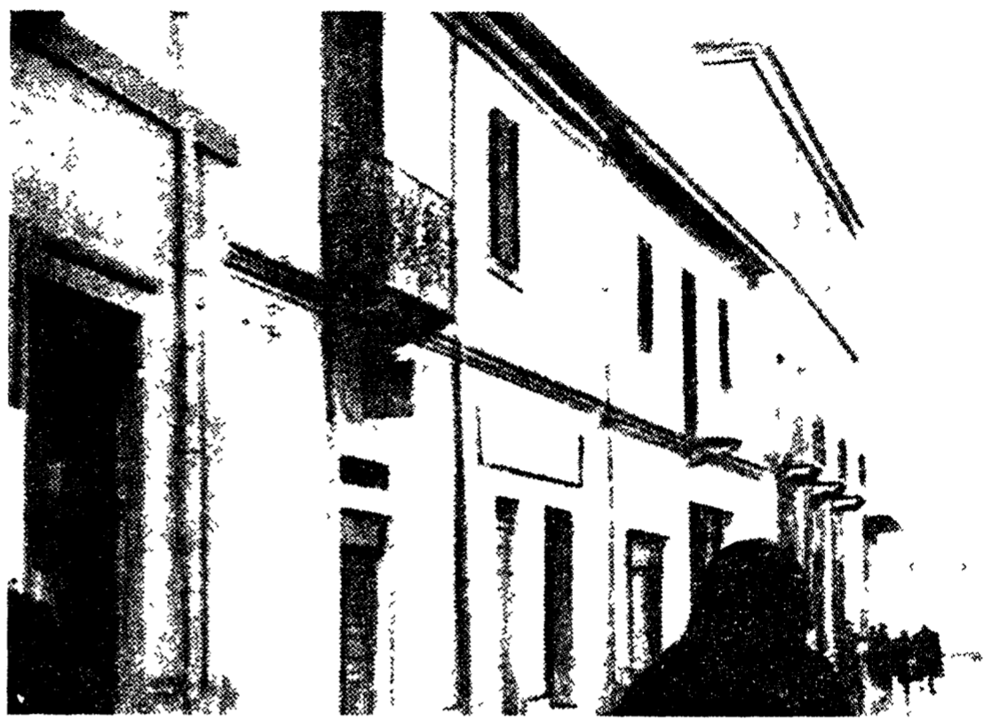
La casa di Antonio Gramsci a Gilarza

GILARZA 27 aprile. La casa dove in valle adriatica la famiglia Gramsci si era stabilita nel 1914 è stata restaurata e ora è un museo dedicato al grande dirigente comunista. La casa è stata restaurata e ora è un museo dedicato al grande dirigente comunista. La casa è stata restaurata e ora è un museo dedicato al grande dirigente comunista.