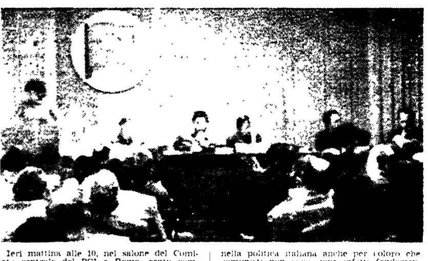
NELLA FOTO Diffusori dell'Unità riuniti nella sede del Comitato centrale del Pci.