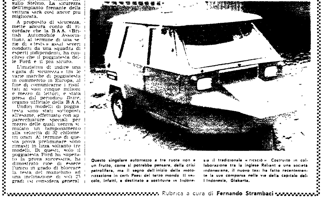
Questo singolare automezzo a tre ruote non è un frutto, come si potrebbe pensare, della crisi petrolifera, ma il segno dell'inizio della motorizzazione in certi Paesi del terzo mondo...