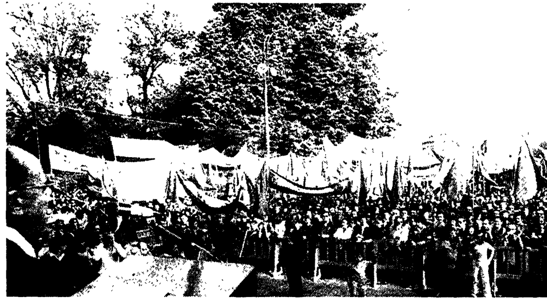
MILANO — Un aspetto della manifestazione antifascista mentre parla il compagno Carrillo.