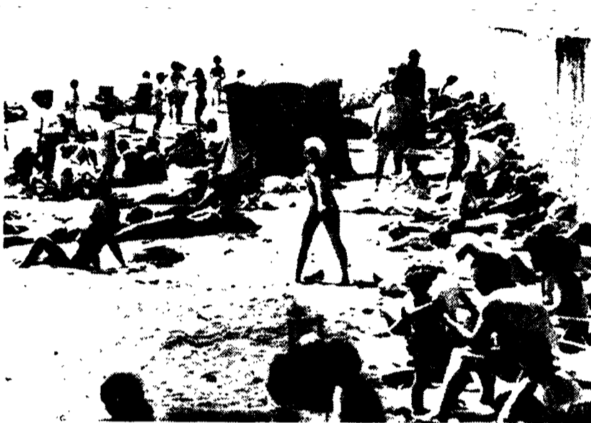
PRIME FOLLE SULLA SPIAGGIA. Dopo le tardive naviate, questo stravagante mese di aprile ci sta riservando alcune precoci giornate di sole in tutta Italia...

Annunciato l'acquisto di trecento carrozze per pendolari con cento posti ciascuna (ma sul piano tecnico ce ne sono di migliori) - Le omissioni del ministro Martelli in un discorso alla Transport Expo di Parigi - Solo nel '76 si appronterà il piano di ammodernamento delle FS - La «deviazione Fantani»