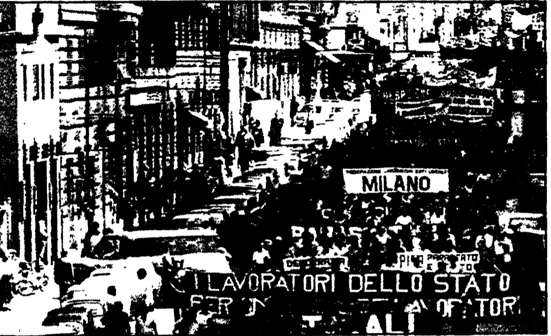
I lavoratori statali e parastatali ieri in sciopero per 24 ore hanno manifestato per le vie di Roma. Folte delegazioni giunte da tutta Italia...