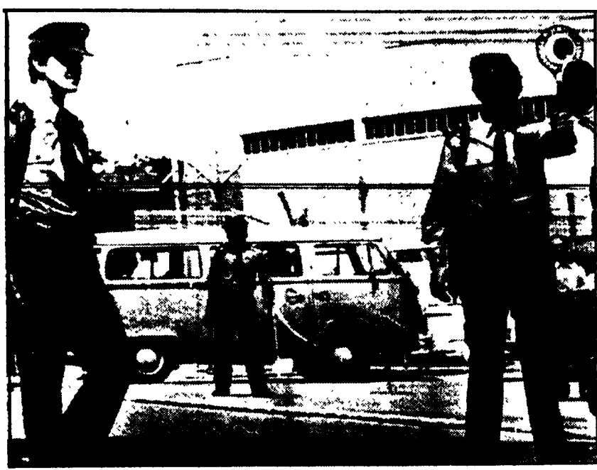
STOCCARDA - Agenti di polizia sorvegliano l'ingresso principale dell'edificio in cui si svolgerà da oggi il processo contro il gruppo Baader-Meinhof