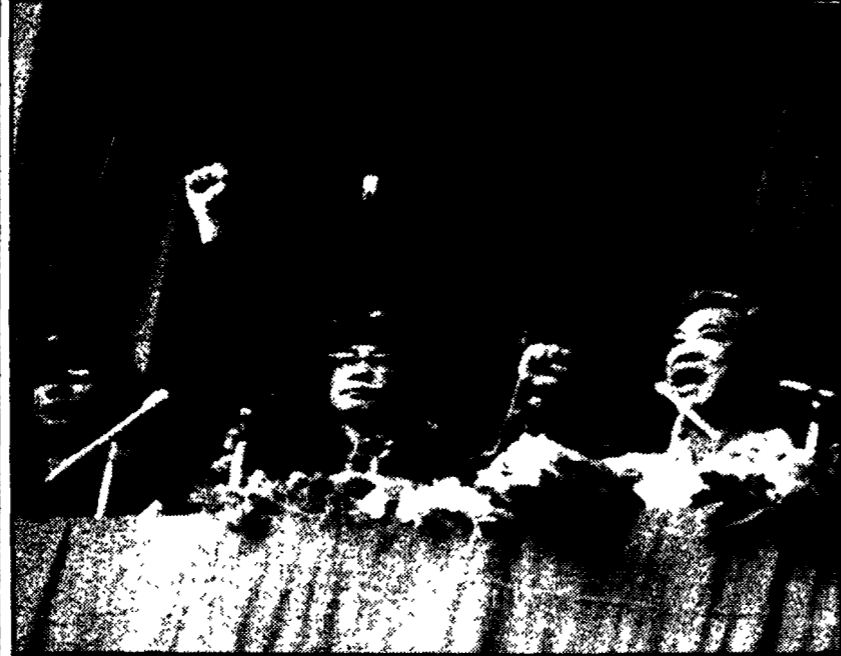
SAIGON - Il generale Tran Van Tra e gli altri membri del «comitato militare di amministrazione» di Saigon si presentano al pubblico nel corso della manifestazione dinanzi al «palazzo dell'indipendenza»

La Tass ha reagito oggi con severità ad una minacciosa intervista concessa dal segretario americano all'epoca James Schlesinger al settimanale «News and World Reports».