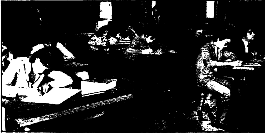
Studenti della terza media, ieri mattina, durante la prima prova d'esame: il tema d'italiano

Oggi la prova di lingua straniera - Pioggia di bocciature nelle classi intermedie - Oltre il 50% lascia gli studi dopo la licenza - Il ruolo dei consigli di circolo e di istituto