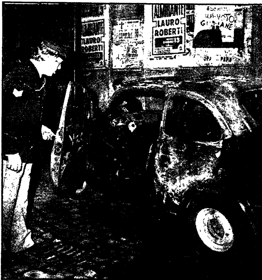
NAPOLI — Ecco i resti carbonizzati della « 500 » sulla quale viaggiava la giovane Iolanda Palladino, nel momento in cui fu attaccata dai fascisti con bottiglie incendiarie, al termine della manifestazione popolare per festeggiare il grande successo elettorale del PCI. Nella foto piccola Iolanda Palladino che nell'estremo tentativo di salvarla è stata trasportata ieri in un centro specializzato di Roma.