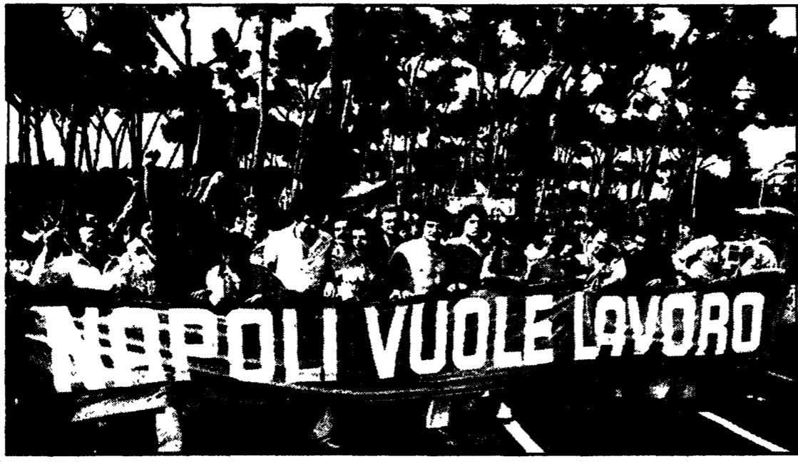
Lavoratori e disoccupati napoletani in corteo nei pressi di Villa Borghese