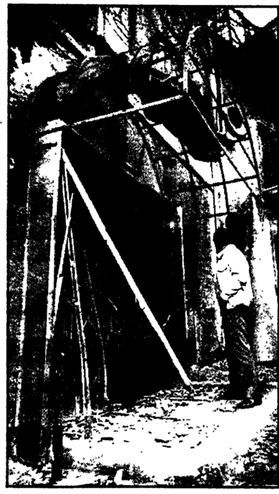
Uno dei locali danneggiati di recente da attentati: questa ed altre imprese rimaste misteriose con ogni probabilità sono da attribuire alle bande di tagleggiatori