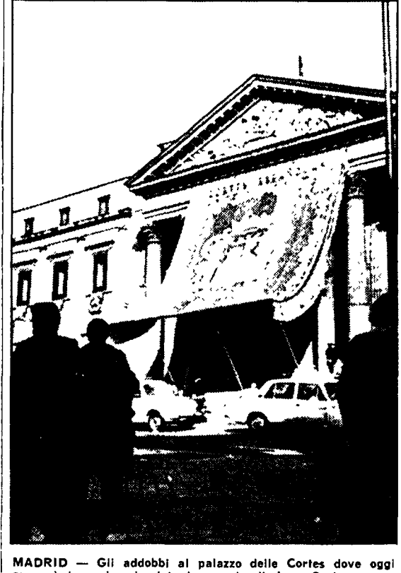
MADRID — Gli addobbi al palazzo delle Cortes dove oggi avverrà la cerimonia del giuramento di Juan Carlos.