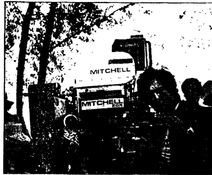
Nelle foto: a sinistra, Bernardo Bertolucci gira «Novecento» cavalcando la sua «Mitchell»; a destra, Gianni Amelio e la sua piccola macchina da presa registrano il cinema secondo Bertolucci.

Realizzato per la TV lo special «Il cinema secondo Bertolucci»