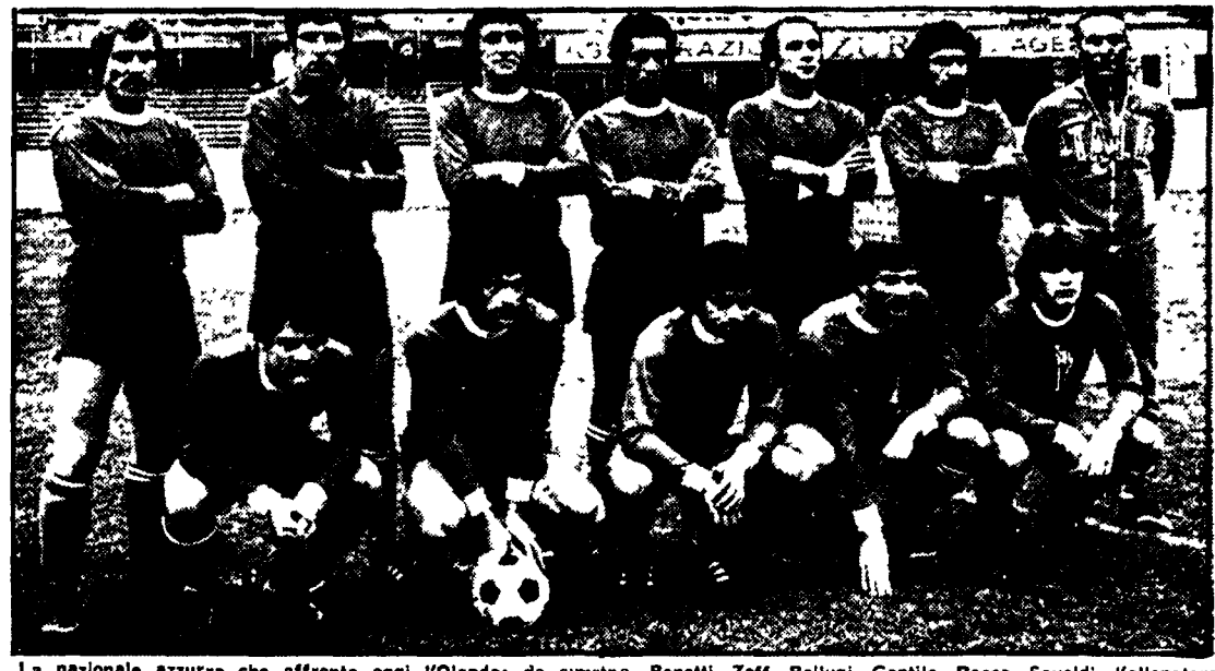
La nazionale azzurra che affronta oggi l'Olanda: da sinistra, Benetti, Zoff, Bellugi, Gentile, Rocca, Savoldi, l'allenatore Bearzot; accanto: Capello, Pulici, Causio, Facchetti e Antognoni