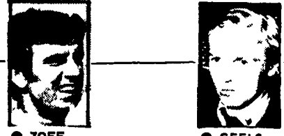
ZOFF ITALIA GEELS OLANDA