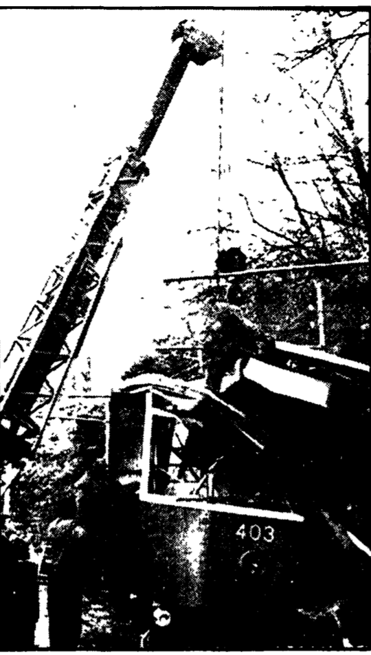
Deraglia il tram di Opicina