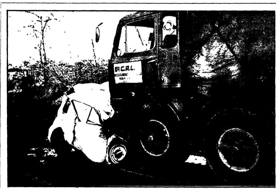
I resti della «500» scontratisi con un camion al 18° chilometro della Tiburtina

Dieci volte di più di quelli che può ospitare realmente - La denuncia è stata fatta ieri nel corso di un incontro fra consiglio di amministrazione e rappresentanti delle forze politiche e sindacali - Giannantoni: «Le responsabilità dei governi e della DC» - Sollecitato un piano organico di interventi