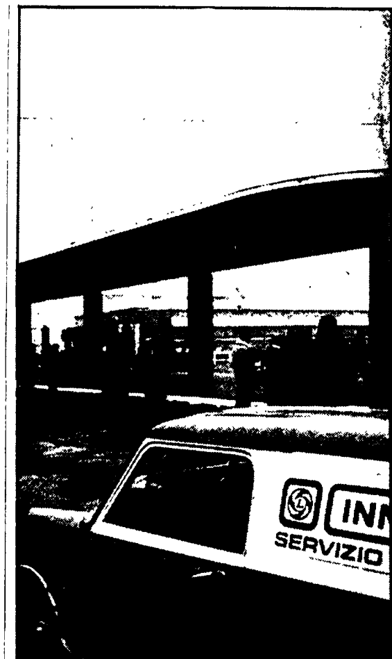
Uno dei piazzali interni della Innocenti presidati