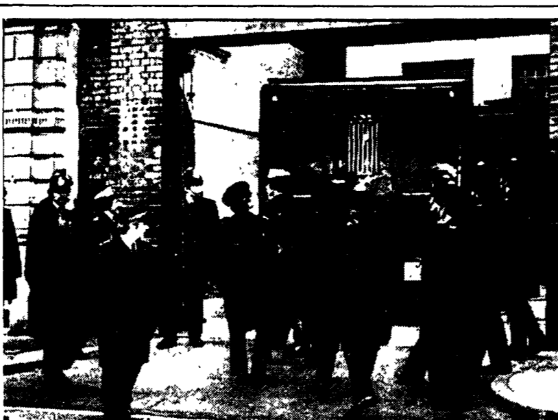
TERRORISTI IN TRIBUNALE. I terroristi, presunti dell'IRA, che sono stati nei giorni scorsi protagonisti a Londra della drammatica vicenda di Balcombe Street (dove due coniugi sono stati tenuti per alcuni giorni in ostaggio) sono comparsi ieri in tribunale per la udienza preliminare, secondo la procedura britannica. Il loro trasferimento nei locali della Corte ha luogo ad un imponente schieramento di forze pubbliche. Nella foto: agenti davanti al tribunale per l'arrivo del cellulare con a bordo i terroristi

Per iniziativa del Comitato Italia-Spagna