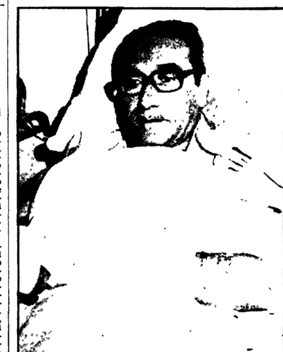
ANCONA — Il presidente della sezione civile del tribunale, dottor Vittorio Liberatore, in ospedale

Ad Ancona, protagonista un uomo esasperato e malato di nervi «Ho con me una bomba» e la lancia in tribunale contro un magistrato L'ordigno gli è scoppiato addosso maciullandogli il braccio destro - Feriti il presidente della sezione civile e un avvocato - La revoca di una licenza all'origine della vicenda