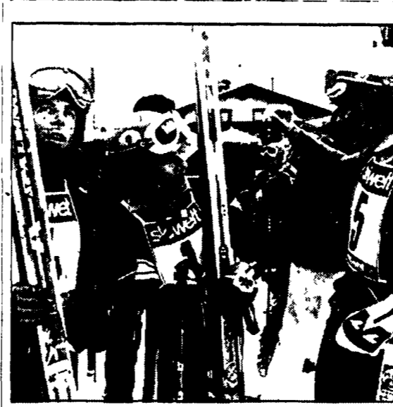
DOMANI TORNA THOENI. A Cortina d'Ampezzo, dopo un periodo di assenza di 20 anni, si svolgerà la prima parte del primo periodo della Coppa del mondo femminile.