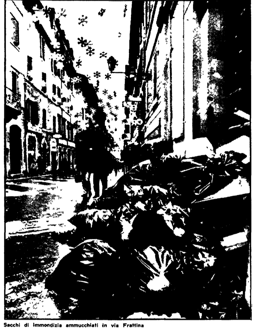
Sacchi di immondizia ammassati in via Fratrina

Affidato alle circoscrizioni l'incarico di organizzare il lavoro di raccolta con mezzi privati - Un documento della Federazione comunista - Militanti del Partito e dei circoli della FGCI impegnati a contribuire alle operazioni di sgombero - Impudente minaccia di continuare l'agitazione « fino a far scoppiare il colera »