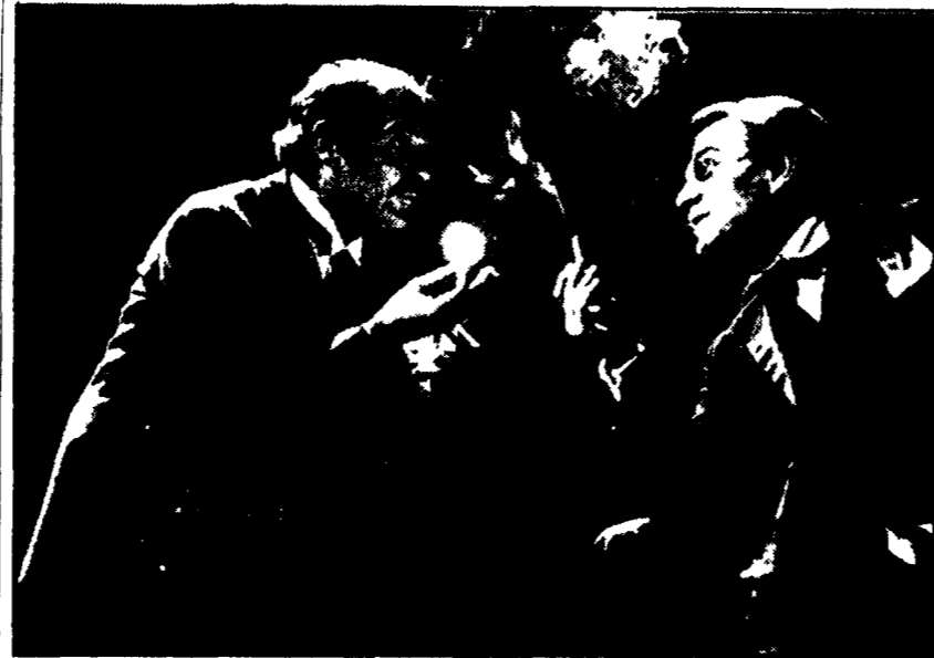
Omero Antonutti e Giorgio Albertazzi in una scena del «Fu Mattia Pascal»

La lineare trascrizione scenica del romanzo curata da Kezich non sempre mette in luce la profonda frattura di tutta una società che è dietro un caso di inadattabilità individuale