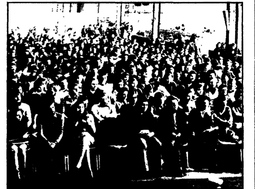
La prima giornata di dibattito sulla relazione di Renzo Imbeni al XX Congresso nazionale della FGCI in corso a Genova...

La radio di Lourenço Marques ha annunciato il fallimento di un colpo di Stato a cui avrebbero partecipato circa quattrocento uomini armati. Numerosi i morti e gli arresti.