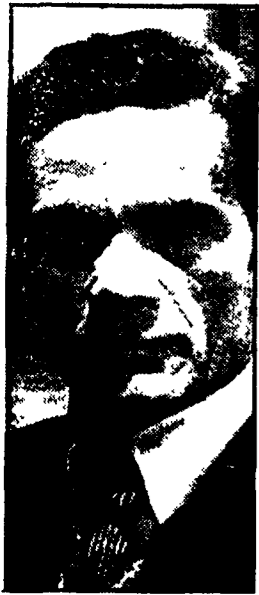
Pier Paolo Pasolini