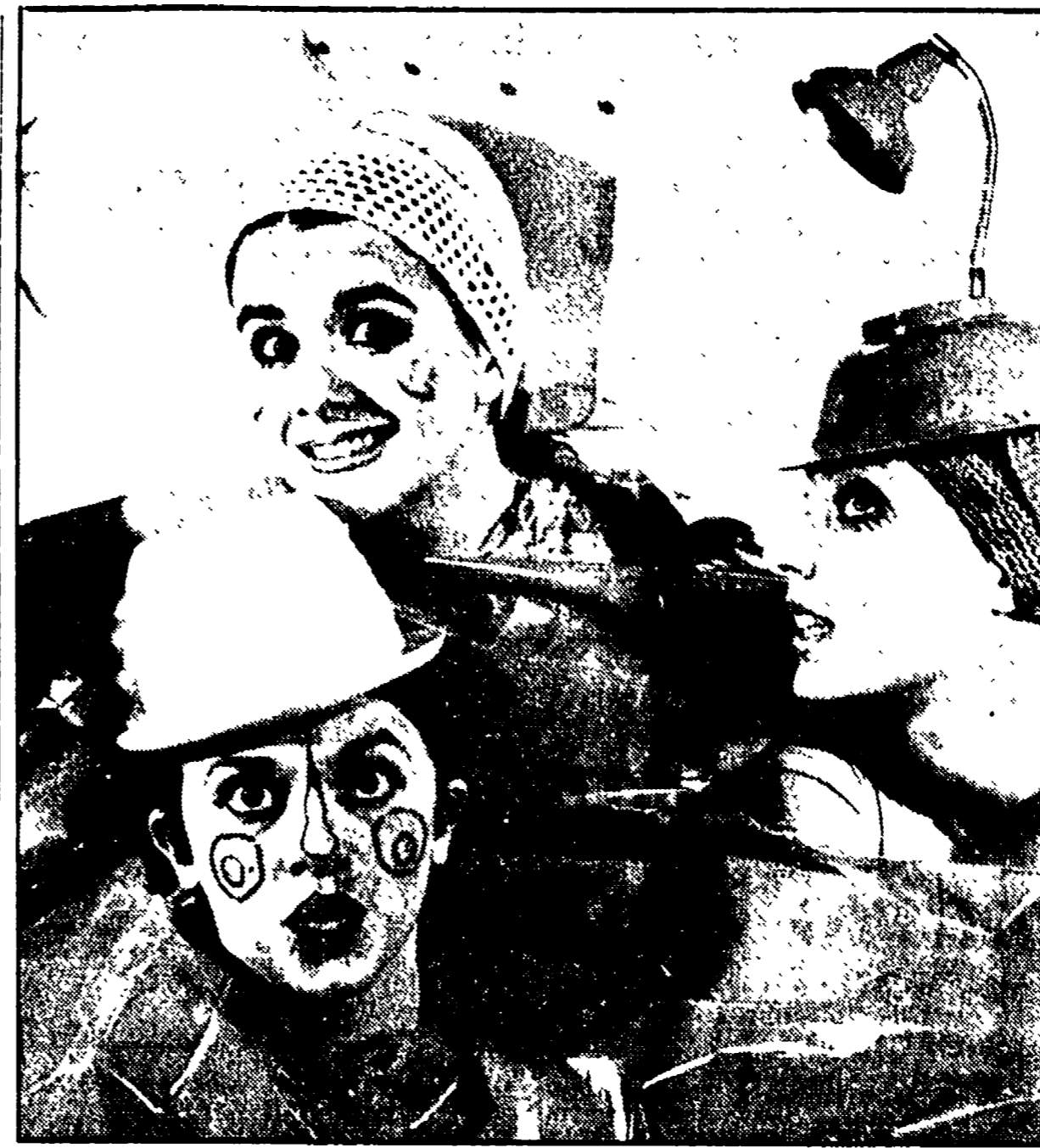
Stasera a Borgo S. Lorenzo