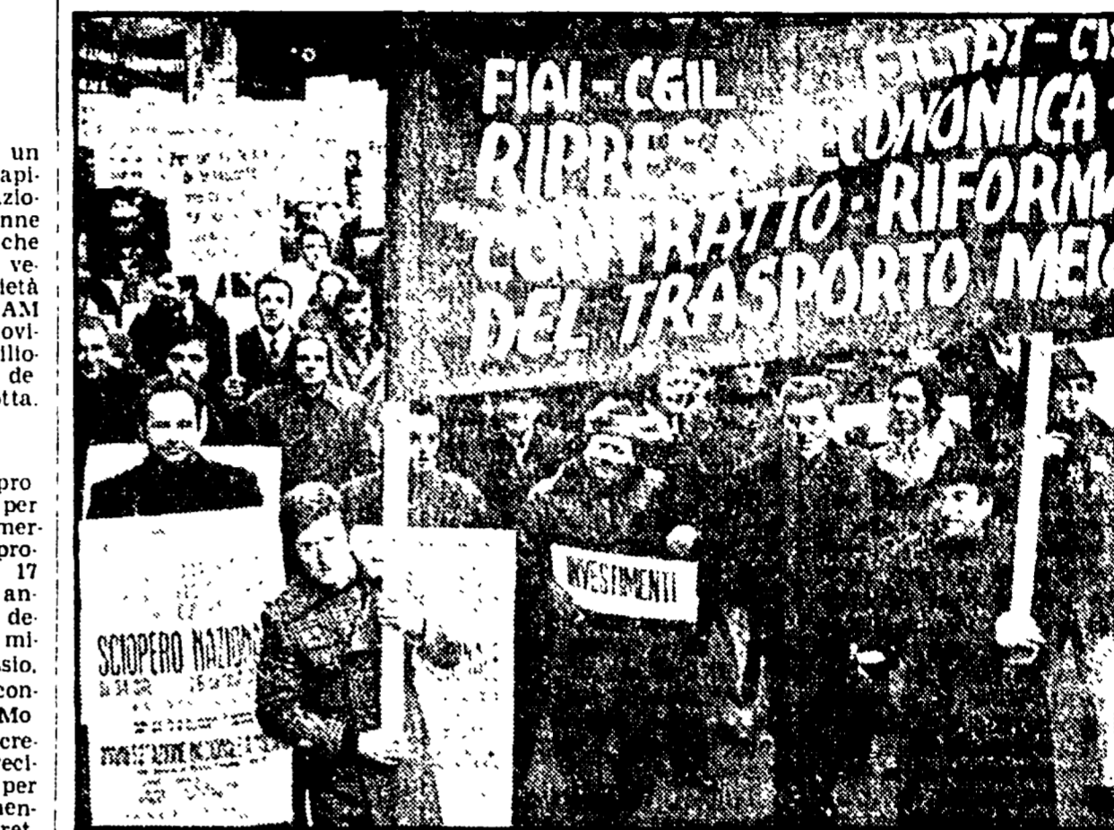
SCIOPERO NELL'AUTOTRASPORTO. Diverse migliaia di lavoratori hanno dato vita ieri per la prima volta ad una manifestazione di massa...