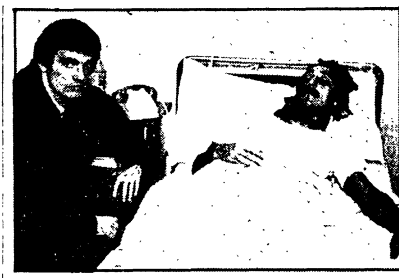
BINI in visita a SPADONI al Policlinico Gemelli

Iniziata sotto i migliori auspici la nuova stagione automobilistica