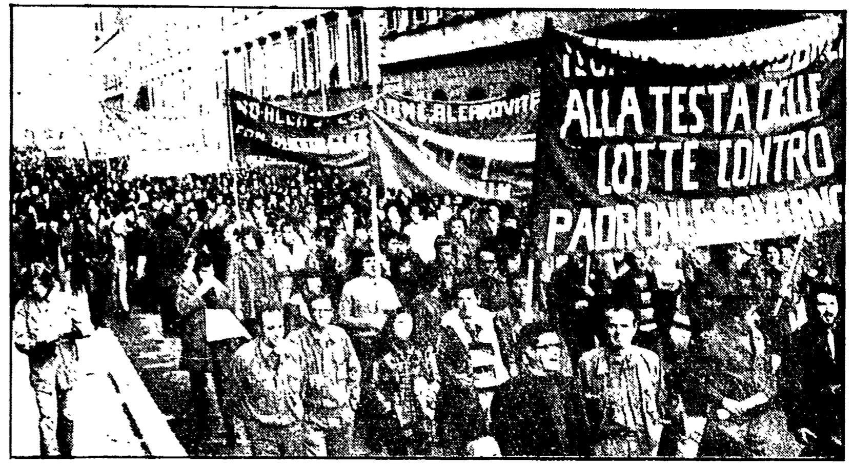
Una recente manifestazione di lavoratori metalmeccanici.

Per misurare i termini reali e concreti della crisi economica che sta investendo la provincia di Grosseto, occorre muoversi partendo da alcuni dati sulla situazione occupazionale.