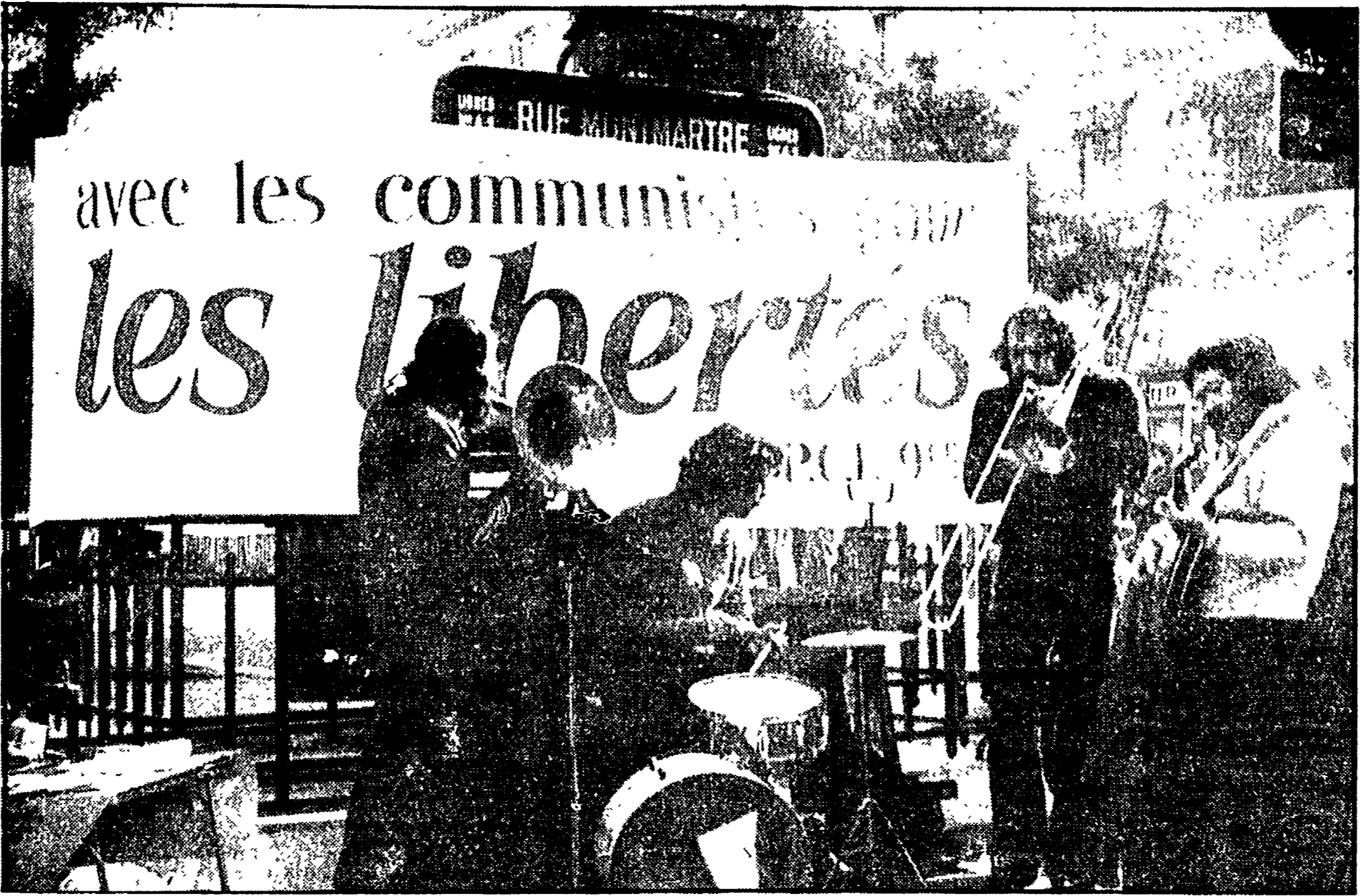
PARIGI — «Con i comunisti per le libertà»: un cartellone a una manifestazione organizzata dal PCF

Il progetto di documento che definisce la «via francese» per la costruzione di una società socialista - Le affermazioni di Georges Marchais sulla nozione di «dittatura del proletariato», che il PCF aveva sinora mantenuto nello Statuto - Una vivace discussione che mette in primo piano il valore delle libertà democratiche - La formula di «partito di avanguardia e partito di massa» - Il tema del rinnovamento dei costumi e di una nuova morale