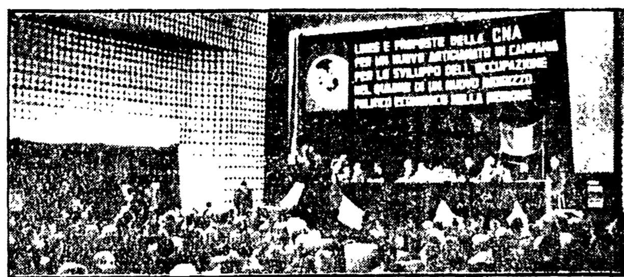
Una fase della manifestazione regionale della CNA nel cinema S. Lucia