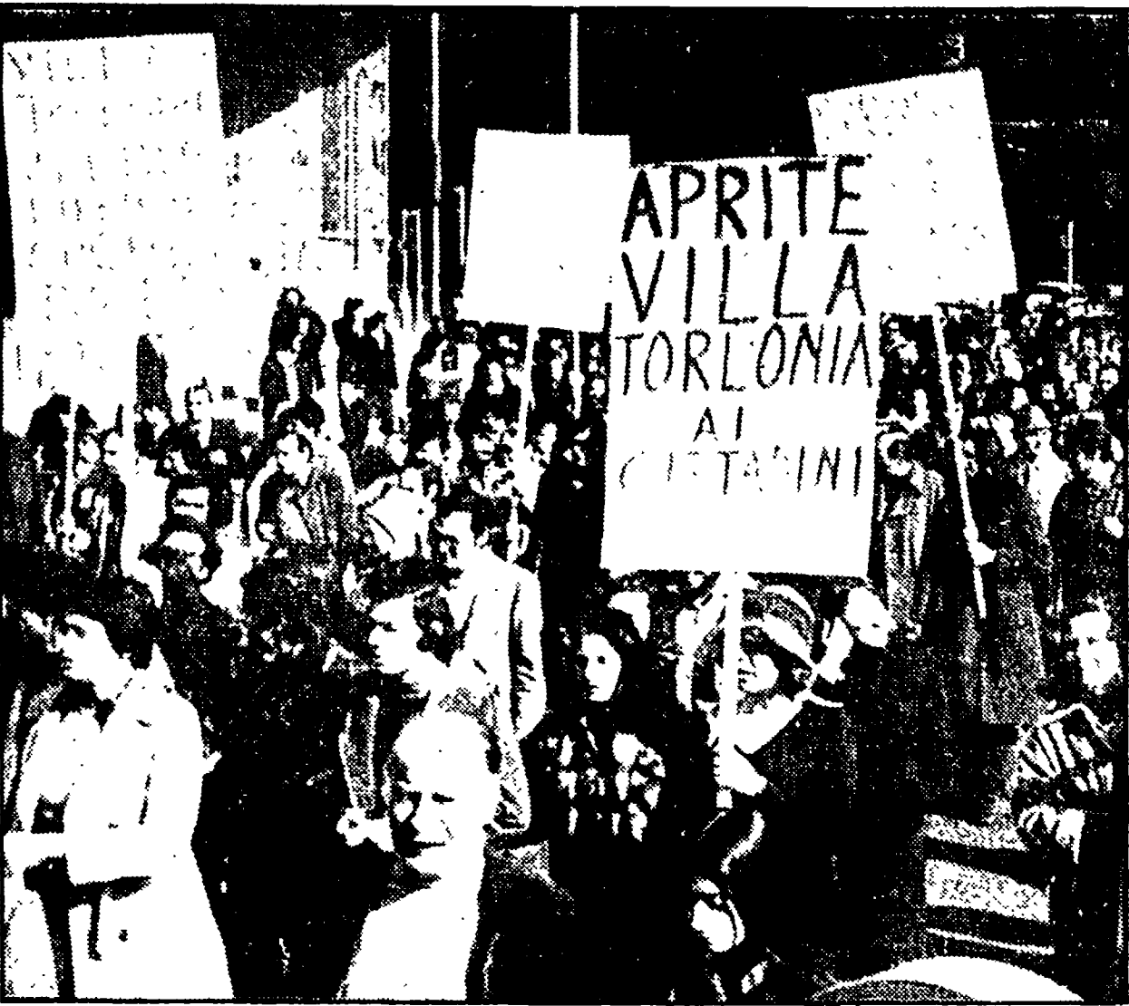
CORTEO UNITARIO PER VILLA TORLONIA

Villa Torlonia deve essere aperta subito. Con questa parola d'ordine, domenica mattina, un migliaio di cittadini ha sfilato attraverso il quartiere Nomentano. La manifestazione era stata indetta dal comitato di quartiere ma ad essa si sono uniti cittadini provenienti da altre zone.