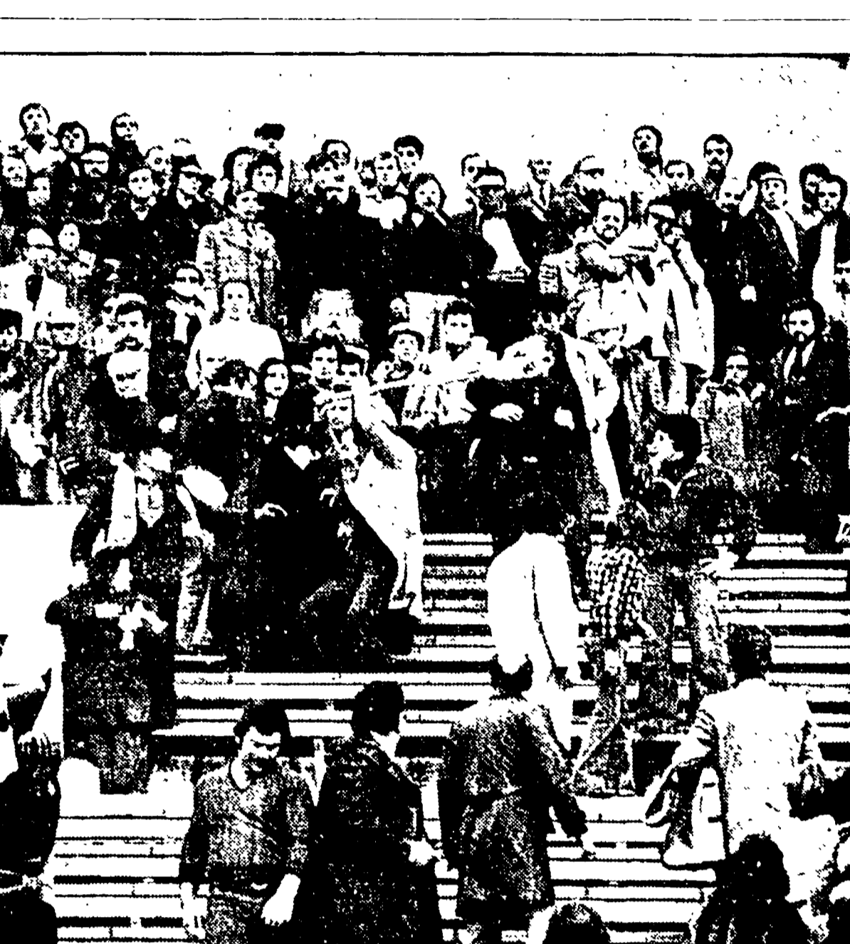
Un'immagine del selvaggio pestaggio all'Olimpico.

Nell'ambito dell'inchiesta del nostro giornale sulla situazione delle varie facoltà dell'ateneo perugino, ospitiamo oggi l'intervento di un gruppo di docenti e studenti democratici della facoltà di Magistero. PERUGIA, 23. Nell'attuale crisi generale del paese, le istituzioni educative e, in primo luogo, dell'Università, rivelano sempre più lo stato di disagio morale, il disorientamento intellettuale, l'arretramento culturale in cui, giorno dopo giorno, si vuol far scivolare il paese, per una ben precisa scelta di campo politica. Se tutta l'università è in crisi e rimane estranea alle esigenze culturali nuove che il paese pone e che gli grandi masse esprimono, le facoltà di Magistero possono addirittura essere prese a simbolo di questo profondo disagio per le loro funzioni culturali e professionali oggettivamente superate.