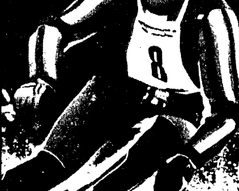
GROS spera di aver ragione di Stenmark