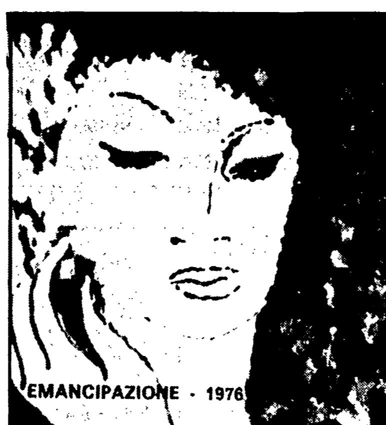
EMANCIPAZIONE - 1976