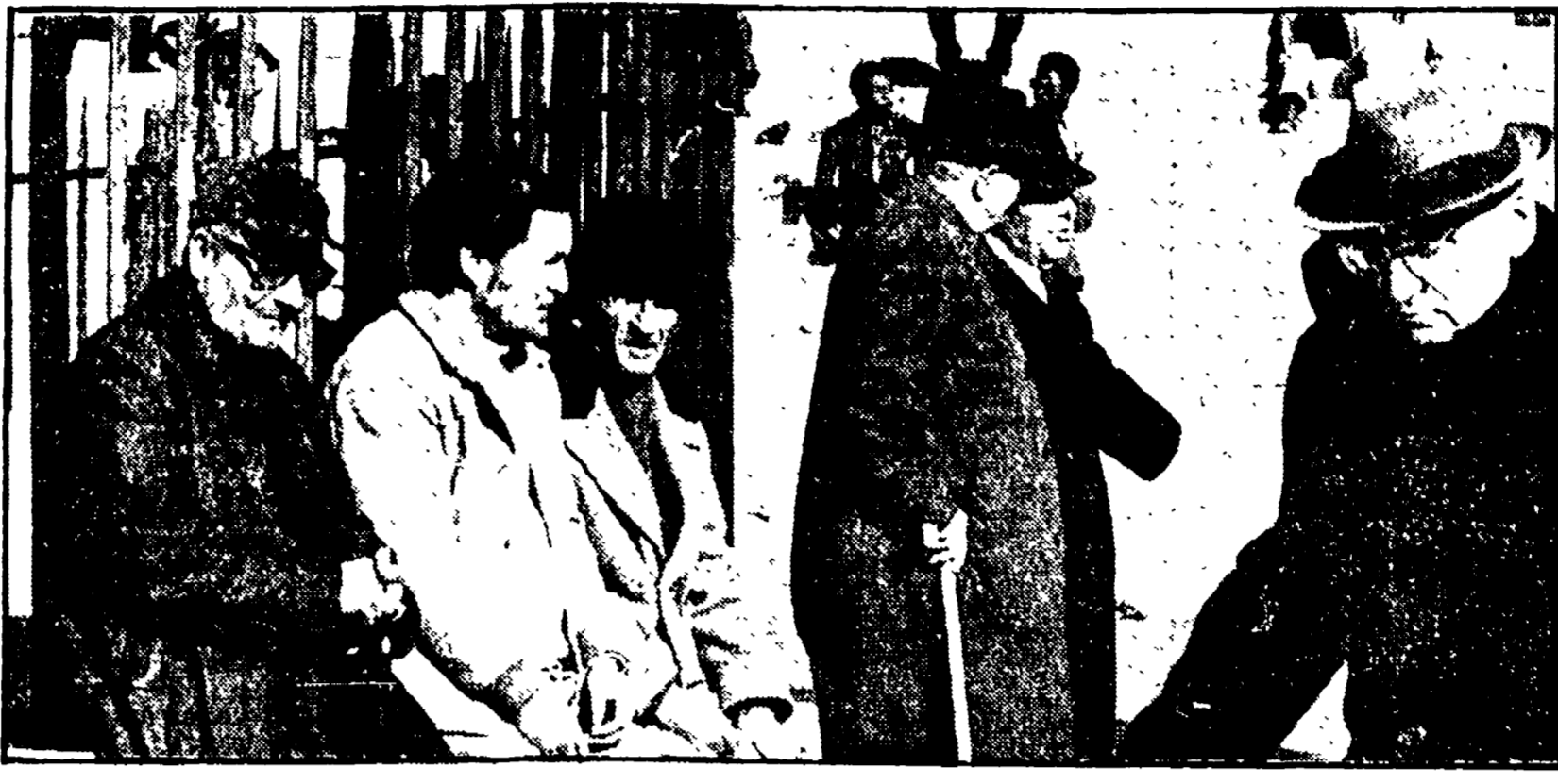
L'iniziativa del Comune di Perugia rappresenta un importante passo in avanti per risolvere il problema degli anziani

A causa dei gravi tagli al bilancio comunale non potranno essere gratuiti per tutti - Garantito ogni tipo di servizio - Equipe di infermieri seguiranno i villeggianti per tutto il periodo di vacanza