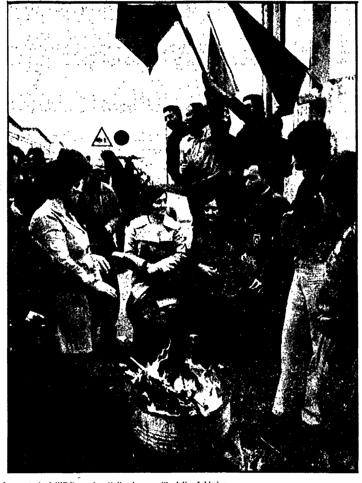
Lavoratori dell'Edison-giocattoli ai cancelli della fabbrica