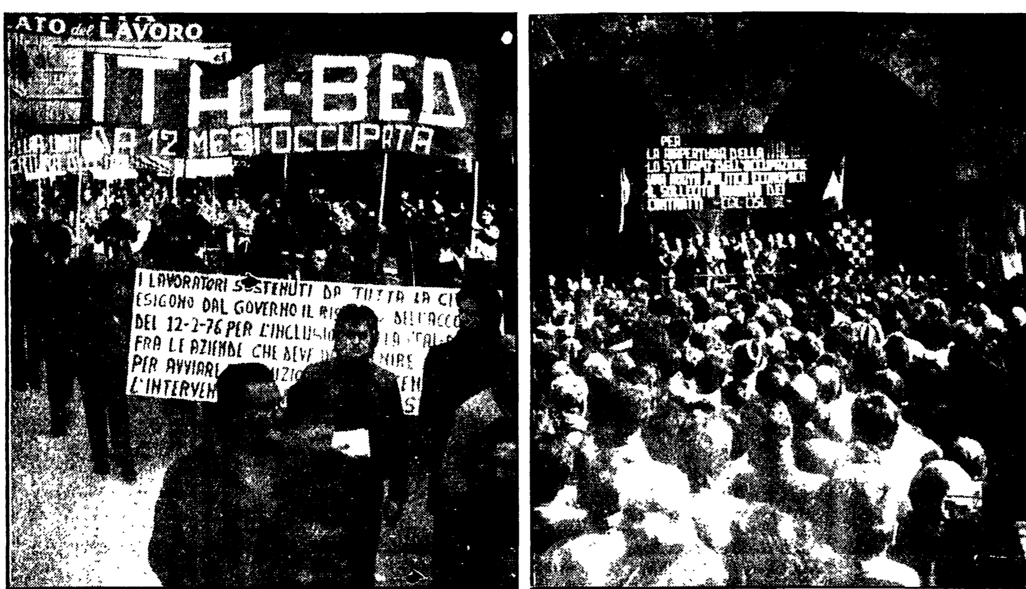
Due momenti della manifestazione provinciale con Luciano Lama svoltasi ieri a Pistoia

PISTOIA. 4. Ancora una volta Pistoia e l'intera provincia sono scese in lotta per manifestare il loro appoggio ai lavoratori dell'Ital Bed « punto caldo dell'azione operaia contro la "liquidazione" della fabbrica... »