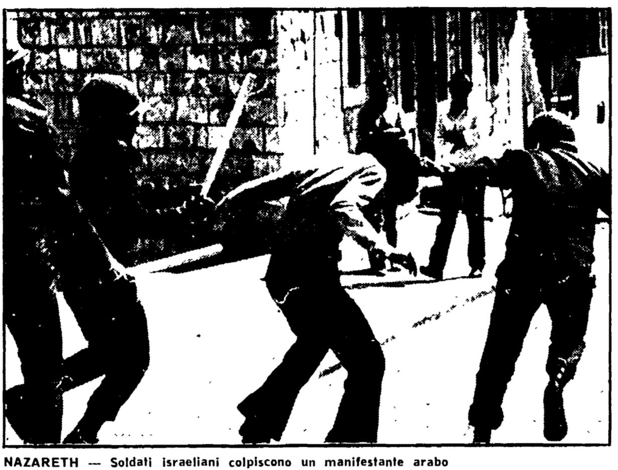
NAZARETH — Soldati israeliani colpiscono un manifestante arabo

TEL AVIV, 30. La polizia e l'esercito d'Israele hanno represso spietatamente nel sangue le più vaste e imponenti e violente manifestazioni arabe della storia palestinese, dopo la spartizione del paese. Sette arabi sono stati uccisi, decine feriti, alcuni molto gravemente. Anche 38 fra soldati e poliziotti sono rimasti feriti e costretti da pietra o sasso.