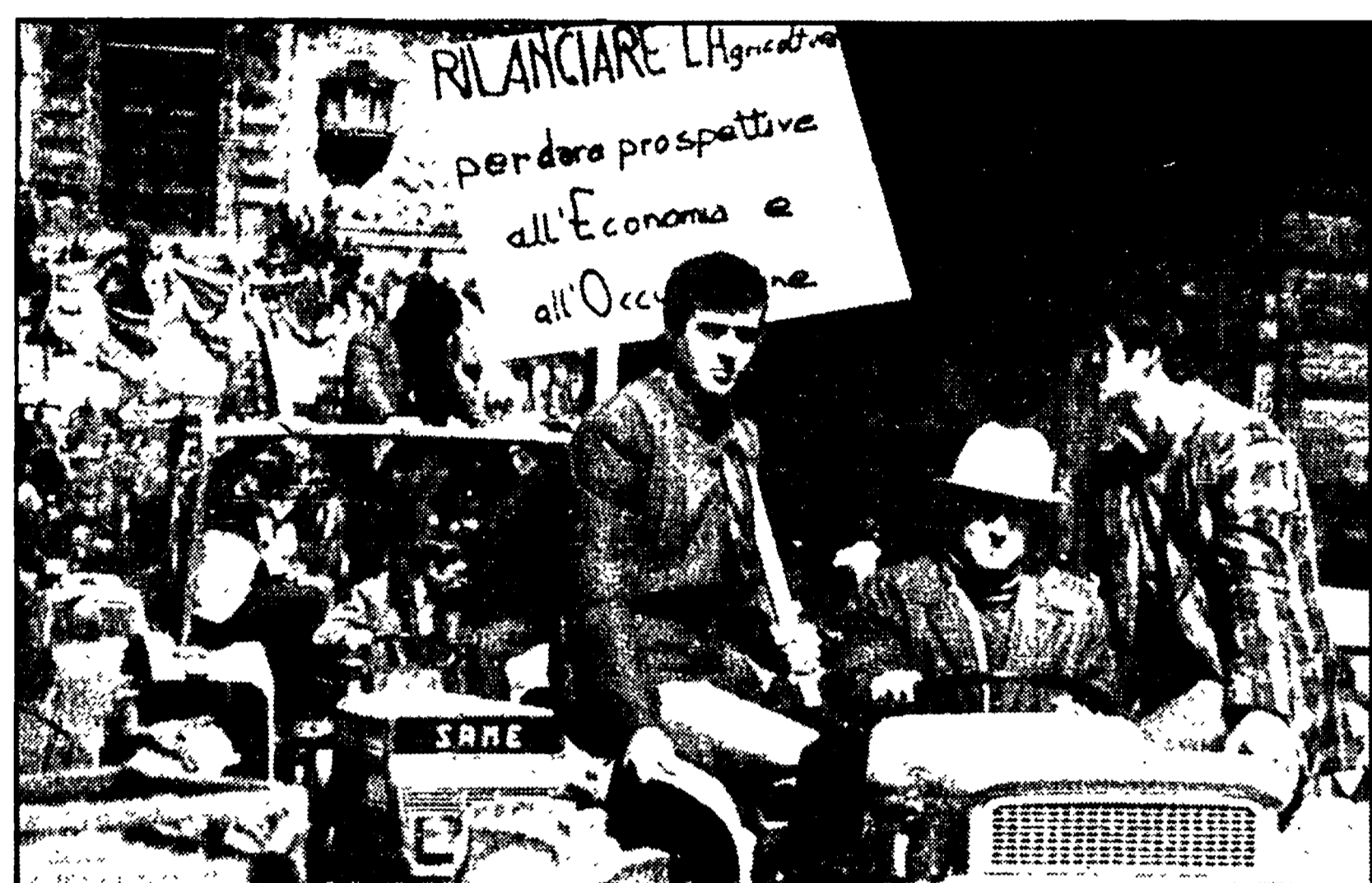
I trattori alla testa del corteo di agricoltori per le strade di Perugia