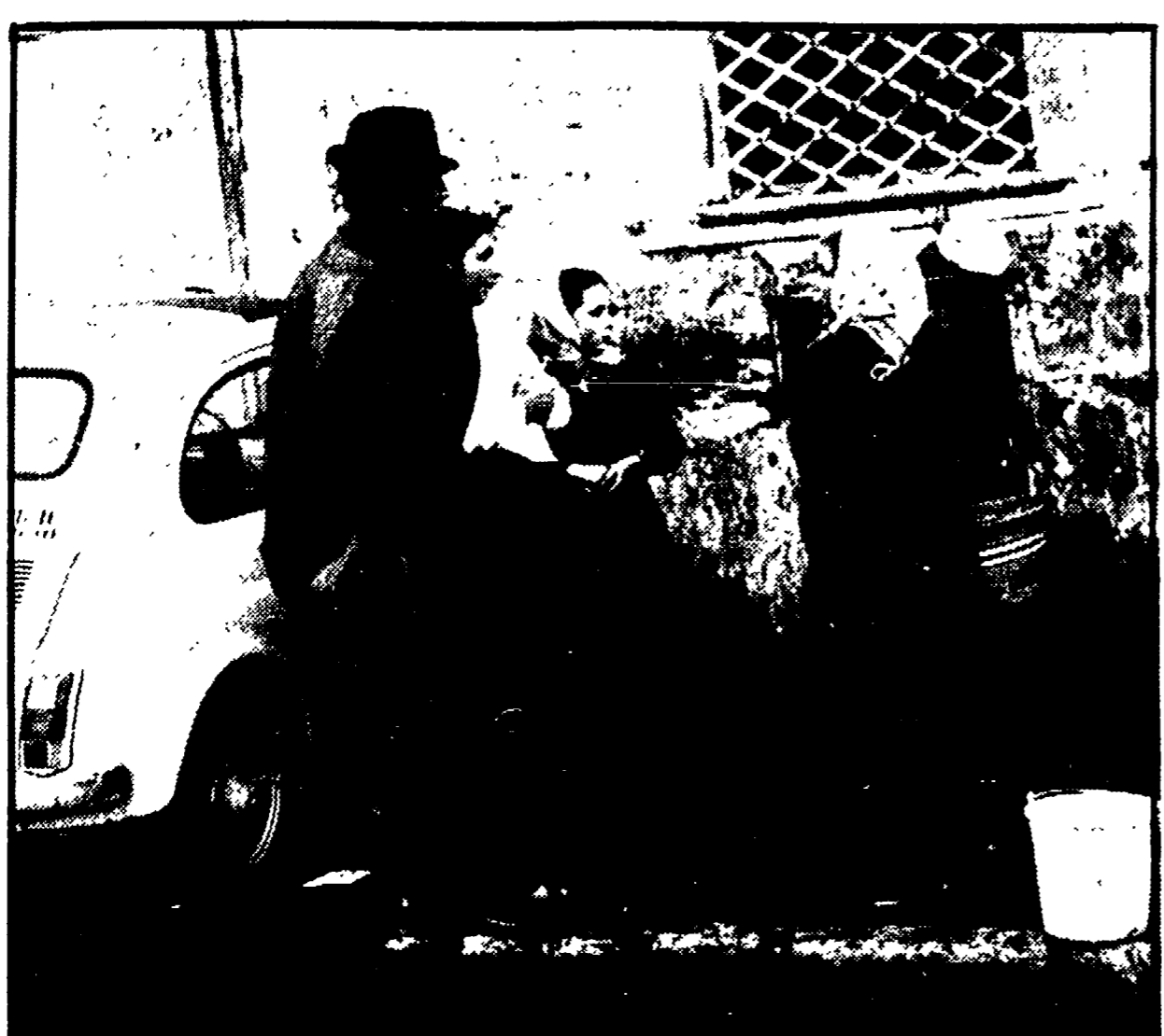
Coda dinanzi alle fontane per l'approvvigionamento d'acqua