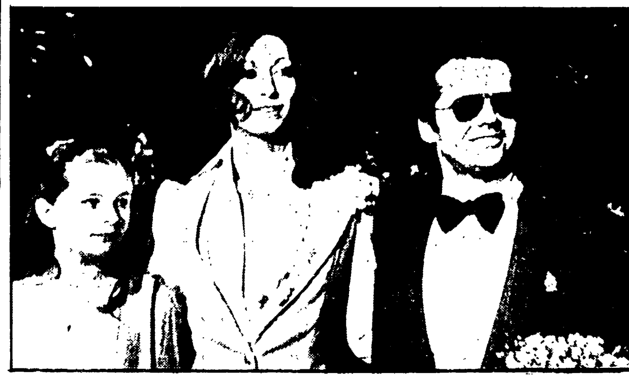
Jack Nicholson mentre si reca, accompagnato dalla moglie e dalla figlia, alla cerimonia della consegna dei Premi Oscar