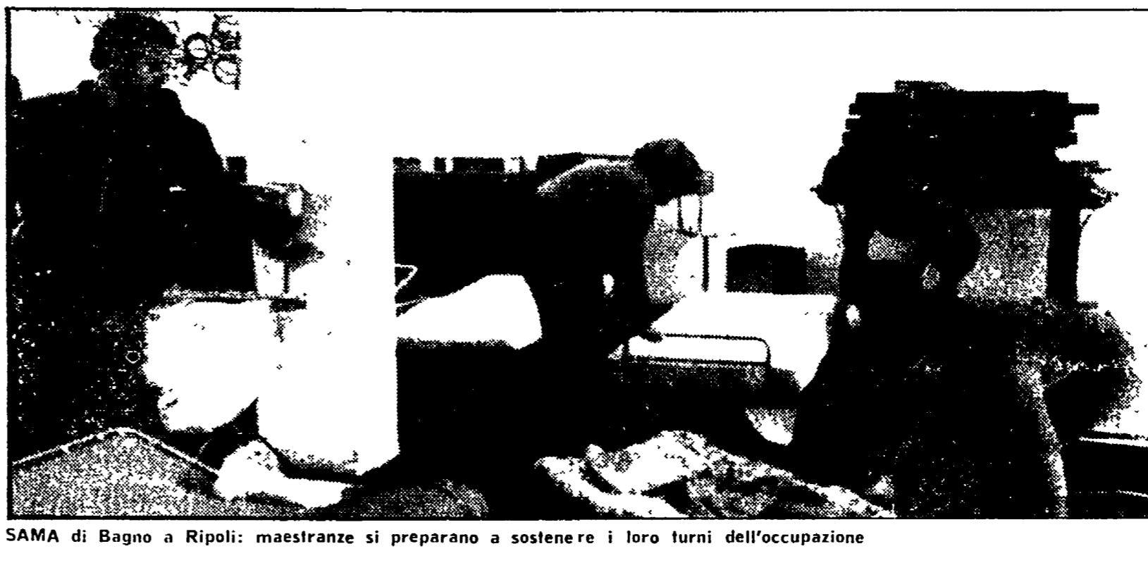
SAMA di Bagno a Ripoli: maestranze si preparano a sostenere i loro turni dell'occupazione

BAGNO A RIPOLI, 30 - «Questa azienda, per forza cessata attività, si vede costretta a un'operazione di salvataggio», ha detto il presidente di lavoro dal 27 marzo 1976 Spacetti di quanto sopra, le comunichiamo inoltre che disponiamo di tutti i documenti di lavoro». Cinque righe fredde, taglianti come la lama di un rasoio, 168 lettere di licenziamento ricevute da un centinaio di operai della SAMA, una fabbrica di lampadari e apparecchi elettrici di Bagno a Ripoli, grosso comune del circondario fiorentino.