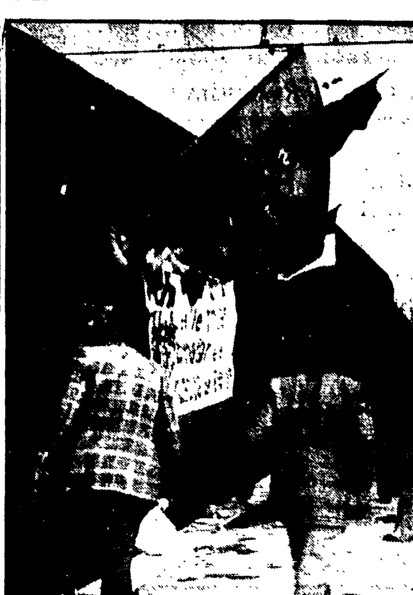
PALERMO - I terremotati del Belice sul treno alla stazione di Palermo