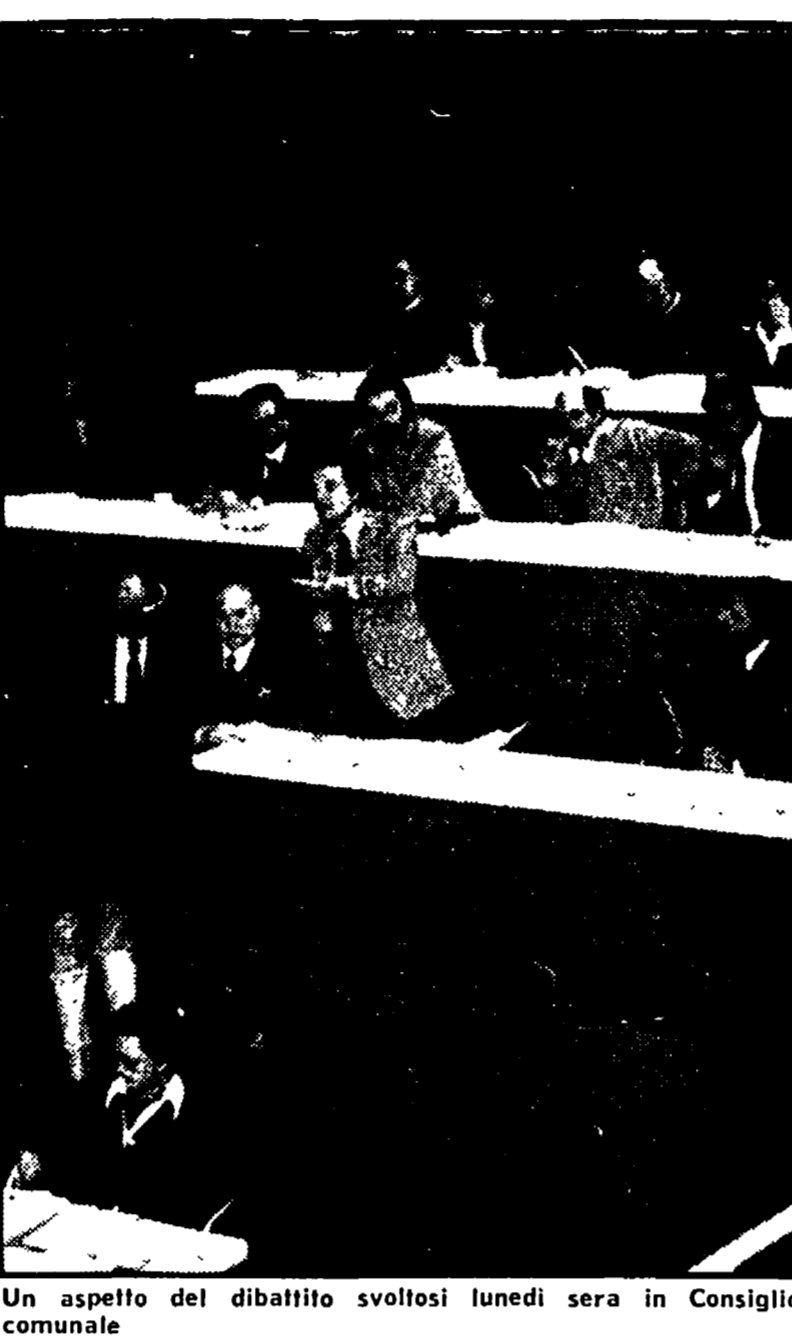
Un aspetto del dibattito svolto lunedì sera in Consiglio comunale

Questo è quanto si è notato nelle ultime sferzate del consiglio e particolarmente in quella di ieri, terminata purtroppo con un nulla di fatto. Dopo il dibattito, cui hanno partecipato i rappresentanti di tutti i partiti (per il misurarsi in legge elettorale impone, infatti, a questo punto, una rapida decisione per la scelta del sindaco, in assenza della quale scatta l'alternativa di ripiego e per questo colpevole del commissario prefettizio).