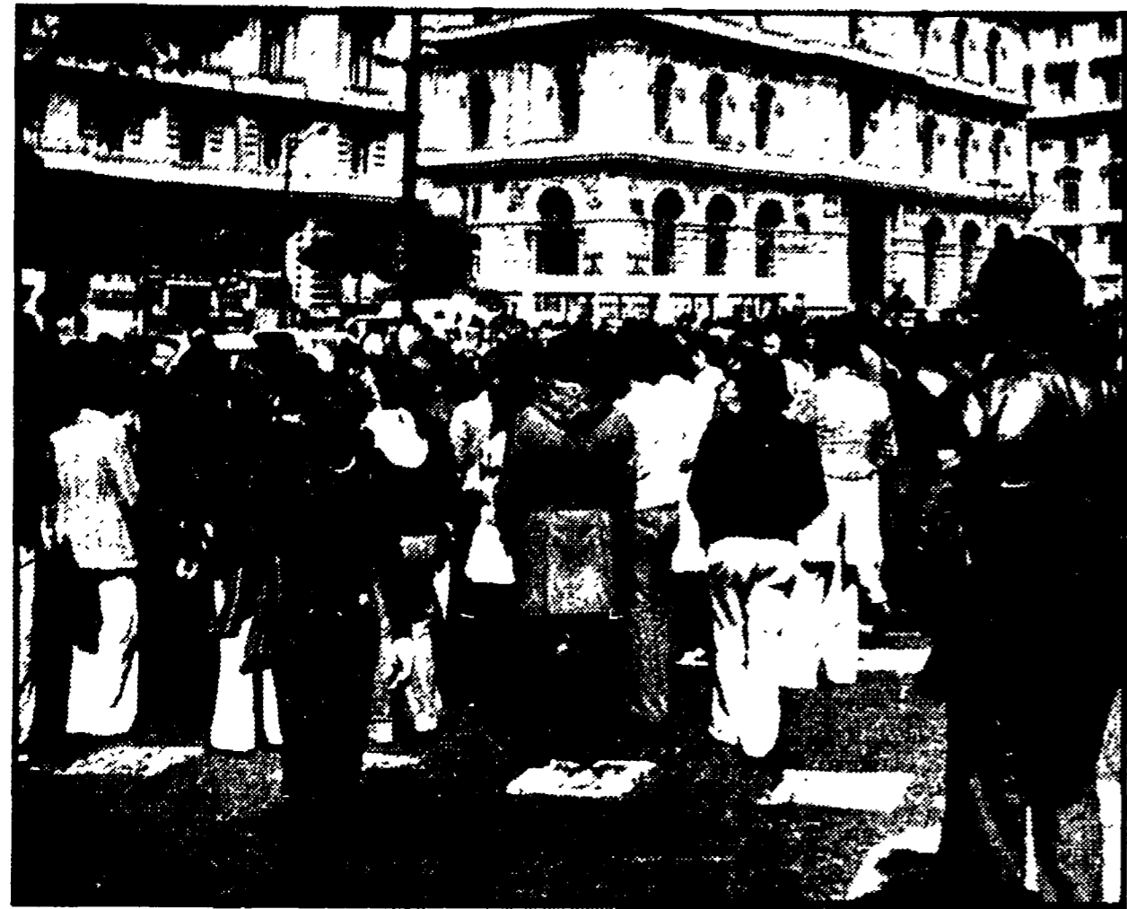
I disoccupati in corteo qualche momento prima dell'assurda carica della polizia

Sollecitato un incontro con il presidente del Consiglio — Forti critiche per l'indiscriminato intervento della polizia, che ha favorito il teppismo di una minoranza di provocatori — E' stato sollecitato il rilascio dei ventinove arrestati — Riunione al Comune per i duemila posti di lavoro