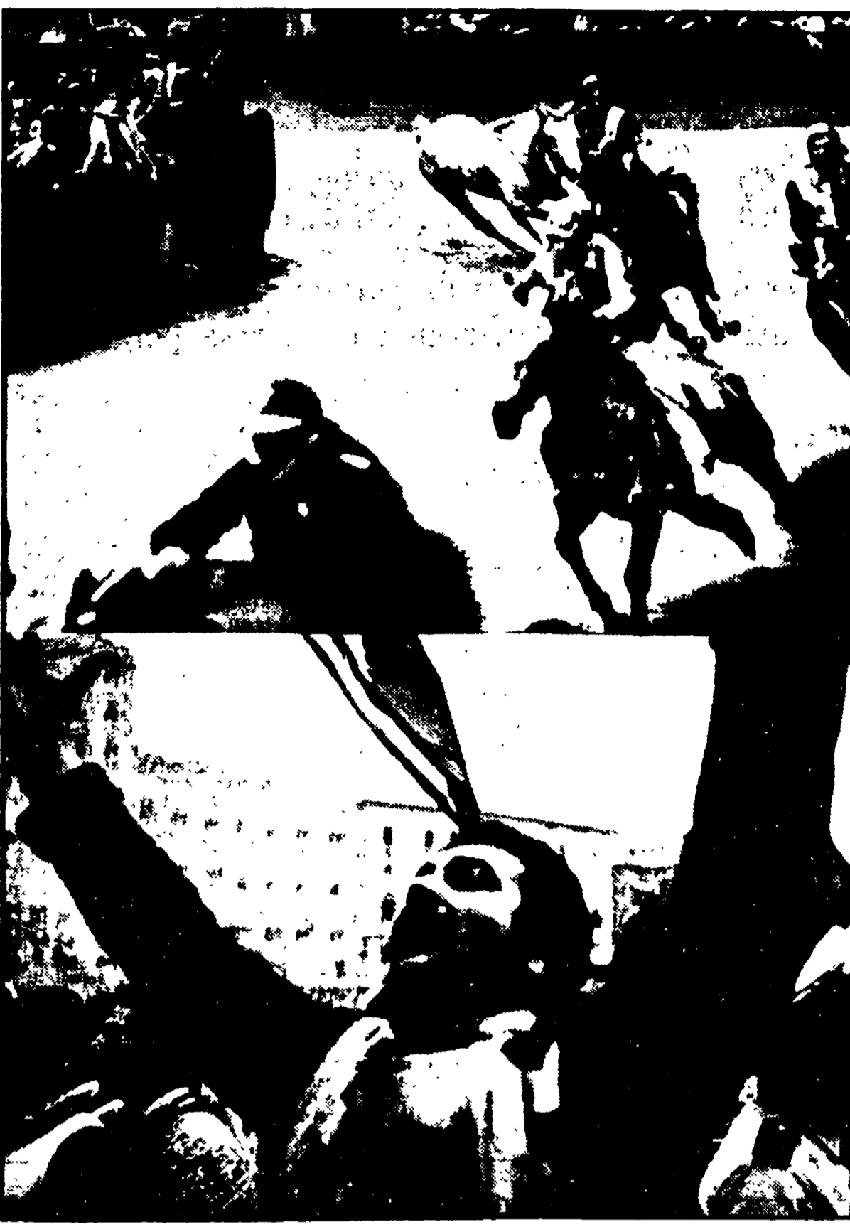
«Italia: un ritratto non autorizzato», con una introduzione di Franco Ferrarotti ed una bellissima serie fotografica di Massimo Piersanti, è una pubblicazione dell'Alitalia. Questa monografia, che raccoglie sequenze di immagini di tradizionali feste popolari, vuole cogliere momenti in cui un popolo si rivela al meglio, appunto nelle sue feste. Nella foto: una bella immagine del « Palio di Siena ».

Al gruppo del collaboratore iniziale (Tegoni, Benso, Battaglia) viene riportata l'attività di un approccio originale, seppure ancora in corso, alle opere degli autori stranieri del Novecento, con l'aggiungimento di una conseguente valorizzazione degli autori italiani di maggiore « respiro europeo » (e, tra questi, naturalmente, Basso e Svevo).