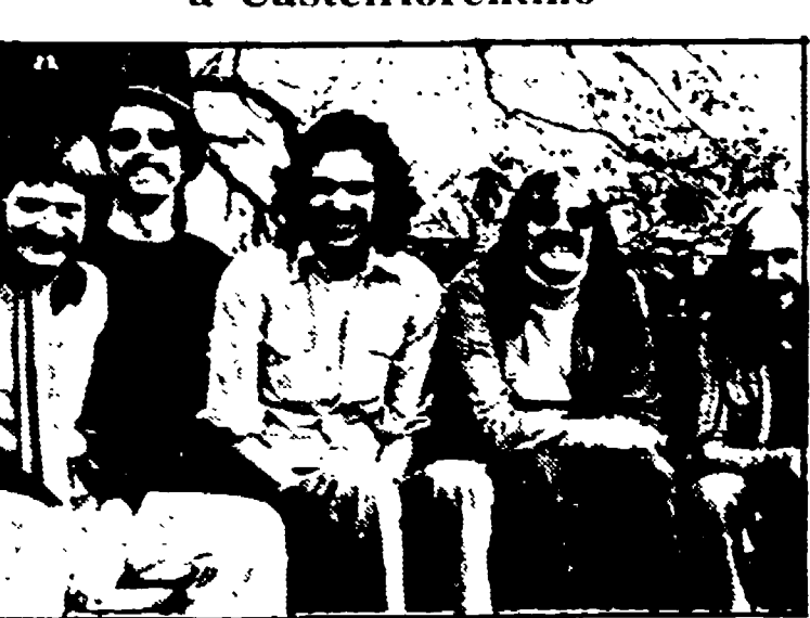
I Soft Machine a Castelfiorentino