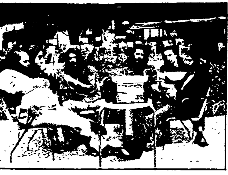
Il « Banco » a Campi