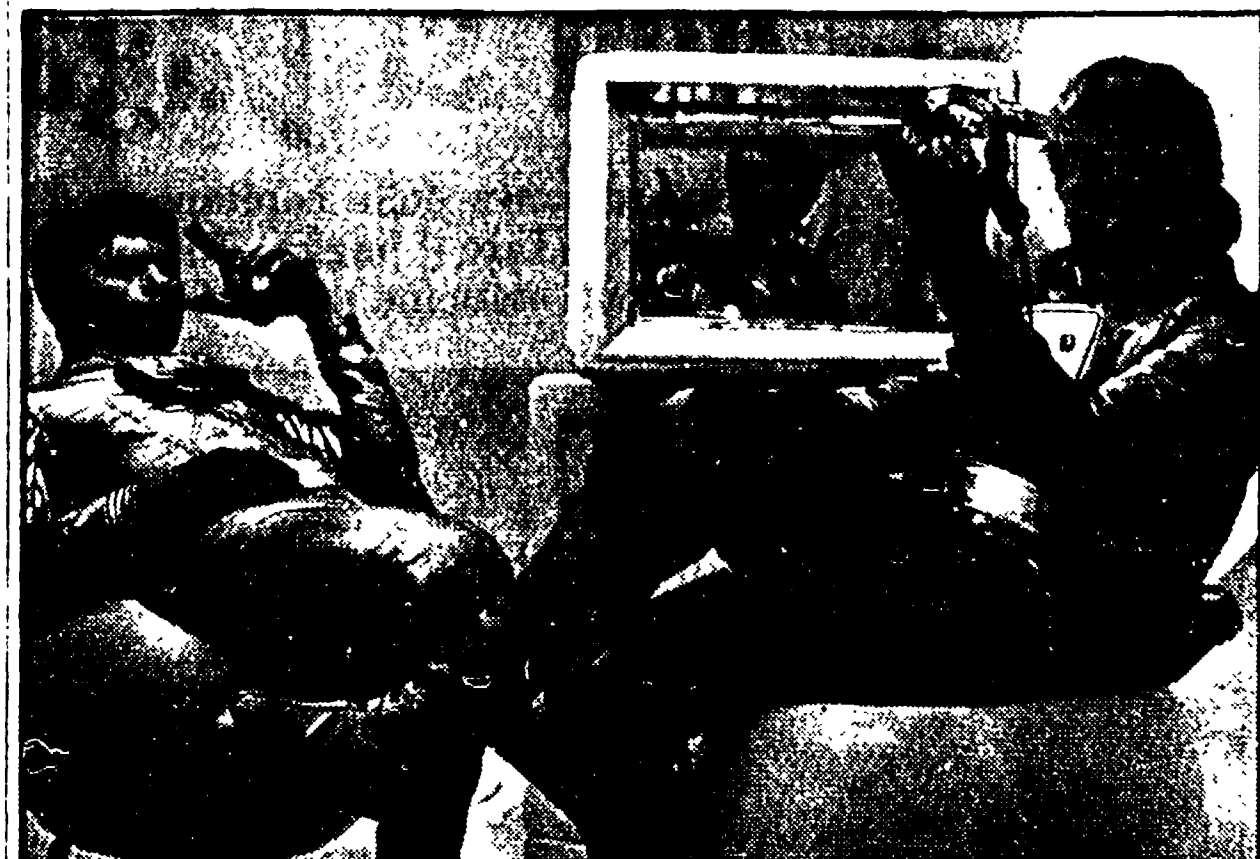
TRIESTE - E' giunto alle ultime battute il XIV Festival internazionale del film di fantascienza, che anche quest'anno ha visto la partecipazione di numerose opere delle più importanti cinematografie del mondo.