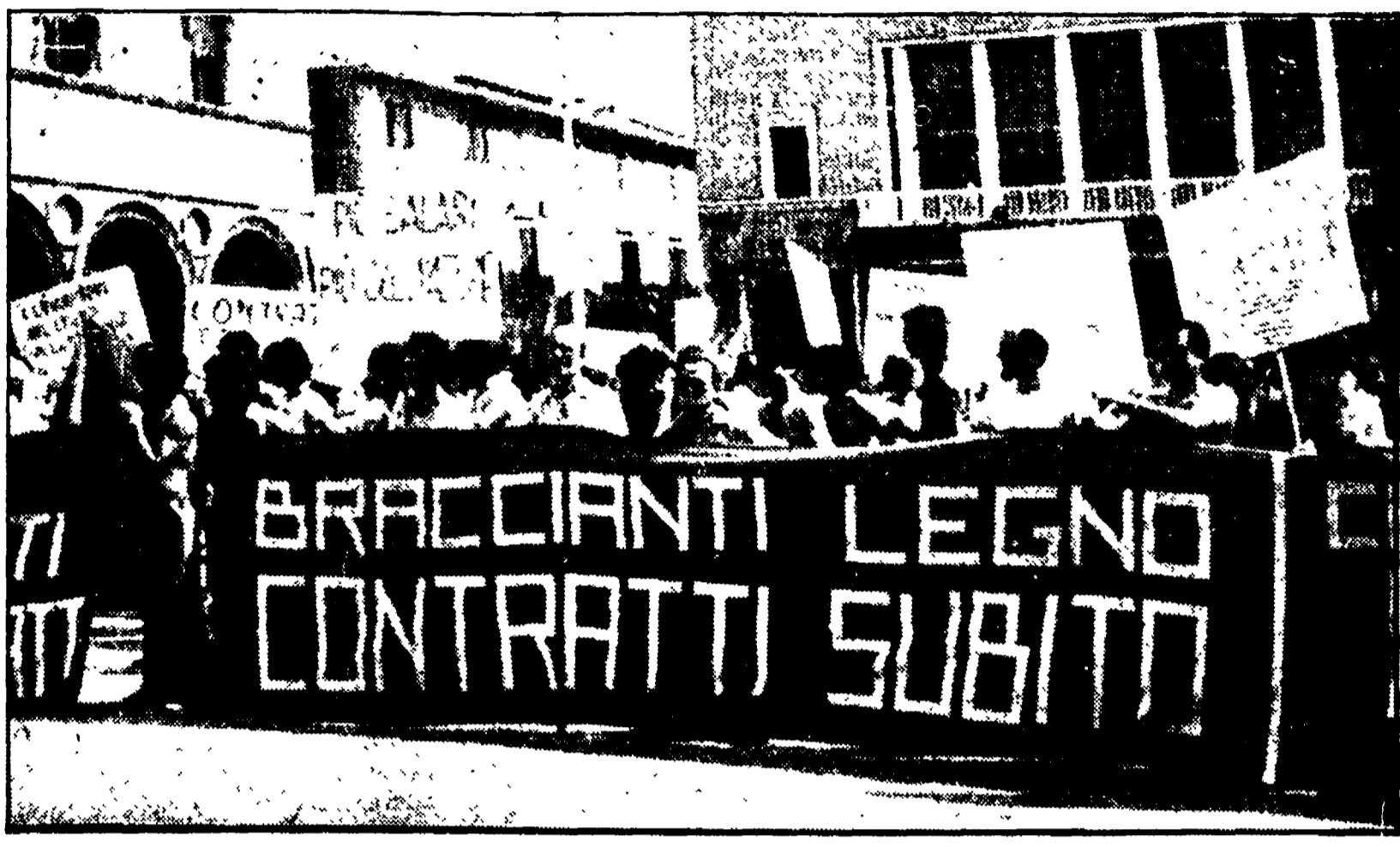
Un aspetto della manifestazione di braccianti e lavoratori del legno svoltasi ieri a Pesaro