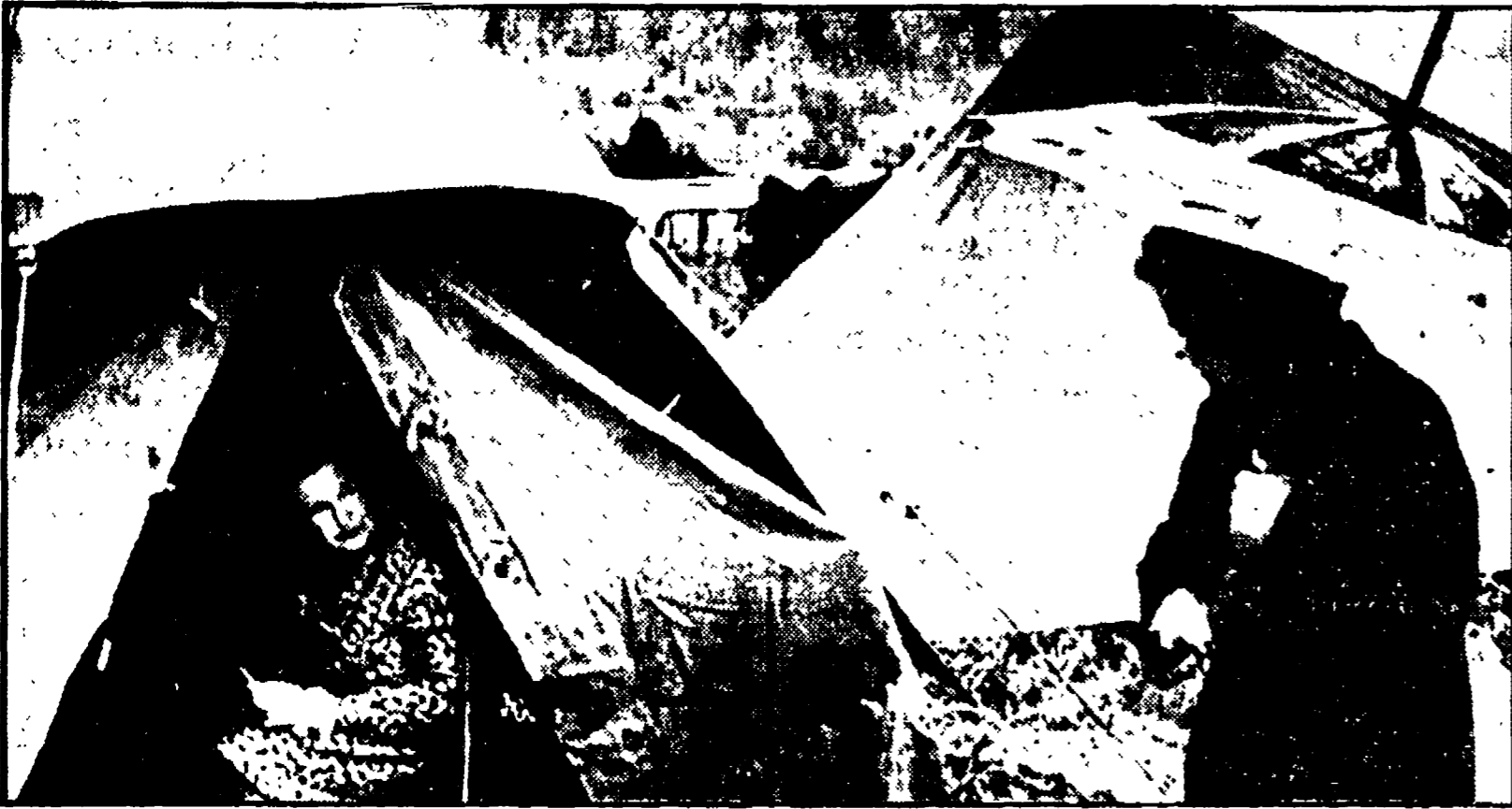
La pioggia e il freddo rendono più drammatica la condizione di vita nelle tendopoli

A Udine in un solo giorno 150 ricoveri - Nella maggior parte dei casi si tratta di infezioni alle vie respiratorie - Una volta dimessi ritrovano freddo e umidità - A colloquio con il compagno Colomba