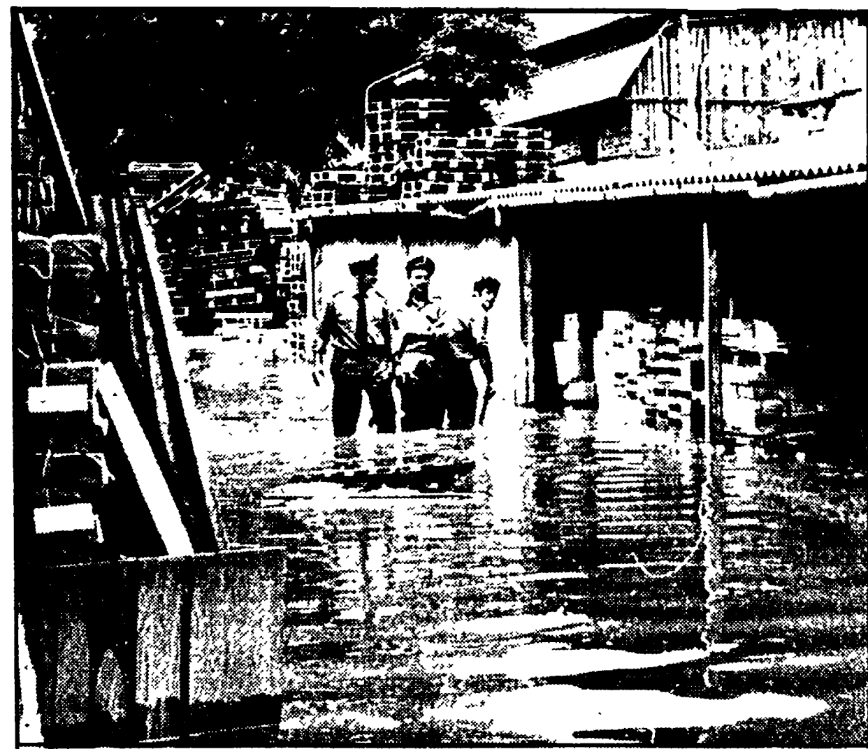
I vigili del fuoco al lavoro per prosciugare i magazzini dello scalo Tiburtino