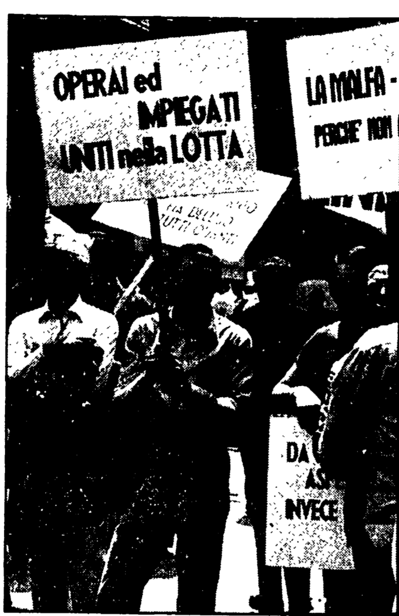
Contro l'atteggiamento evasivo della Bastogi