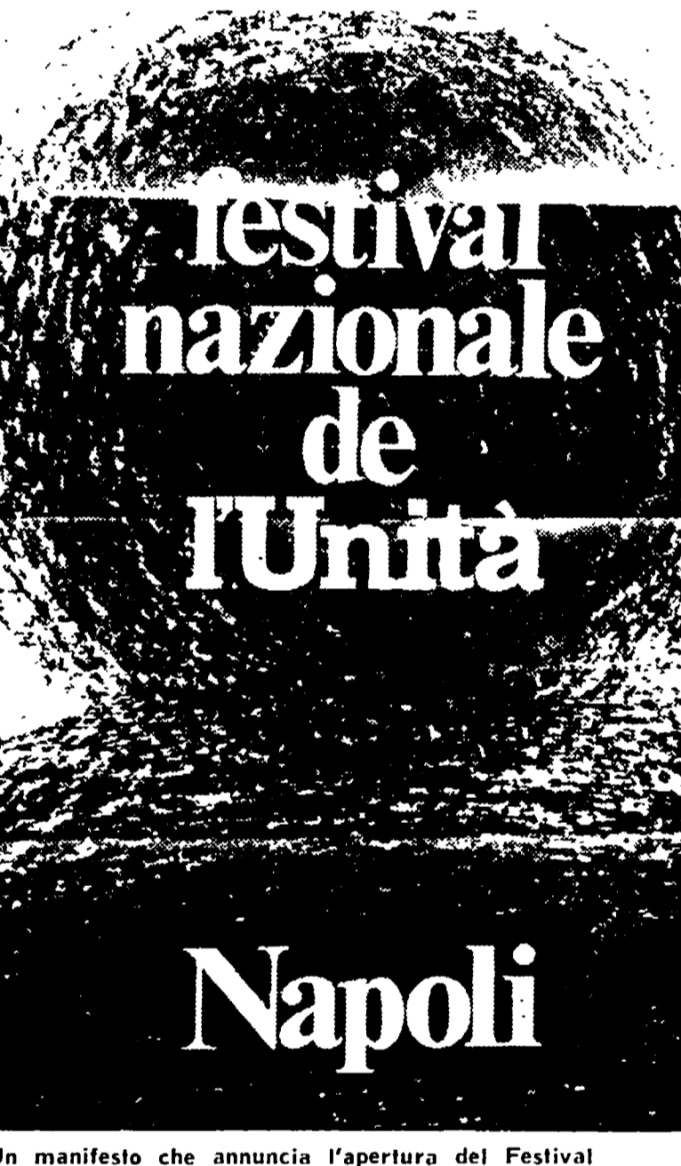
Un manifesto che annuncia l'apertura del Festival