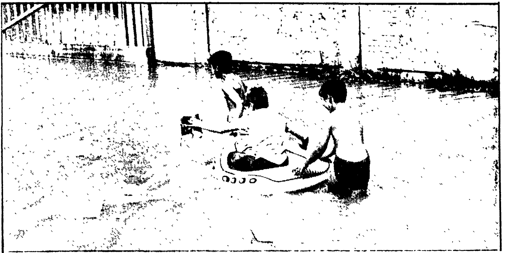
Bambini con un canotto di gomma guadagnano le vie trasformate in torrenti

Un improvviso torrente ha invaso lo scalo Tiburtino e le vie adiacenti - Danneggiate le auto in sosta e divelto il manto stradale - Temporaneamente interrotta l'energia elettrica - Le condutture forse riparate nella giornata di oggi