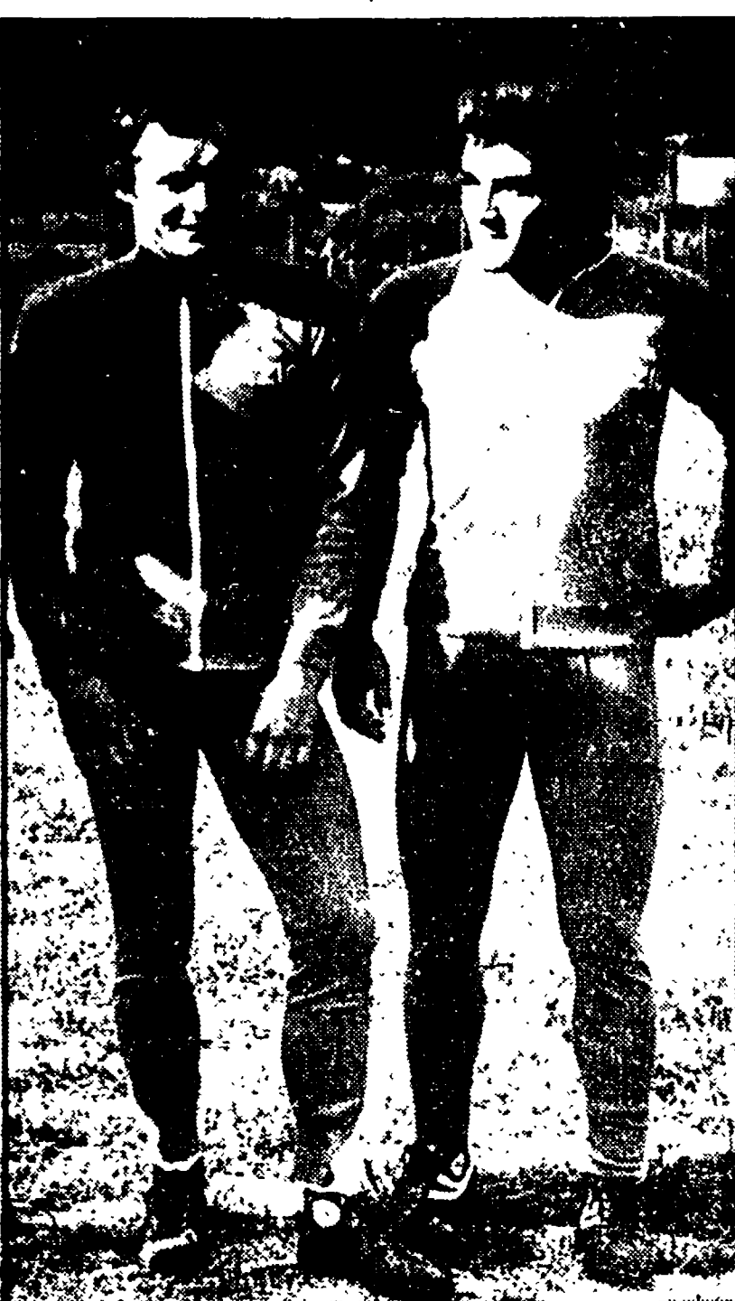
PIGHIN forse farà il suo esordio all'Olimpico, mentre per VIOLA si tratterà di una nuova prova per guadagnarsi il posto di titolare