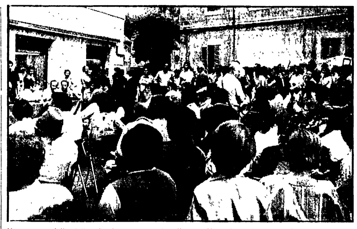
Un aspetto della folla che ha preso parte alla manifestazione di Ponte Milvio