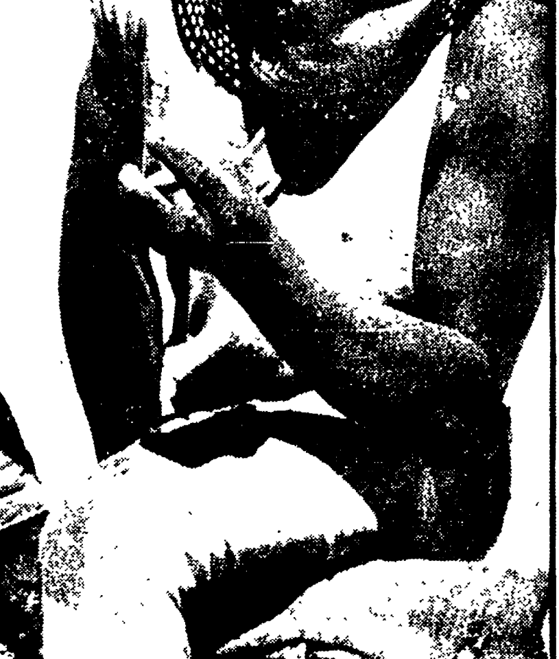
Due operai delle miniere di diamanti della Namibia