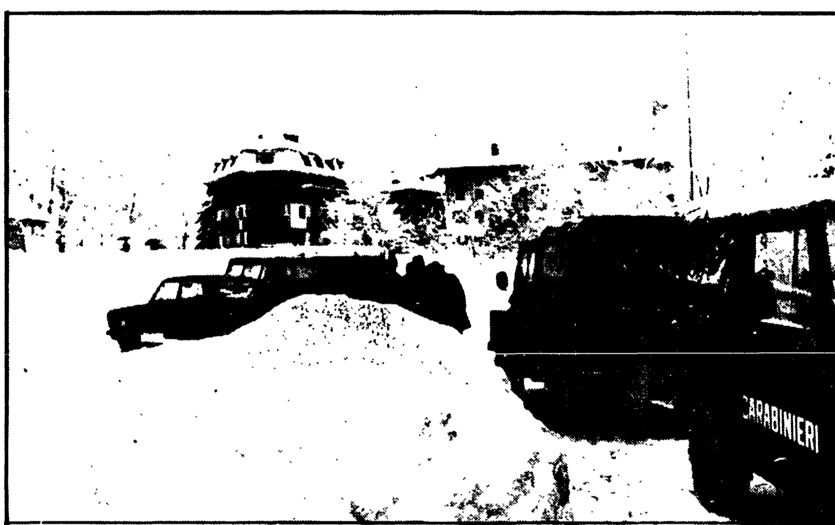
Colossale valanga di neve a Foppolo, un paesetto della Valle Brembana a 1500 metri di altezza: secondo le prime frammentarie notizie (la zona è ancora isolata), 8 morti sono otto, i feriti tre o quattro e i dispersi, forse due. La notizia della tragedia si è avuta con molte ore di ritardo ed è stata portata a valle da due coraggiosissimi sciatori dopo una marcia di tre ore. La valanga è venuta giù in piena notte ed ha travolto anche alcune casette di contadini. Fra le vittime un bambino e una bambina. NELLA FOTO: camionette dei carabinieri bloccate a Valleve, ultimo paese prima di Foppolo

Investite un gruppo di case - Fra le vittime anche due bimbi - La zona ancora isolata da metri di neve - Numerosi feriti e dispersi - Notizie confuse per le difficoltà provocate dal maltempo - L'allarme è stato dato da due coraggiosi sciatori