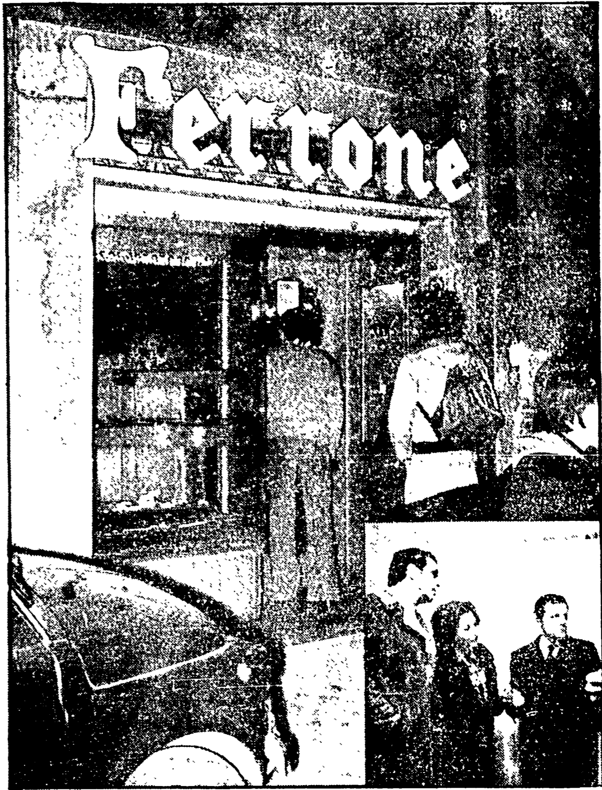
La gioielleria in vicolo del Moro e, nel riquadro, la moglie dell'orefice in ospedale

Sei scuole sono state allarmate per un falso allarme. I bambini sono stati evacuati e le scuole chiuse per alcune ore. Il falso allarme è stato causato da un errore di comunicazione.