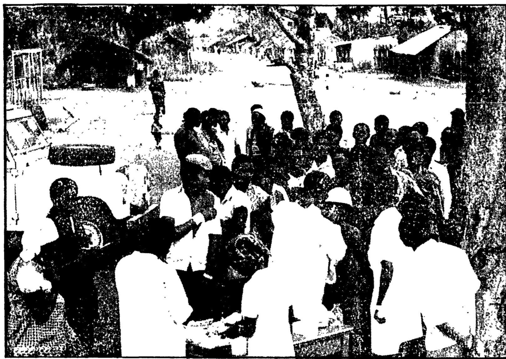
Vaccinazione in un villaggio della provincia di Cabo Delgado (Mozambico)

Come procede la trasformazione delle campagne, punto di forza della strategia di sviluppo del FRELIMO - Molti contadini scelgono il lavoro collettivo, ma una gran parte resiste all'idea di abbandonare il vecchio modo di vivere - In due anni di indipendenza è stato creato un embrione di servizio sanitario - Visita ad alcune cooperative lungo il fiume Limpopo