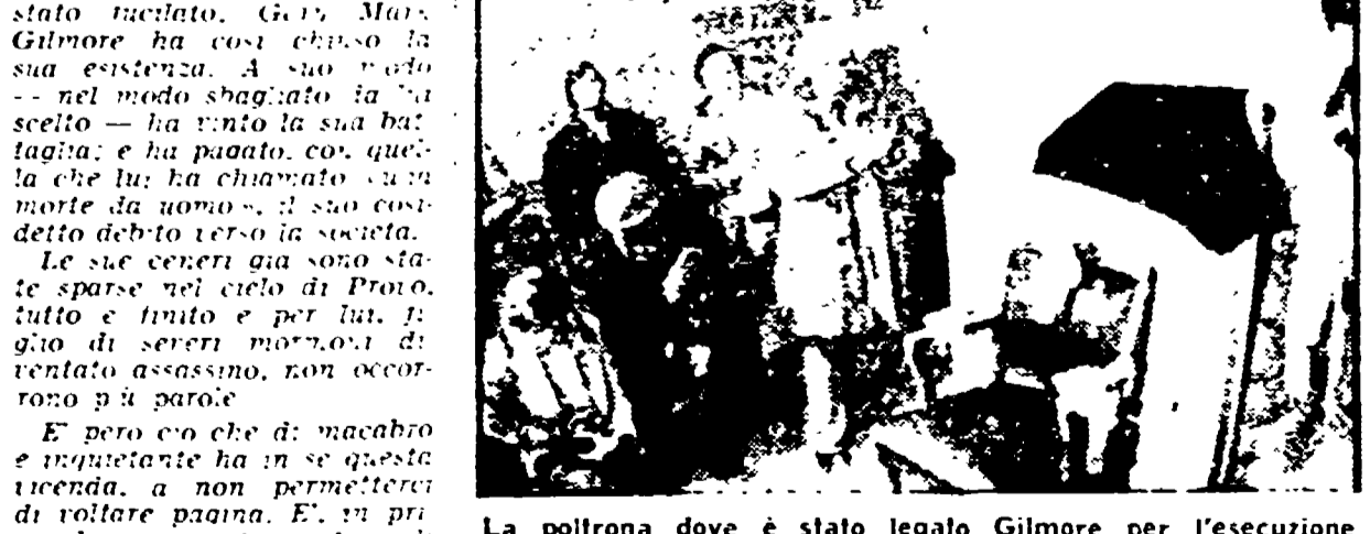
La poltrona dove è stato legato Gilmore per l'esecuzione