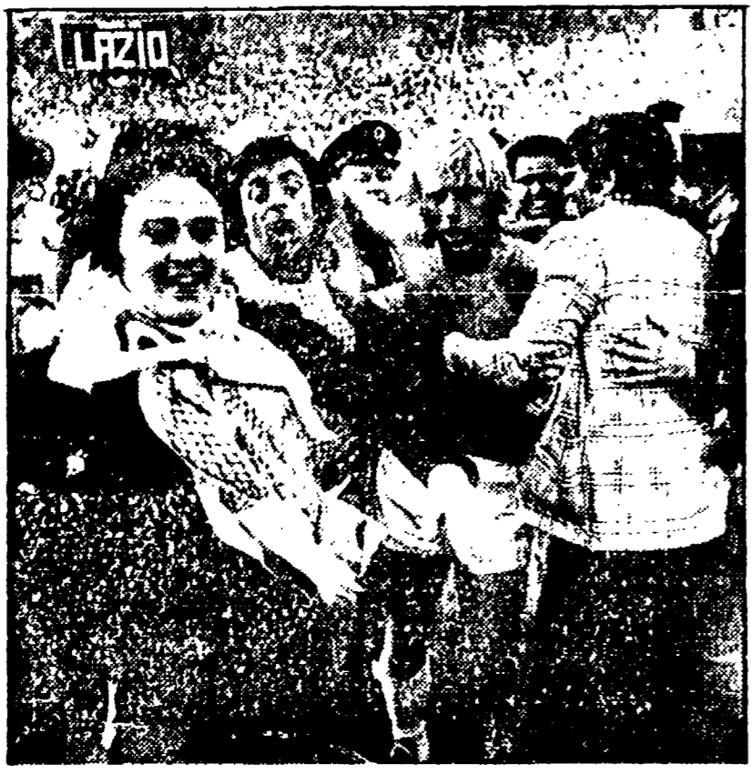
Una foto cara a Re Ceconi: i tifosi festeggiano il giocatore, al quale hanno tolto la maglia, il giorno in cui il Lazio vinse lo scudetto