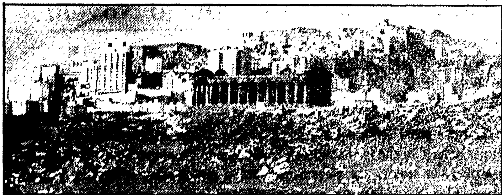
Le conclusioni del convegno di esperti promosso dal PCI nel capoluogo siciliano