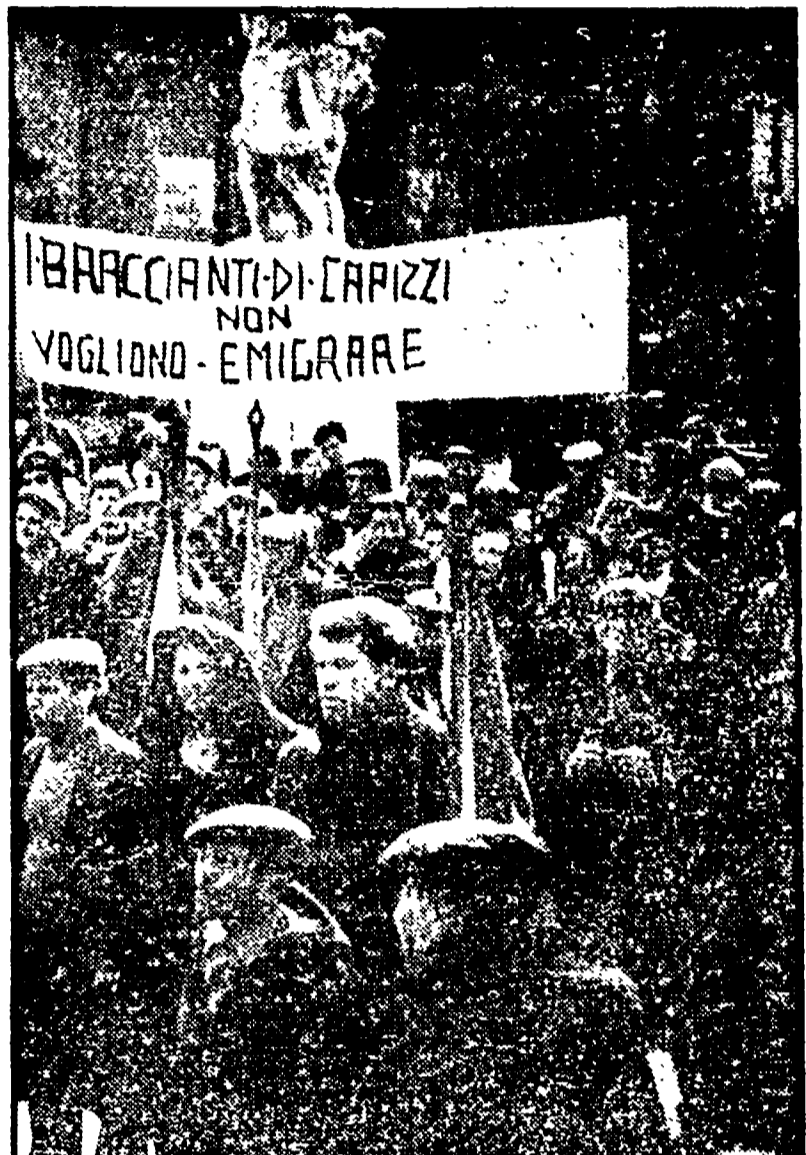
Una manifestazione di braccianti siciliani