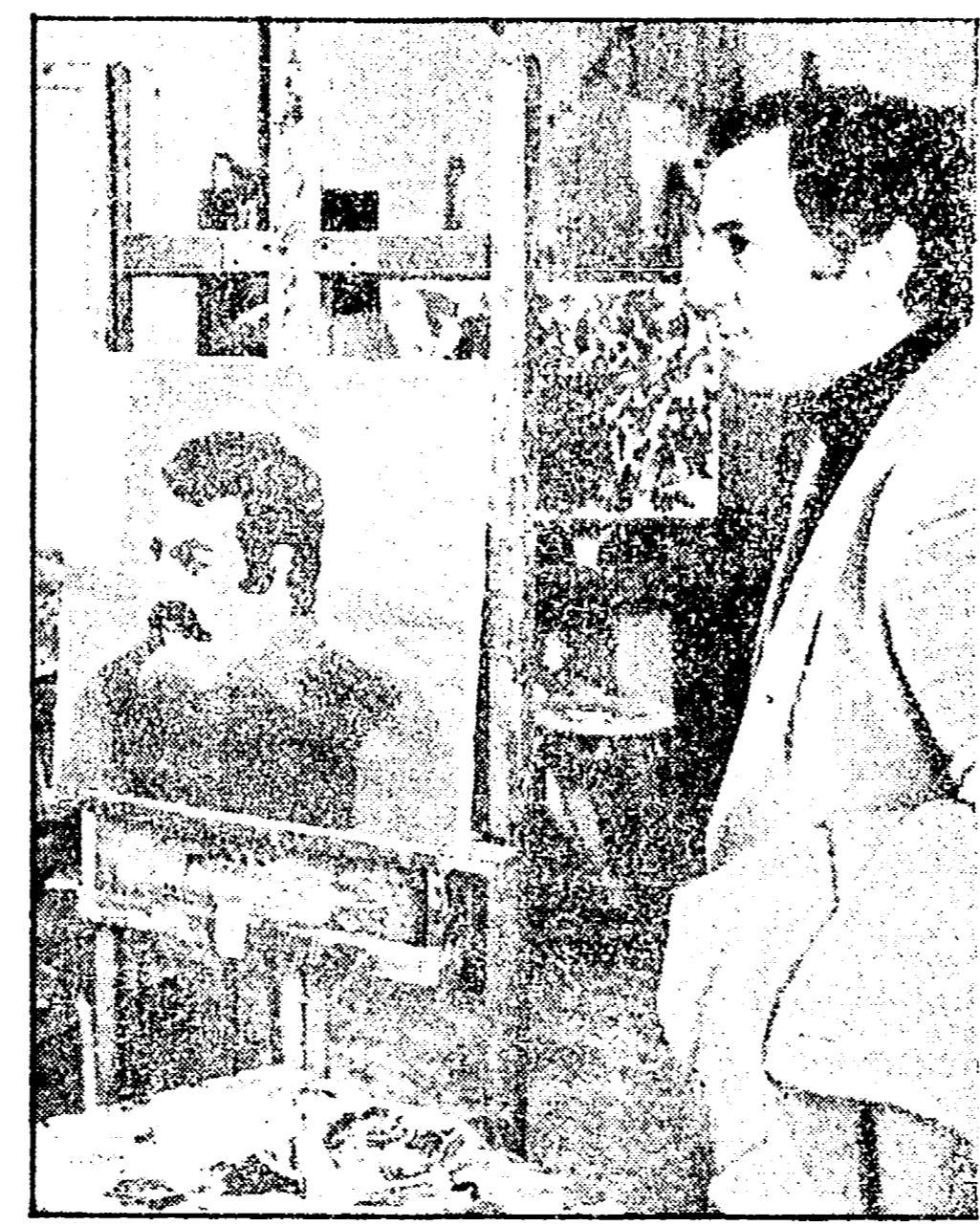
Il quadro indicato da una insegnante dell'Accademia di Belle Arti è stato dipinto da Ida Pischedda; raffigurerebbe il giovane italo-americano con cui la ragazza è stata fidanzata a lungo

La studentessa uccisa e carbonizzata alla Bufalotta fino all'agosto scorso era fidanzata con un italo-americano reduce dal Vietnam - Un'agendina zeppa di nomi - Restano in piedi tutte le ipotesi - Ricerche anche nel giro della ricettazione di quadri e in quello del traffico di droga