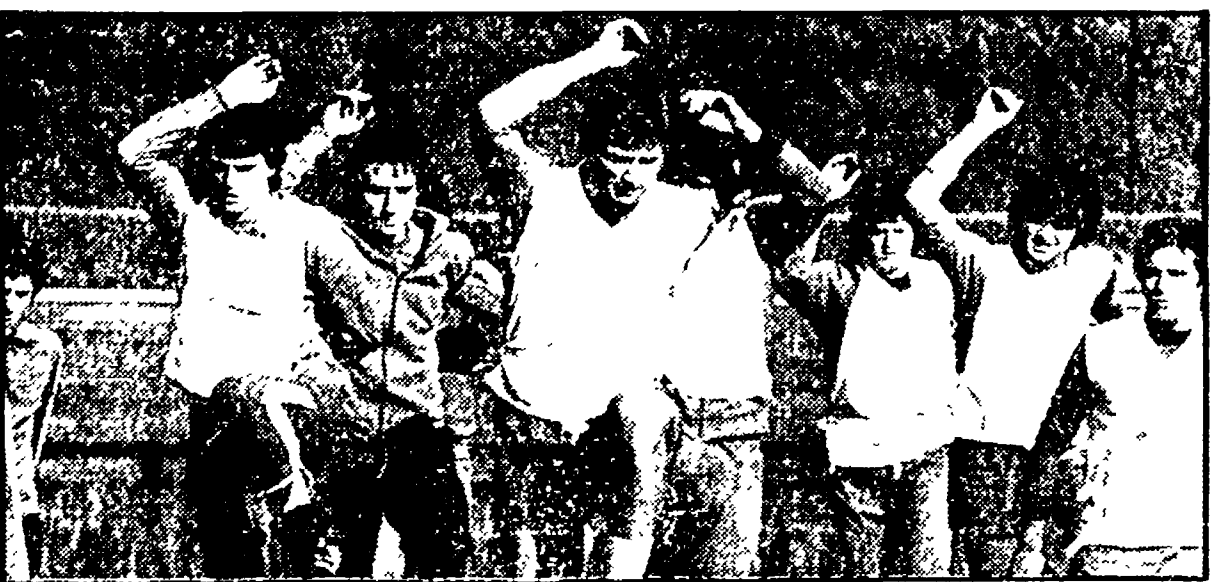
Squadra di rifinitura degli azzurri ieri sul campo del Banco di Roma a Sottebagni. Si riconoscono, da sinistra, Tardelli, Graziani, Facchetti, Zaccarelli, Antognoni, Pecci e Cuccureddu.

In programma solo la staffetta Zoff-Castellini nella ripresa. Ieri è giunta a Roma la nazionale belga — L'allenatore Thys: «Temo soprattutto la forza d'urto degli attaccanti italiani»