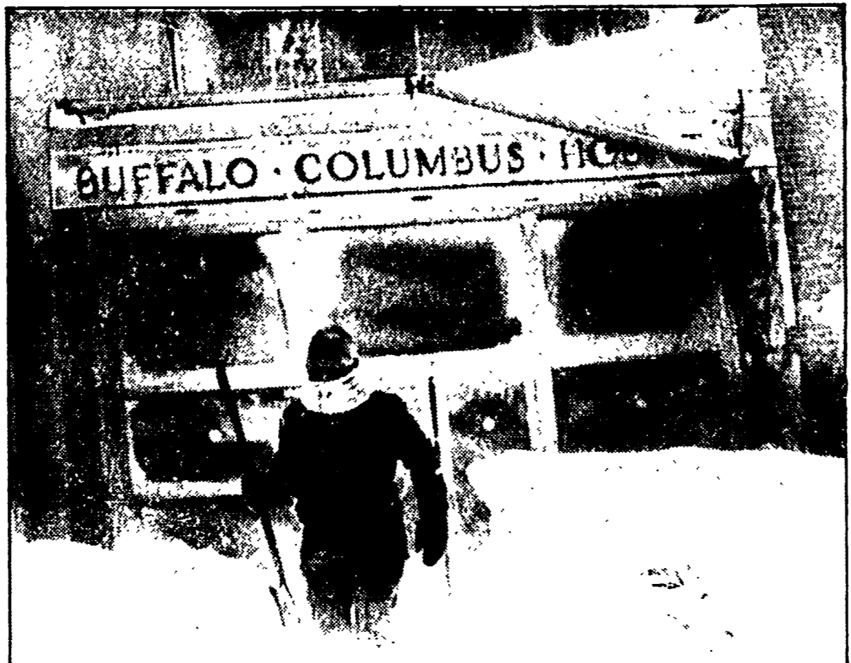
Emergenza in USA per il freddo. Non accenna a diminuire l'ondata di freddo polare che ha investito numerosi stati...