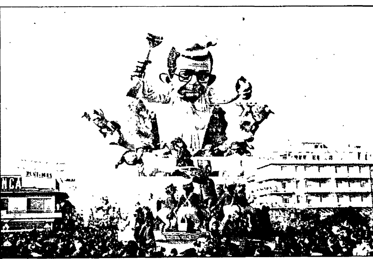
Andreotti visto da uno dei carristi di Viareggio

Dal nostro inviato VIAREGGIO, 19. Si scruta il cielo, sperando nel sole, grande alleato del Carnevale. Ma attesa i carristi rientrano in complesso meccanismo che muove le gigantesche figure di carta pesta che sfiorano i soffitti degli hangar di Marco Polo. Domani, pomeriggio, per la terza volta, i carri, piccoli e grandi, torneranno a sfilare lentamente sul lungomare. I primi due corsi sono stati: se zuti da più di 200 mila persone, per il corteo, e per le maschere di gruppo. Ancora una volta la maggioranza dei carristi si sono ispirati alla vita politica italiana. Il personaggio più bersagliato dagli satira, della sfilata viareggina è stato Andreotti, ma non sono stati risparmiati gli altri leaders italiani. Un carro è stato in teramento del capo al presidente Carter e alle sue nozioni. Il tema politico, sempre caro ai carristi viareggini, quest'anno però non è stato sfiorato con la freschezza e l'originalità del passato. Altra qua e là una certa stanchezza ideativa e creativa, che spesso riduce la satira a caricature. Molto belle comunque i carri di Arnaldo Gabi, di Sergio Baron, due maestri indiscussi del «carrista» viareggino. Il primo ha inteso il suo carro «Rami secchi», e ha fatto una preziosa denuncia del parassitismo, della mafia, della corruzione, della delinquenza. Il secondo, con «Povera misera» ha reso omaggio al re Carnevale, rappresentato da una figura