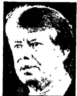
CARTER — Ancora una mediazione