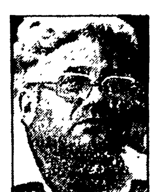
DIDO' - Modifiche alle misure del governo