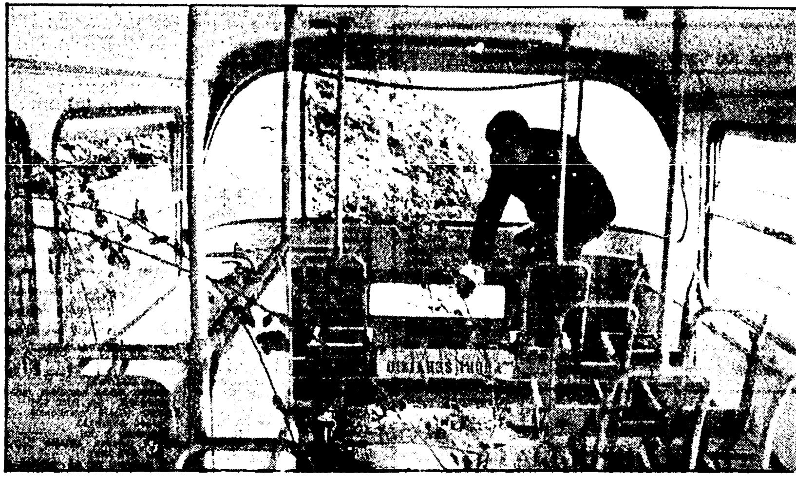
Un albero s'è impiantato, è cresciuto, ed è fiorito in questi giorni, dentro un autobus a due piani, una volta utilizzato sulla linea del «140», che si trova con altre centinaia di mezzi abbandonati nel deposito di via delle Puglie

Come si fa a spendere un miliardo l'anno solo per acquistare un'automobile, a casa e al lavoro o agli studi? L'ATAN ci riesce con estrema facilità. La cifra, determinata dall'assemblea del personale nel deposito di piazza Carlo III è forse addirittura inferiore alla realtà. La compagnia infatti, gli stipendi per i 45 autisti di direzione, ciascuno dei quali gode anche di 90 ore mensili di straordinario forzatamente, sono anche se non tanto meno, e questo accade sicuramente, gli viene pagato lo stesso. Ogni autista di direzione riceve una cifra non inferiore ai 18 milioni l'anno all'azienda. Aggiungendo il costo della benzina e del petrolio marino, il miliardo viene facilmente raggiunto e superato.