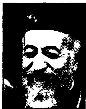
MAKARIOS — Un inizio di dialogo?