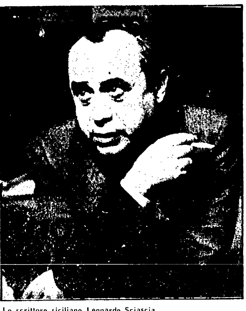
Lo scrittore siciliano Leonardo Sciascia

«La giunta esecutiva della FNSI ha esaminato i risultati degli incontri avvenuti con i rappresentanti dei partiti...»