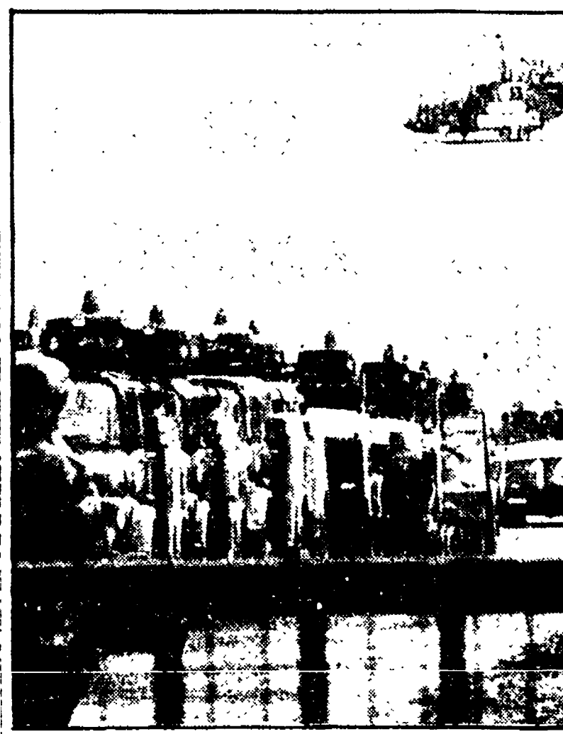
NON C'E' STATA LA BATTAGLIA

Gordano verso le fabbriche israeliane. Inverte questa tendenza e stata la nostra priorità, e il modo migliore per affrontare il problema è stato di organizzare i comitati di base delle cooperative e dimostrare pubblicamente che si poteva resistere e organizzare la propria vita autonoma.