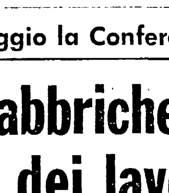
TRUFFI - Le proposte degli edili

Ma uno dei nodi centrali della crisi è dato dall'agricoltura. E proprio per questo mercoledì scorso migliaia di mezzadri, coloni, coltivatori hanno manifestato a Roma. Occorre compiere ogni sforzo — hanno detto — per far dell'impresa coltivatrice associata, un protagonista del rinnovamento delle campagne. La grande assemblea era stata indetta da Alleanza, Federazione, UCI, tre organizzazioni impegnate a varare una «costituente contadina», un fatto nuovo di unificazione di forze nella storia delle nostre campagne. Un fatto nuovo non può lasciare indifferente il movimento sindacale nel suo complesso.