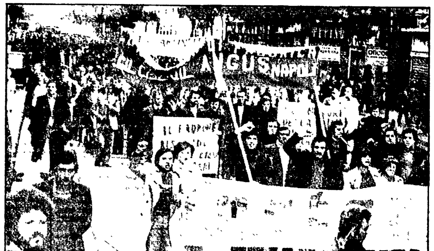
Nella foto a sinistra un'immagine di piazza Matteotti, gremita di lavoratori, studenti e disoccupati; in quella a destra un aspetto del corteo che ha attraversato le vie cittadine