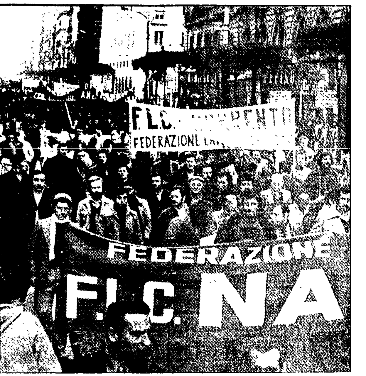
NAPOLI - Una veduta parziale del corteo durante lo sciopero di ieri

Tutti e quattro gli arresti, per questo episodio sono ben noti fascisti, gli altri cinque fermati e denunciati a Napoli, ma anch'essi sono conosciuti come neofascisti, un altro arresto è stato effettuato nell'area della autonomia. Per i gravi disordini e le devastazioni sono inoltre ricercati altri personaggi, la cui carta d'identità politica sarà sottoposta a accertamenti. E' opportuno che si determini il quadro di riferimento della lotta, che si stenda a tutta la città di Napoli, tenendo di paralizzare dall'alto con imprese teppistiche la vita stessa della città. Ma i proscritti, ancora una volta, sono venuti troppo allo scoperto, squadristi di « autonomia operaia » e squadristi del neofascismo si sono ritrovati anche fucilmente uniti contro la città ed i lavoratori.