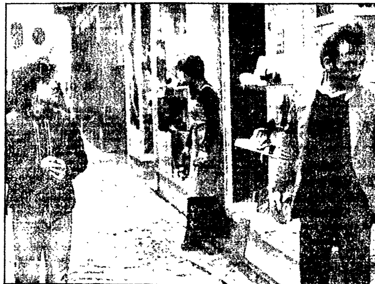
Una delle vetrine di via Chiaia danneggiate dal gruppo di «autonomi» e neofascisti