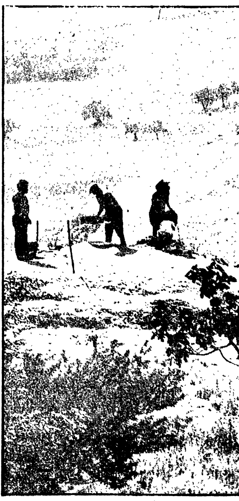
Uno scorcio di una campagna del Ragusano