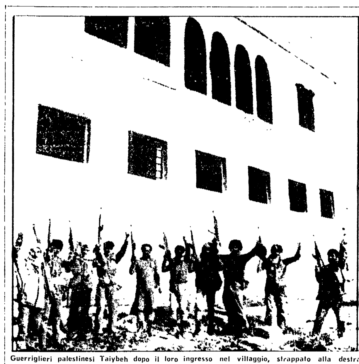
Guerriglieri palestinesi Taybeh dopo il loro ingresso nel villaggio, strappato alla destra