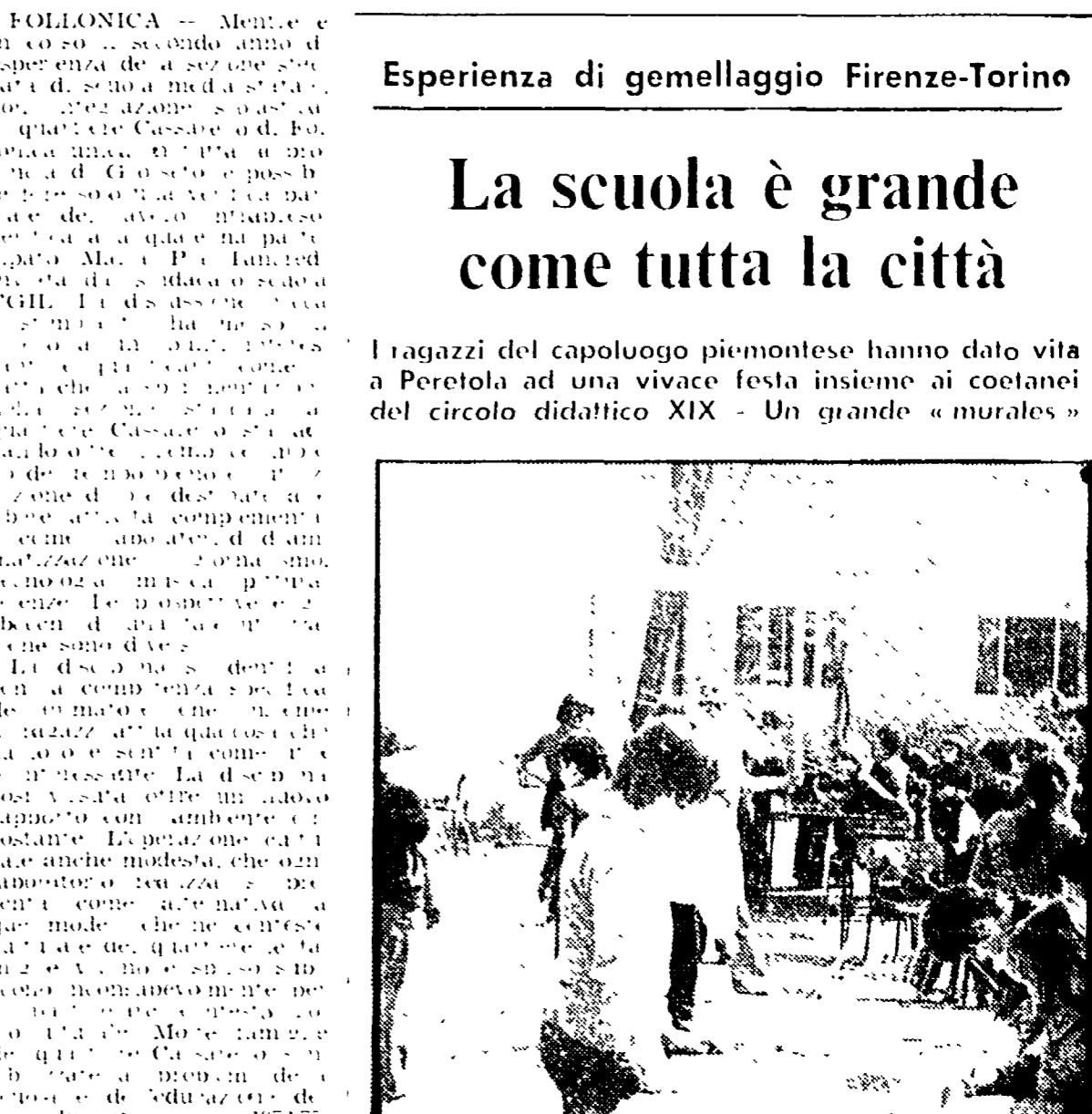
I ragazzi del capoluogo piemontese hanno dato vita a Peretola ad una vivace festa insieme ai coetanei del circolo didattico XIX - Un grande « murales »

Quando a scuola entra il quartiere - Un crescendo di partecipazione attorno a proposte nuove - I problemi di una identità culturale che interessa le varie forze presenti nel mondo scolastico