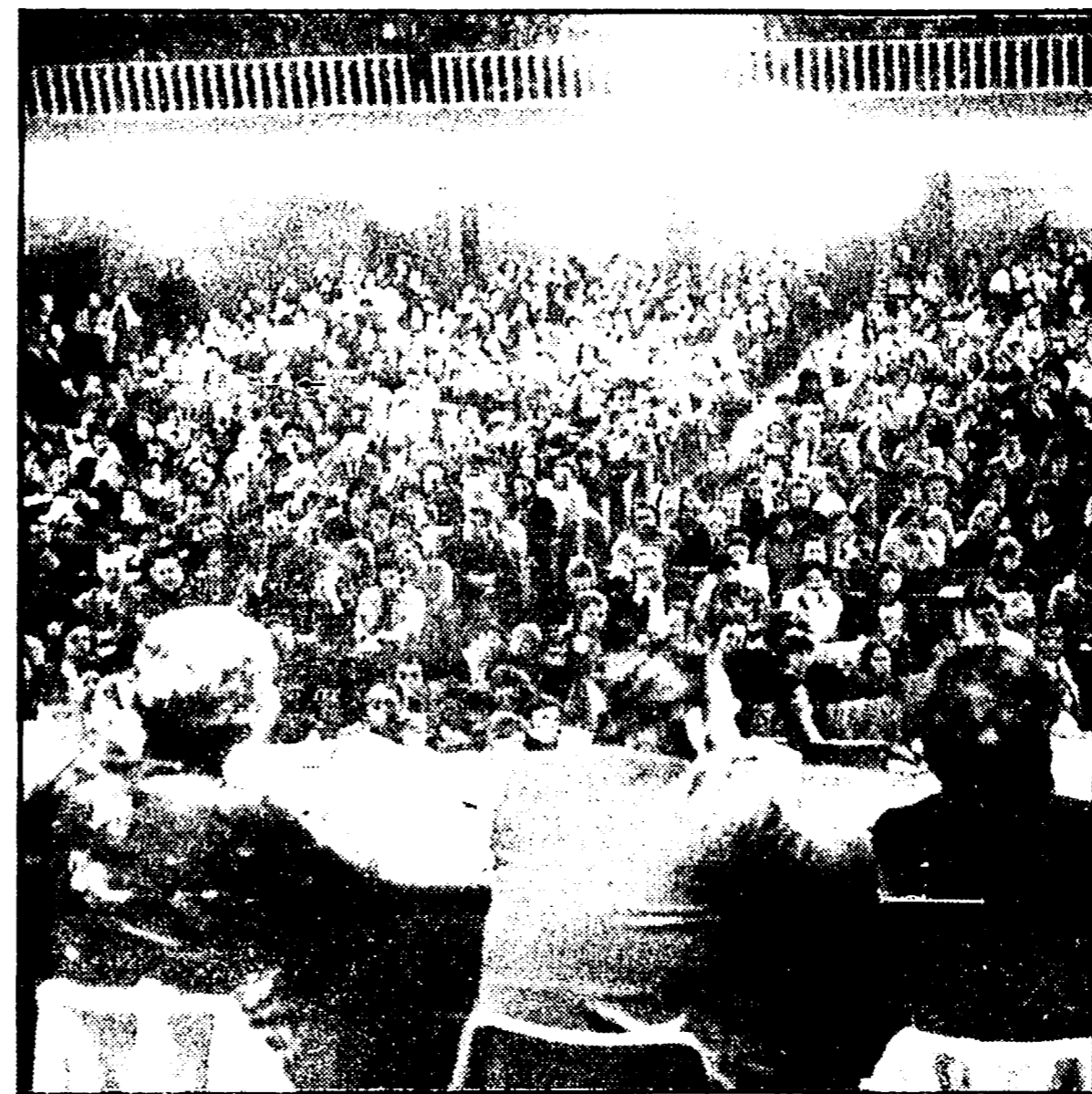
Un aspetto della sala dell'Apio gremita durante il congresso

una parte ampia del documento è dedicata ad un esame attento dei problemi legati all'esigenza di tutelare l'ordine democratico e la convivenza civile. La ripresa o la forme nuove della strategia della tensione — si legge nella mozione — richiede una più forte iniziativa unitaria e di massa, che sostenga l'azio-