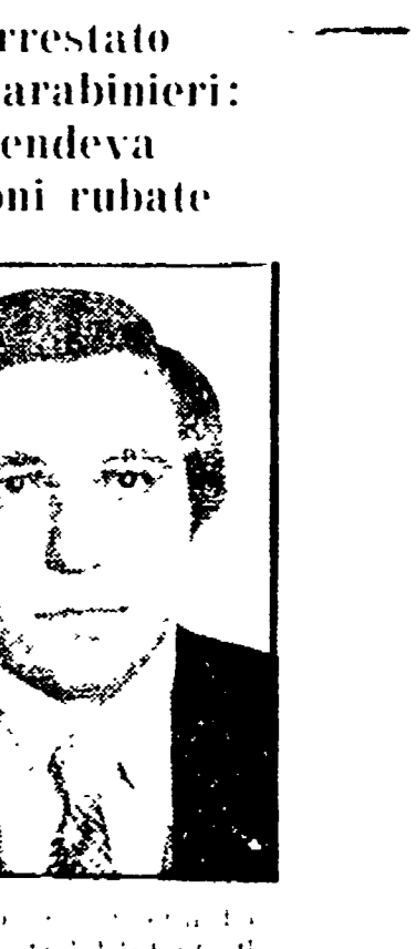
Arrestato dai carabinieri: vendeva azioni rubate