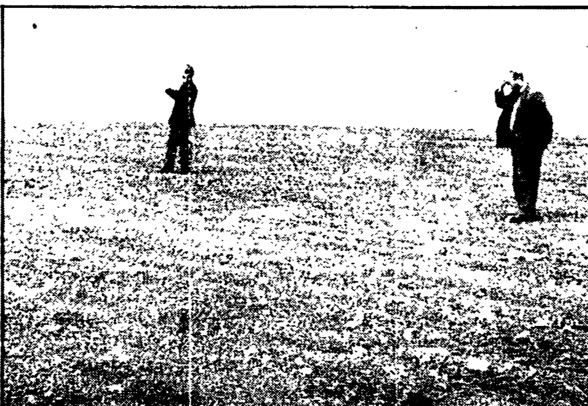
Una immagine desolante di terreni abbandonati. Nel Leccese i contadini da tempo si stanno organizzando per rendersi produttivi...

Proteste del PCI per l'ennesimo provvedimento contro «il movimento sindacale e cooperativo» da parte del Tribunale amministrativo - I sindacati denunciano un disegno preciso che ostacola i lavoratori più deboli