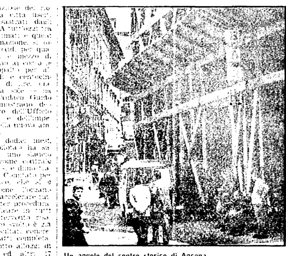
Un angolo del centro storico di Ancona

ANCONA - A cinque anni di distanza dalla terribile catastrofe del terremoto, ad un anno esatto dall'insediamento della nuova giunta comunale (PCI-PSI-PRC), l'amministrazione anconetana ha voluto tracciare un bilancio - o perlomeno un bilancio - sull'opera di recupero del centro storico.