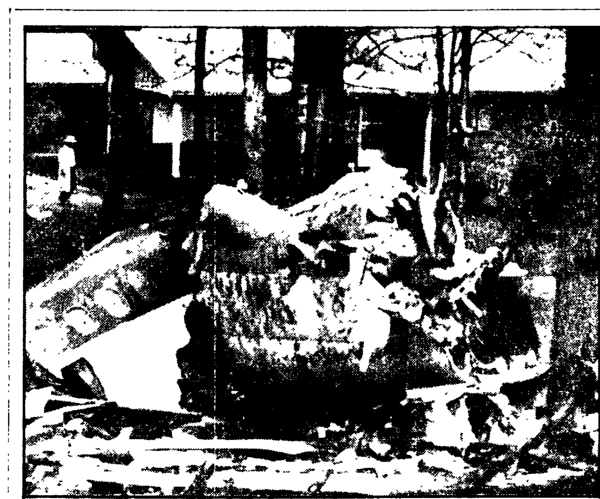
ATERRAGGIO SULL'AUTOSTRADA: 59 MORTI. Cinquantanove vittime; questo il bilancio della sciagura aerea verificatasi ieri a New Hope in Georgia (USA), quando un DC 9 di linea, un allargaggio di fortuna, ha investito un camion di alimentari e alcune macchine parcheggiate, prima di esplodere. L'atterraggio di fortuna su una strada a due corsie era stato tentato, dopo che sull'aereo, che appartiene alla « Southern », si erano incendiati entrambi i reattori. A bordo si trovavano 85 persone. Nella foto: i rottami dell'aereo dopo lo schianto

Appello per la libertà di José Luis Massera