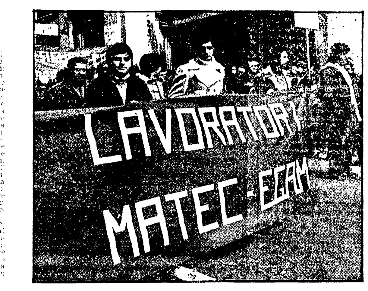
Fissati i prezzi di vendita al pubblico della carne presto in commercio