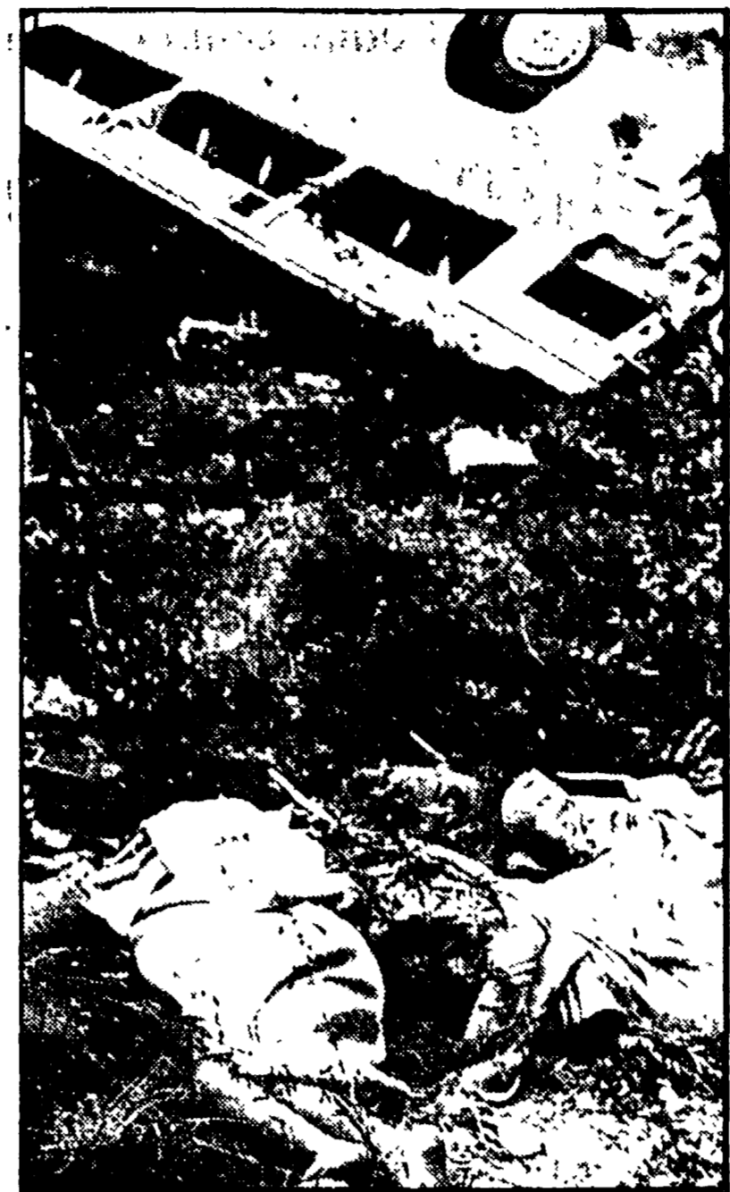
BUS NEL BURRONE: 24 MORTI

Pauroso bilancio di un incidente stradale avvenuto nei pressi di Huesca, in Spagna: 24 morti e 34 feriti. Le vittime erano anziani ospiti di una casa di riposo che stavano compiendo una gita. L'autobus su cui viaggiavano è precipitato, per cause non ancora precisate, in un burrone. Nella foto: alcune delle vittime vicino ai resti del torpedone.