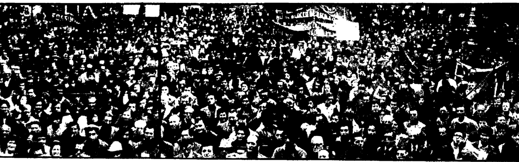
La manifestazione dell'ottobre '76 con Lama a Pesaro. Oggi nel Pesarese scenderanno ancora in lotta i lavoratori metalmeccanici, dell'abbigliamento, del legno e dell'edilizia

Aderiscono alla giornata di lotta i metalmeccanici e l'abbigliamento — Nel Pesarese anche i settori del legno e gli edili — Cortei a Pesaro e Recanati — Rinviato l'incontro per la Maraldi