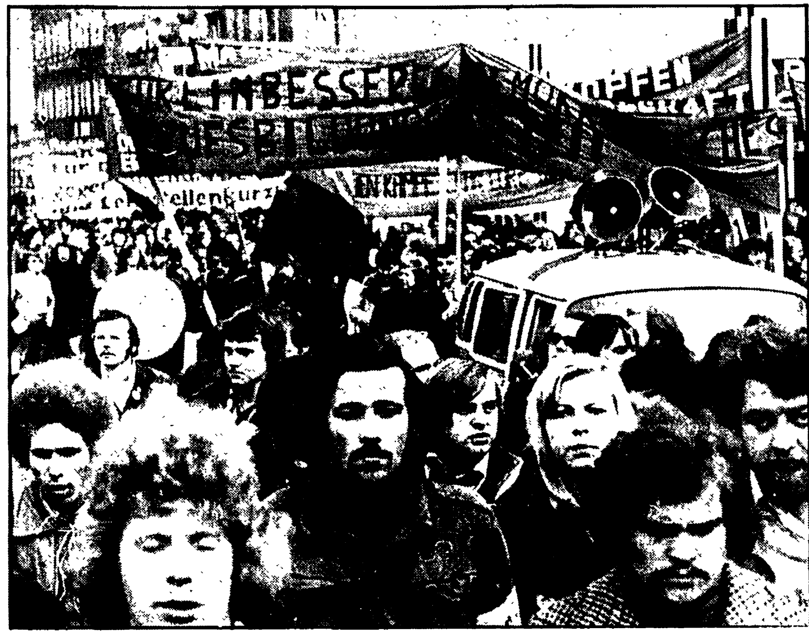
Giovani lavoratori e impiegati in una manifestazione per l'occupazione a Dortmund

Recente fase di un processo Il compromesso storico è la più recente fase di un processo, che dura ormai da quaranta anni almeno, di crescita della classe operaia, e dei suoi partiti, di ragionare, di agire, di lottare come classe dirigente nazionale.