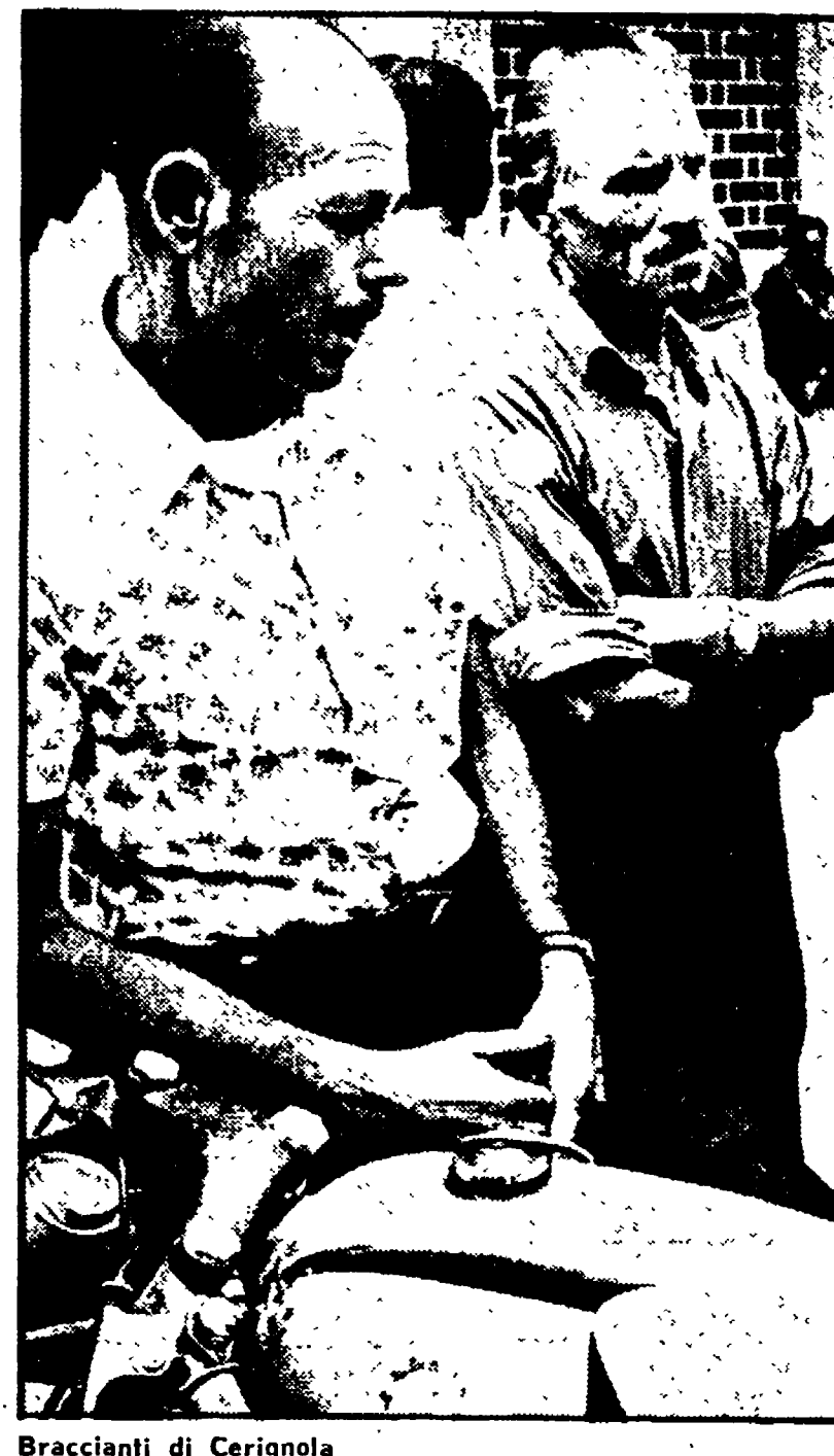
Braccianti di Cerignola

ROMA - L'operazione «prezzi trasparenti» lanciata dall'Associazione nazionale cooperative di consumo (ANCC) aderente alla Lega in 25 punti vendita dell'Emilia-Veneto e in altri cinquanta della Toscana, con i carichi medi sui costi-venditori oscillanti dal 5 al 7 per cento, sembra destinata a fare molta strada e ad inaugurare un nuovo modo di vendere, condizionando anche certi settori produttivi.