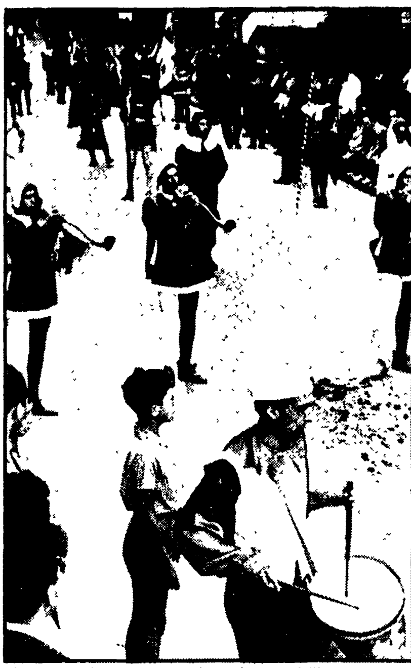
Una suggestiva immagine della Giostra dell'Orso