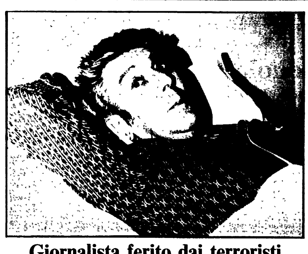
Giornalista ferito dai terroristi