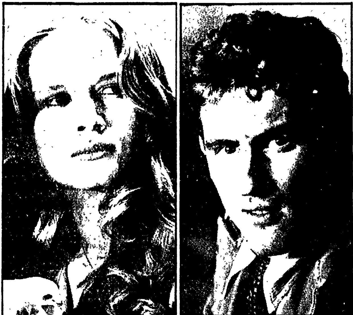
MONACO DI BAVIERA - Il prolifico regista Rainer W. Fassbinder si prepara a partire alla volta degli Stati Uniti, per girarvi «Il lato oscuro dell'amore».