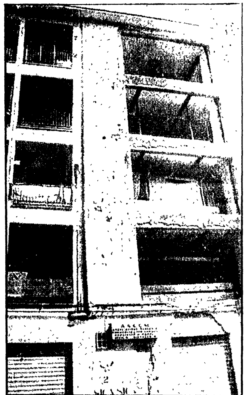
Lo stabile dove dovrebbero essere eseguiti i lavori

Continua la catena di licenziamenti nei pastifici di Gragnano. Dopo gli otto effettuati nei giorni scorsi da «Liguori», adesso è la volta dei 45 dipendenti del pastificio «Emilio Di Nola».