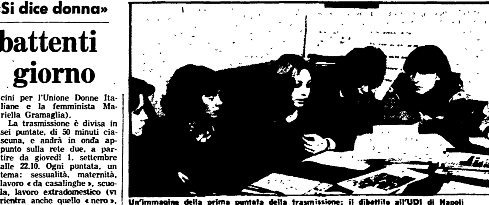
Un'immagine della prima puntata della trasmissione: il dibattito all'UDI di Napoli