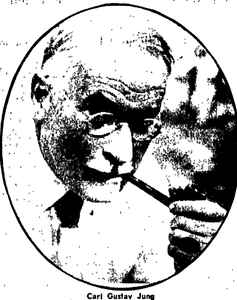
Carl Gustav Jung

Riflessioni e note critiche in margine a un convegno internazionale sull'opera dello scienziato di Zurigo confrontata con le nuove esperienze della psichiatria