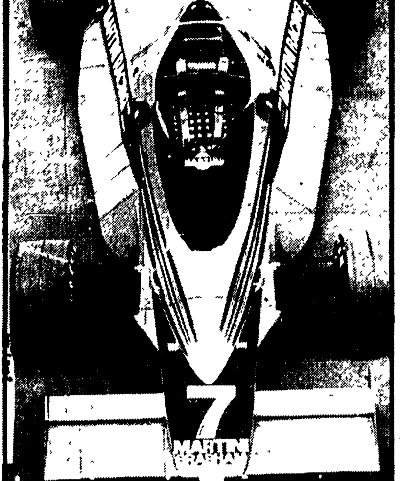
Ecco la Brabham-Alfa, la nuova macchina di LAUDA