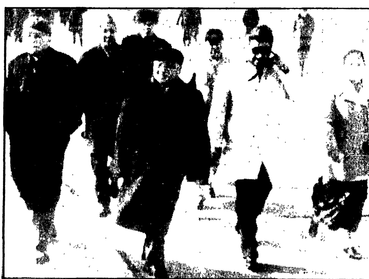
PECHINO - Il vice-primo ministro cinese Teng Hsiao-ping fotografato all'aeroporto della capitale al momento della sua partenza per la Birmania