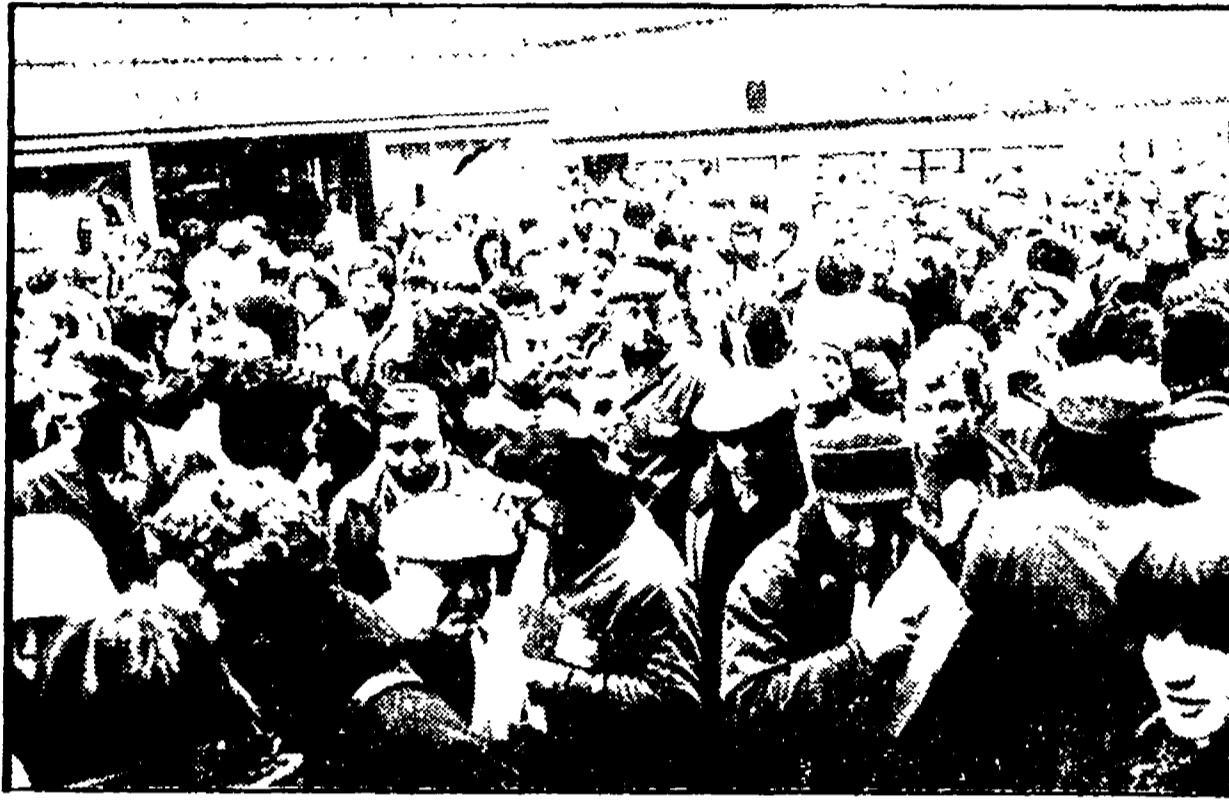
Due immagini della manifestazione antifascista di ieri ad Ancona. In alto: la festa di uno dei cortei che hanno attraversato la città. In basso: lavoratori rimasti fuori dello sbracolo Metropolitan