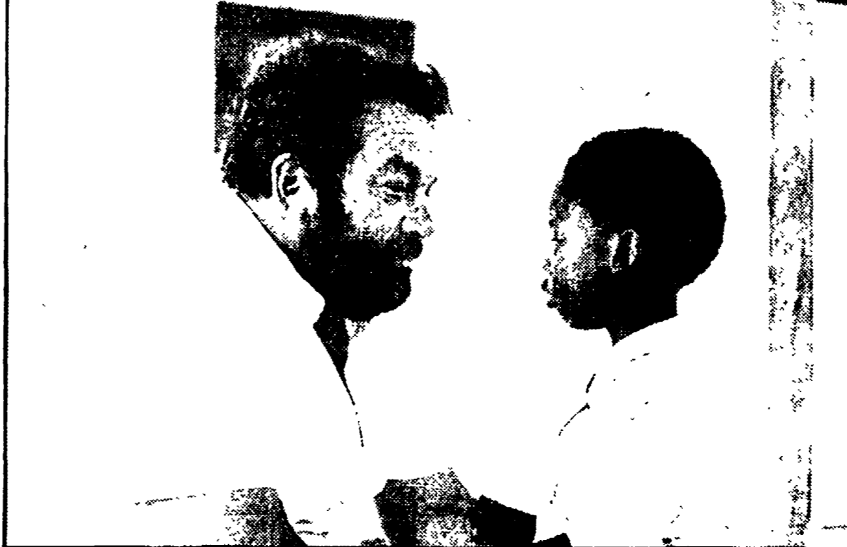
Bud Spencer e Zulü Bodo in «Piedone va in Africa»