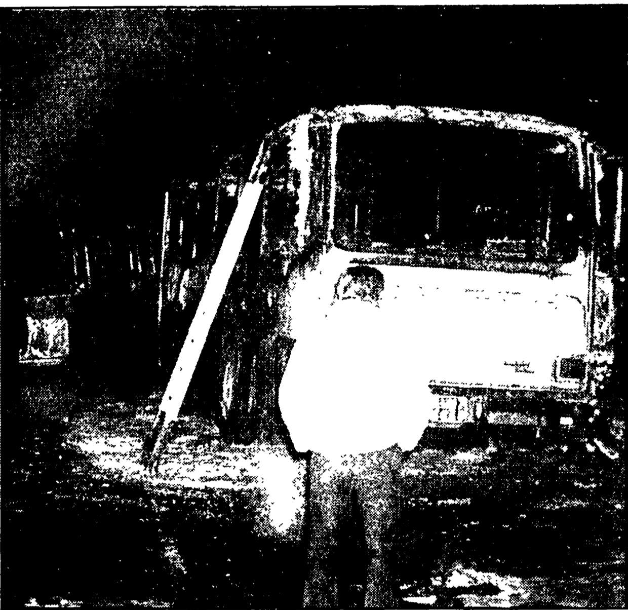
Uno degli autobus incendiati nel deposito dell'Acqua Acetosa

Otto pullman completamente distrutti - I Vigili del fuoco hanno lavorato molte ore prima di poter circoscrivere le fiamme - Gli autori del criminale gesto non sono stati visti da alcun testimone