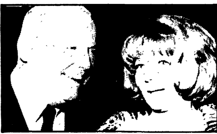
Il regista Hathaway con Rila Hayworth