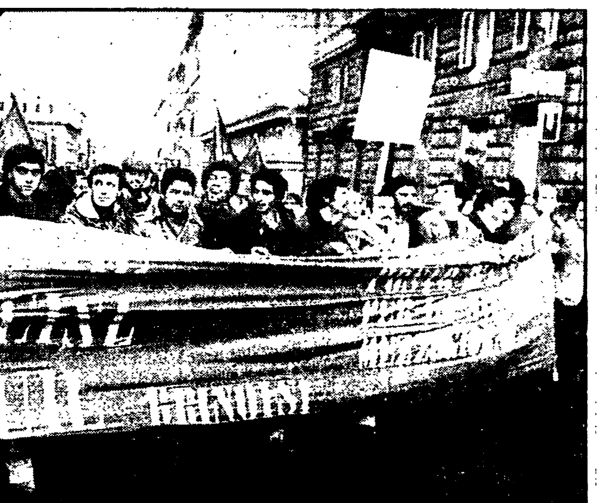
Una manifestazione dei lavoratori di Brindisi