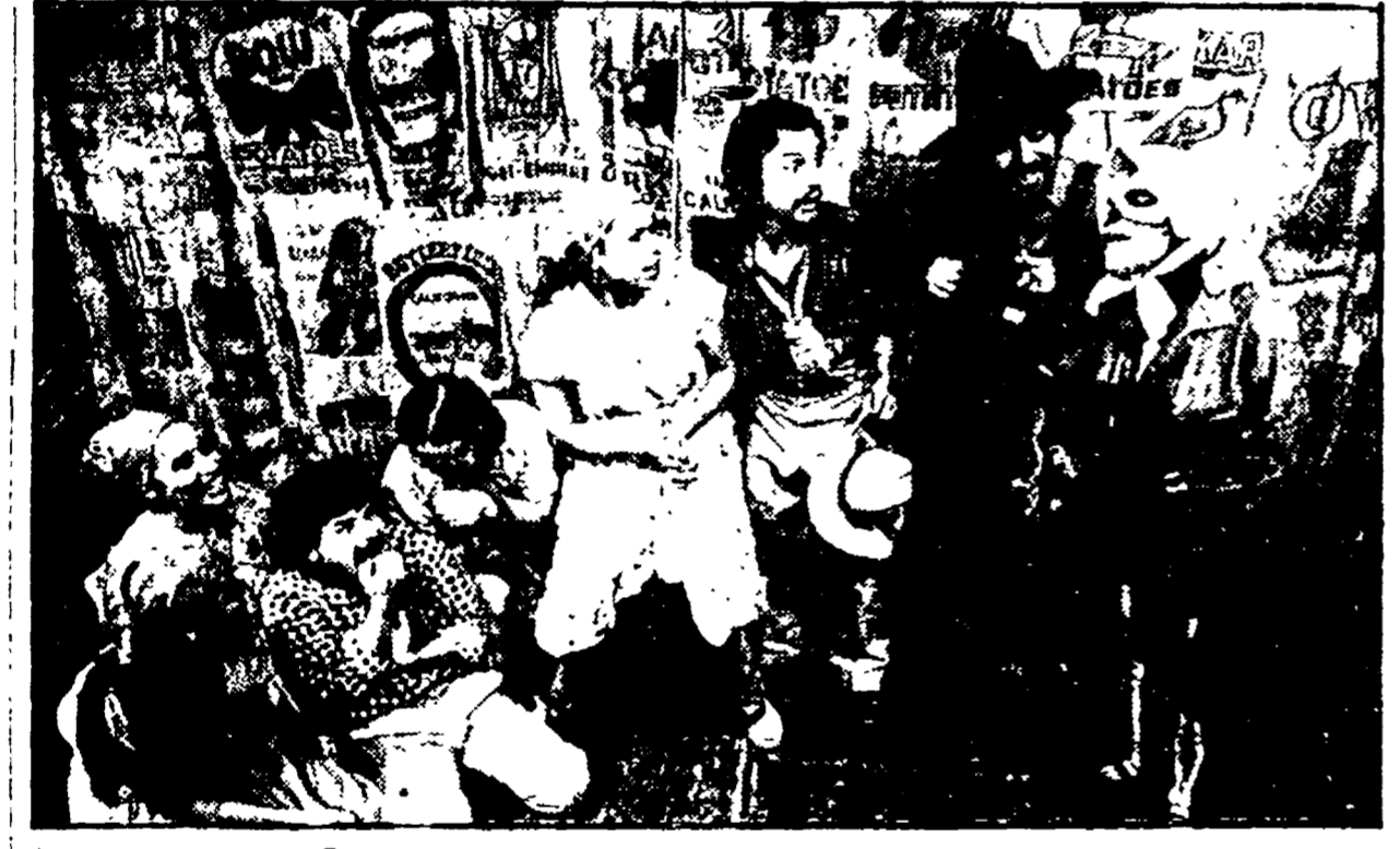
Una scena della « Carpa »

ROMA — Due anni fa, in settembre, il Teatro Campesino, diretto da Luis Valdez, riuscì un grande successo al Festival nazionale dell'Unità, a Napoli. Ora ha fatto ritorno in Italia ma in questi giorni è approdato al Teatro Tenda di piazza Mancini, dove presenta lo stesso spettacolo, il successo gli entusiasmi del pubblico che riempiva l'Arca di Fiesole. La Carpa è lo spettacolo che ha fatto di Valdez un attore di prim'ordine. Parla della vita dei contadini, dei loro problemi, delle loro aspirazioni. Chi sono gli oppressi, in questione? Campesino vuol dire contadino. E i contadini sono i perseguitati che popolano la tenda, in particolare, immigrati, per lo più messicani, ma ce ne sono di altra origine: filippini, neri, giapponesi, che si trasferiscono clandestinamente nel Sud degli Stati Uniti in cerca di lavoro, attratti dal miraggio di un possibile guadagno. La loro condizione è quella di « legali » in pieno paese dove, tuttavia, non sono ammessi a ricattare.