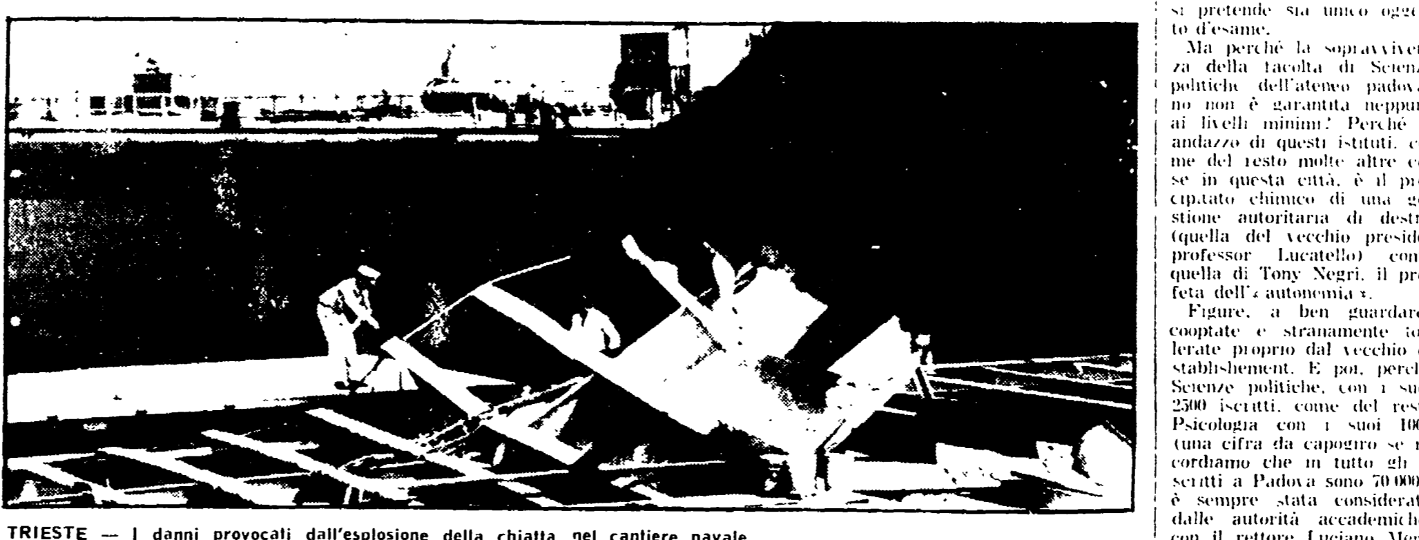
TRIESTE - I danni provocati dall'esplosione della chiatta nel cantiere navale