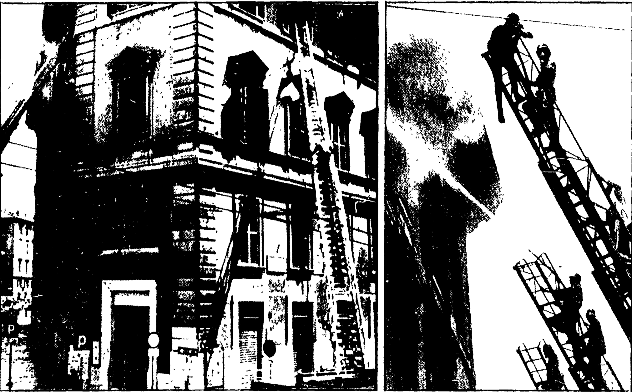
Il rettore: « niente blocchi dell'attività, forse lunedì potrà già funzionare un'ala della sede »

Almeno trecento persone hanno rischiato di fare una fine atroce - Il fuoco appiccato in un'aula deserta del secondo piano - In fiamme un'intera ala dell'edificio - Pericolante un cornicione - Salvata dai vigili del fuoco la preziosa biblioteca - Soltanto un anno fa l'ultimo restauro