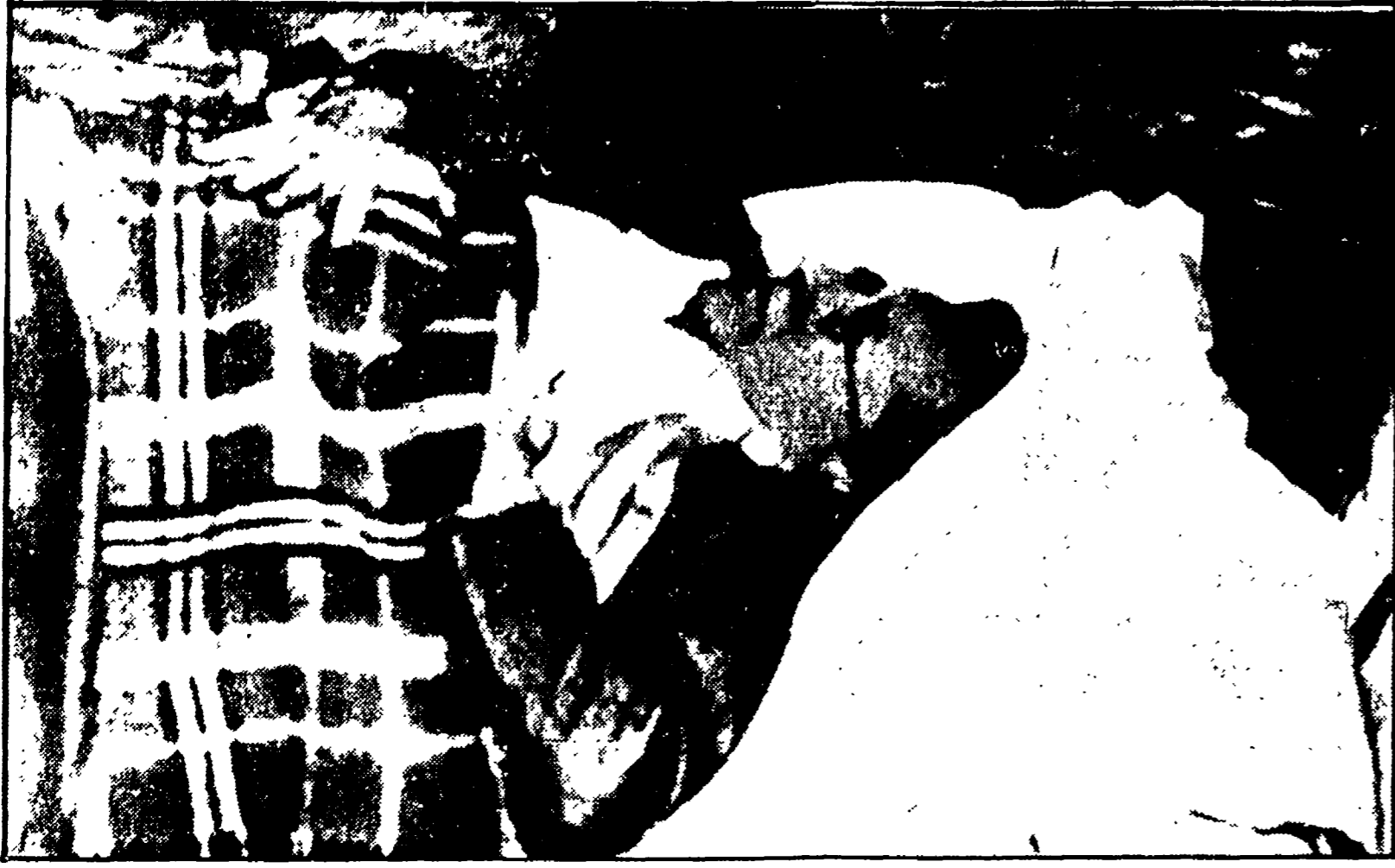
14 luglio 1948: il compagno Togliatti, ferito dalle revolverate di Palmante, viene trasportato al Policlinico

È vero quel che dice il nostro amico, che chi l'ha vissuta non sa raccontare la storia di questi ultimi trent'anni se non sotto forma di autobiografia. Immaginiamoci dunque uno storico di domani, severo e distaccato, che scavando negli archivi ci spiegherà tutto dell'attentato a Palmante Togliatti del 14 luglio 1948 e ci dirà fino a che punto la polizia di Scelba era preparata a una risposta «totale» in caso di rivolta popolare, quali e quanto stretti erano ormai i legami con la fonte politica e militare americana capaci di imporre non solo una restaurazione ma un regime di spillo anticomunista. Non sappiamo, però, se scopriremo mai se quello studente venuto da Catania, Andrea Palmante, a sparare al capo del partito comunista agiva per conto di qualcuno e di chi, posto al di qua o al di là dell'Atlantico, il delitto politico, quale come la non lascia facilmente, è delle della provocazione e dell'ordine impartito dai mandati. Ne abbiamo anche troppa esperienza.