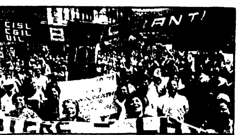
Una delle tante manifestazioni dei braccianti, protagonisti storici delle lotte per lo sviluppo del piano campano