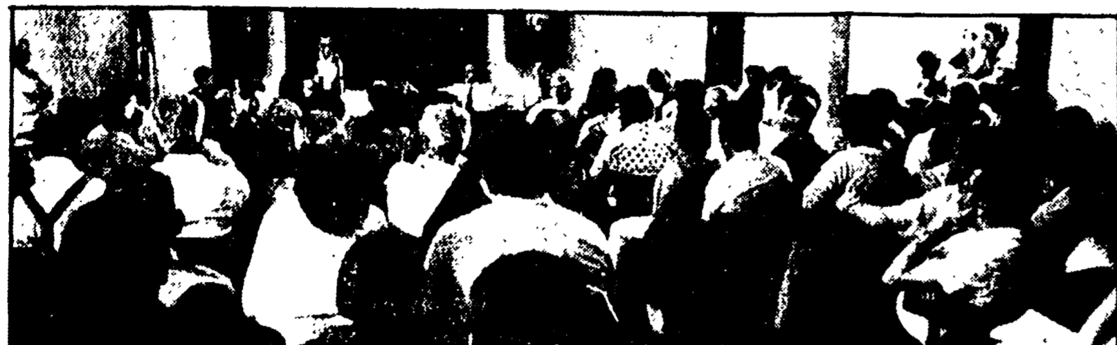
L'assemblea al Maschio Angiolino dei sindaci e delle amministrazioni dei diciannove comuni Irpini