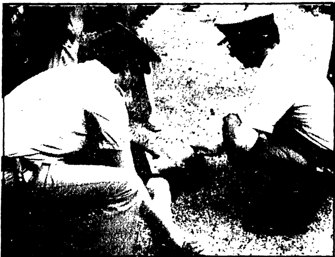
Una giovane non ha retto, è svenuta durante la cerimonia funebre alla quale hanno assistito nel cimitero di Tarragona, ieri, migliaia di persone

TARRAGONA - Continua il mesto e spesso sordo pellegrinaggio a ciò che rimane del camping «Los Alfaques» teatro due giorni fa di una delle più spaventose sciagure che abbiano mai colpita il turismo. Per le autorità spagnole il bilancio della sciagura è fermo a 131 morti. Ma stando ai dati dei vari ospedali di Barcellona e di Valencia che ospitano complessivamente non meno di 250.000 grandi ustionati, in queste ultime 24 ore il numero delle vittime ha già superato quota 170. Come ha confermato lo stesso dottor Alacava, Capivall sottosegretario alla sanità, i ricoverati destinati a morire nei prossimi giorni ammontano a circa mezzo di cento.