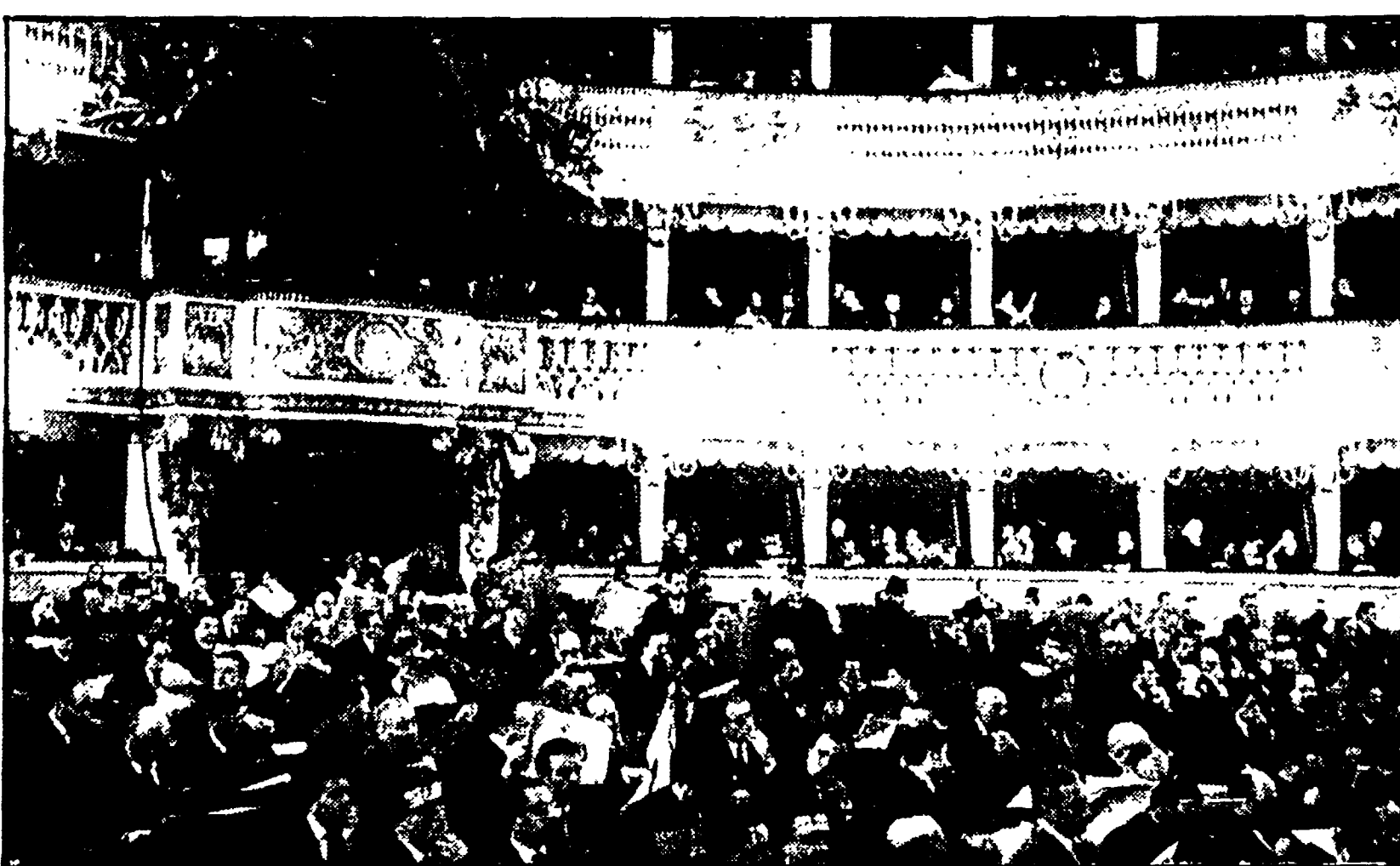
Un aspetto del teatro S. Carlo di Napoli durante i lavori del VIII congresso della Dc nel 1962

Il partito cattolico nella Storia di Giorgio Galli