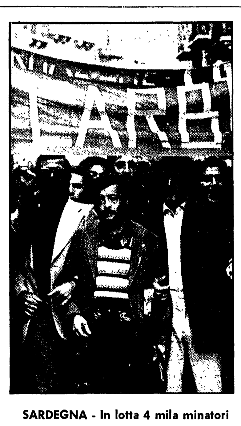
SARDEGNA - In lotta 4 mila minatori