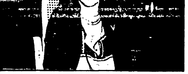
Stefania Casini è coautrice di «Oggetto: uomo» (Rete 2, 21, 10)