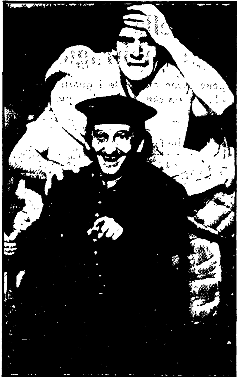
Nelle foto, due momenti dello spettacolo: a sinistra «Ubu re», a destra «Ubu incatenato»