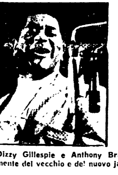
Dizzy Gillespie e Anthony Braxton, esponenti rispettivamente del vecchio e del nuovo jazz: presto di nuovo a Roma