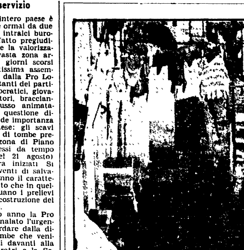
In TV un'inchiesta su Rocchetta S. Antonio (FG)

Un insediamento pre-romano rischia di saltare sotto i colpi delle ruspe — Già, serve la terra per un campo di calcio! — All'origine di tutto il mancato intervento per la valorizzazione di Piano Carbone