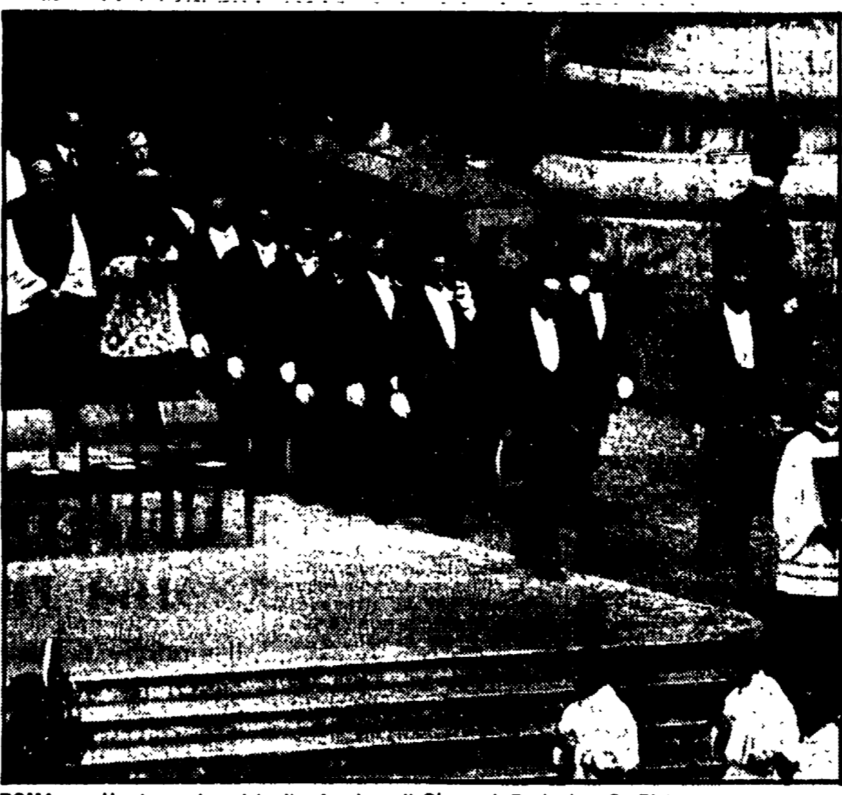
ROMA — Un'immagine del rito funebre di Giovanni Paolo I a S. Pietro

Sotto un cielo grigio, all'inizio, e poi sotto una pioggia sempre più fitta si è svolta ieri pomeriggio sul sagrato di S. Pietro la cerimonia funebre per Giovanni Paolo I, la cui bara è stata collocata sul sepolcro davanti all'altare come fu per Paolo VI. Alla concelebrazione, presieduta dal decano del Sacro Collegio, l'antastese card. Confalonieri che ha tenuto l'omelia, hanno preso parte circa ottantamila persone, 102 delegazioni di Stato di diversi paesi del mondo, i membri del corpo diplomatico accreditati presso la S. Sede, rappresentanti di dieci organizzazioni internazionali tra cui l'invitato dal segretario generale dell'Onu Waldheim; rappresentanti di 15 Chiese non cattoliche, 41 cardinali e oltre 100 vescovi. Il nostro paese era rappresentato dal presidente del Consiglio Andreotti. Era pure presente il presidente della Repubblica Italiana, Pertini, in forma privata ed è stato invitato a prendere posto in prima fila. Erano presenti alla cerimonia anche i congiunti del Papa scomparso (la sorella, il fratello Edoardo con la moglie, i nipoti) che dalla mattina erano rimasti nella Basilica per la veglia funebre.