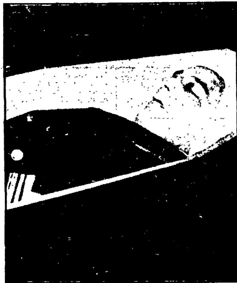
BILBAO - Il corpo del vice comandante della base navale basca, ucciso l'altra notte