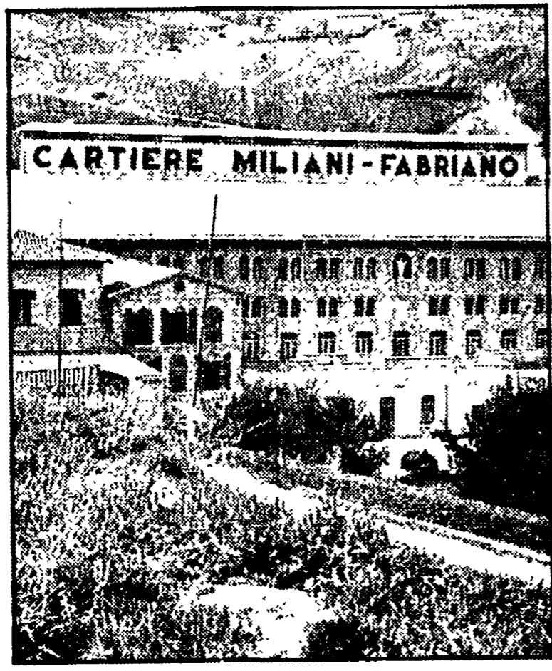
Cartiere Miliani-Fabriano. Parco e Castelramondo. Ieri si è discusso anche del passaggio delle Cartiere al Poligrafico dello Stato...

Ieri a Roma si è discusso dell'inquinamento e del passaggio al Poligrafico