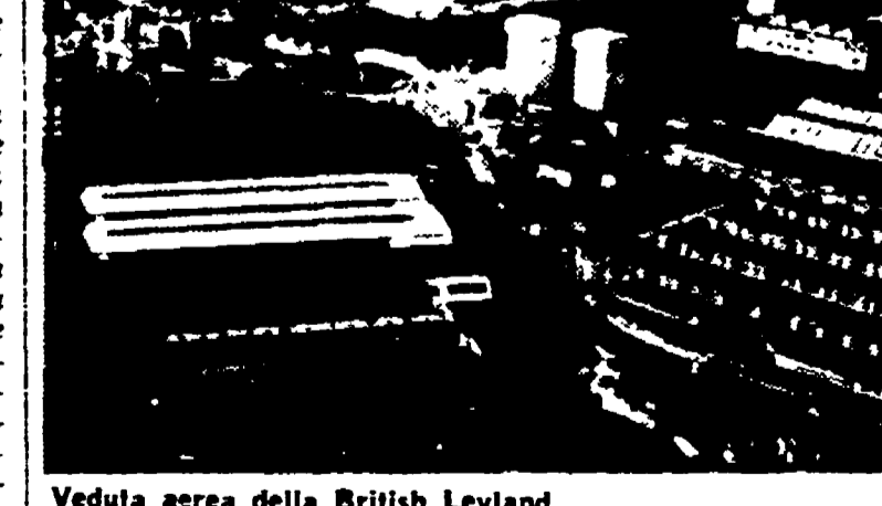
Veduta aerea della British Leyland

giuste ditte tenendo conto dell'incidenza degli scioperi, da esse registrate negli ultimi anni. Si pensa che l'intero schema lanciato dalla CBI possa eventualmente essere contro assicurato da qualcuno dei grandi rappresentanti del ramo come i Lloyd's.