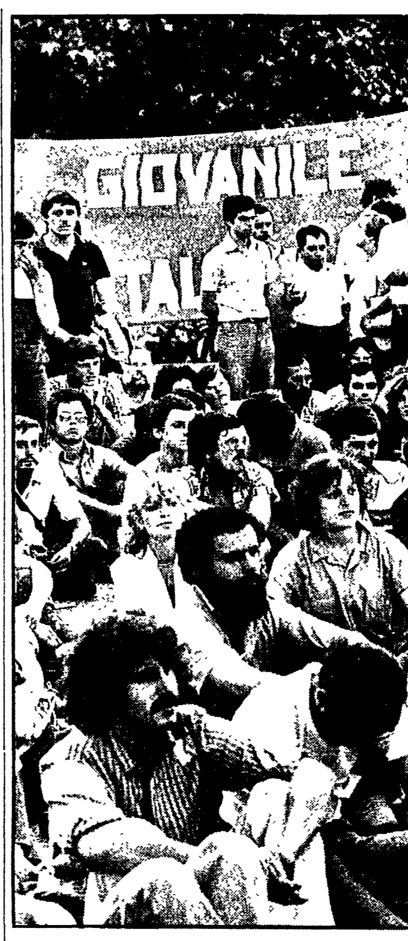
MILANO - I giovani partecipano, numerosi, ad un dibattito

Il terzo punto, infine, della lettera di un mese fa (il 10 agosto) e dell'incontro di ieri: il sindaco di Napoli ha sollecitato il governo a dare una risposta sulla possibilità di modificare, nel quadro della riforma sanitaria, le spequazioni esistenti tra Sud e Centro-Nord nella distribuzione di medici e personale sanitario, iniziando dal fondo nazionale ospedaliero.