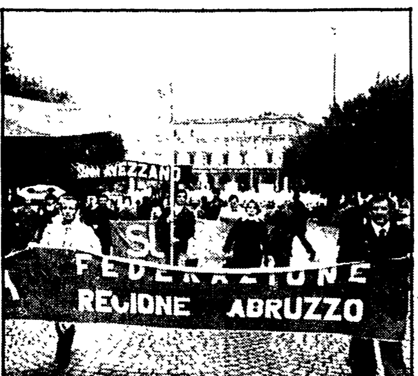
Nostro servizio L'AQUILA — Fra crisi energetica, destini individuali e collettivi, può anche accadere che qualcuno al giorno d'oggi non abbia ancora risolto il problema di un tetto sicuro.

All'offensiva molti proprietari che non intendono sottostare alla legge sull'equo canone. I trucchi per eludere le norme - Le iniziative dell'amministrazione comunale - Le carenze di organismi pubblici. Perché alcune imprese non completano appartamenti dell'Istituto case popolari?