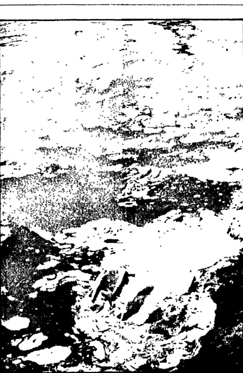
L'inquinamento idrico è la causa delle intossicazioni a Isola

L'esponente repubblicano si è dimesso l'altra settimana dopo essersi appropriato di trenta milioni. Il mancato risanamento della vita pubblica isolana - Quali conseguenze politiche per la vicenda?