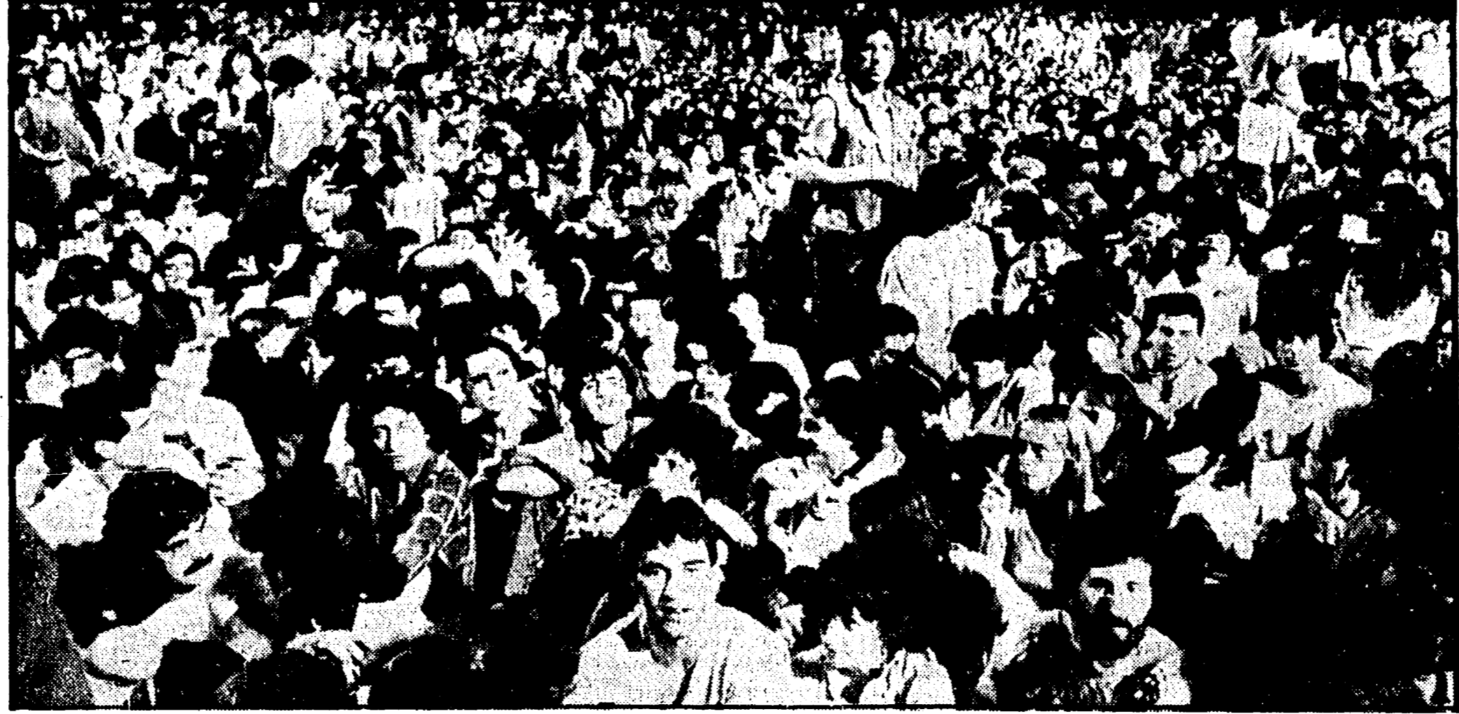
Un aspetto dell'immensa folla convenuta a Campo di Marte per il concerto di PATTY SMITH

Alle 21,15 i riflettori dello stadio si spengono e lei, quella che qualche giornale ha dichiarato addirittura «profetessa» sale sul palco. Ma il pubblico era lì ad aspettare già dal mattino. Una specie di grande festa prima, durante e dopo lo spettacolo. Balli, ritmo con le mani, ondeggiamenti di tutti quelli acciampati nel prato.