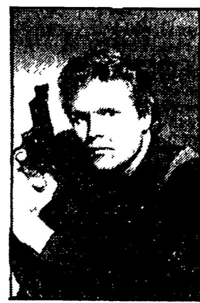
John Savage è il giustiziere

COMPUTER PER UN OMICIDIO — Regia: Charles Jarrot. Tratto dal romanzo "The Amateur" di Robert Littell. Interpreti: John Savage, Marthe Keller, Christopher Plummer, Arthur Hill, Ed Lauter, Nicholas Campbell, John Marley, Musiche: Ken Wannberg, Stanislavski. Giallo fantapolitico, 1981.