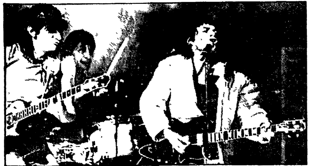
Guerra a Firenze a colpi di partito per il concerto di luglio. Caduta la tappa romana, la DC esorcizza gli «invasori dal Centro-Sud»