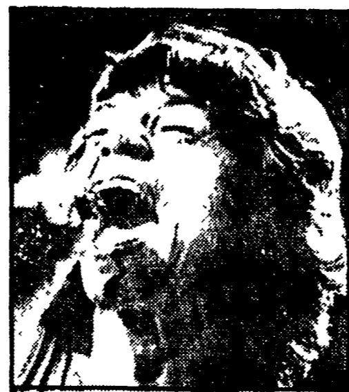
I Rolling Stones, a sinistra il leader Mick Jagger, durante la trionfale tournée americana di alcuni mesi fa