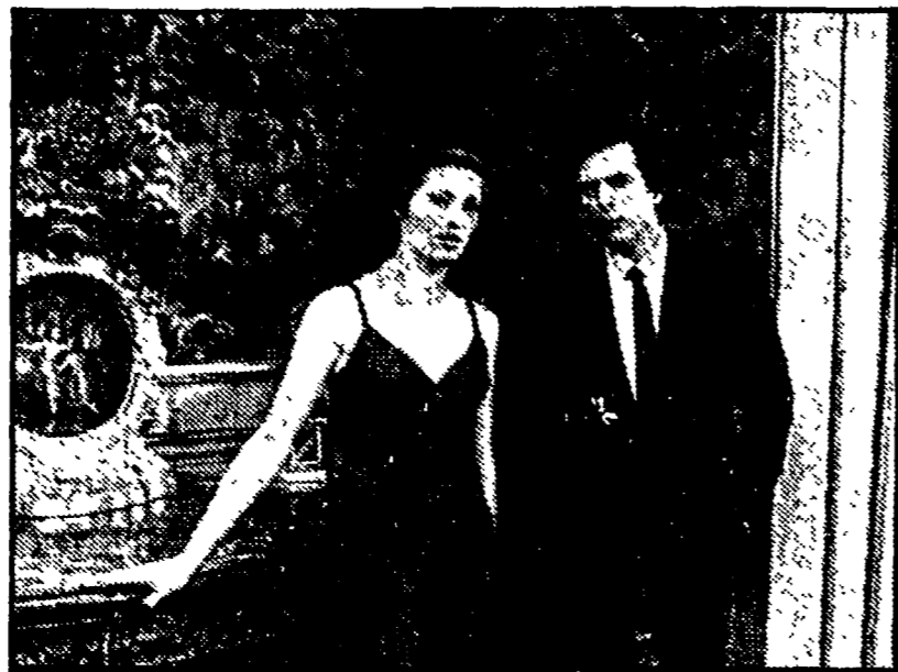
Sotto, una scena di «A toute allure»...