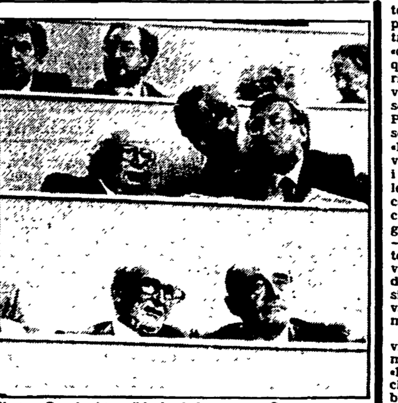
Natta e Zangheri tra gli invitati al congresso Dc

della maggioranza. Smettendo i panni di capo del governo e indossando quelli di segretario di partito, Craxi se la prende con i «molti spunti polemici rivolti in particolare e con inspiegabile insistenza ai socialisti».