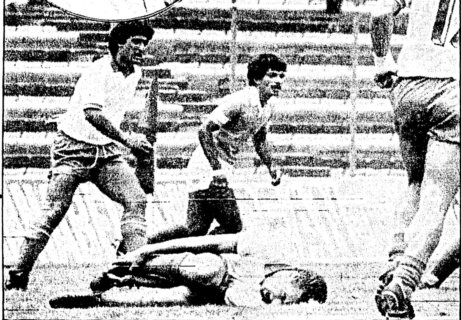
Ieri è arrivato a Città del Messico