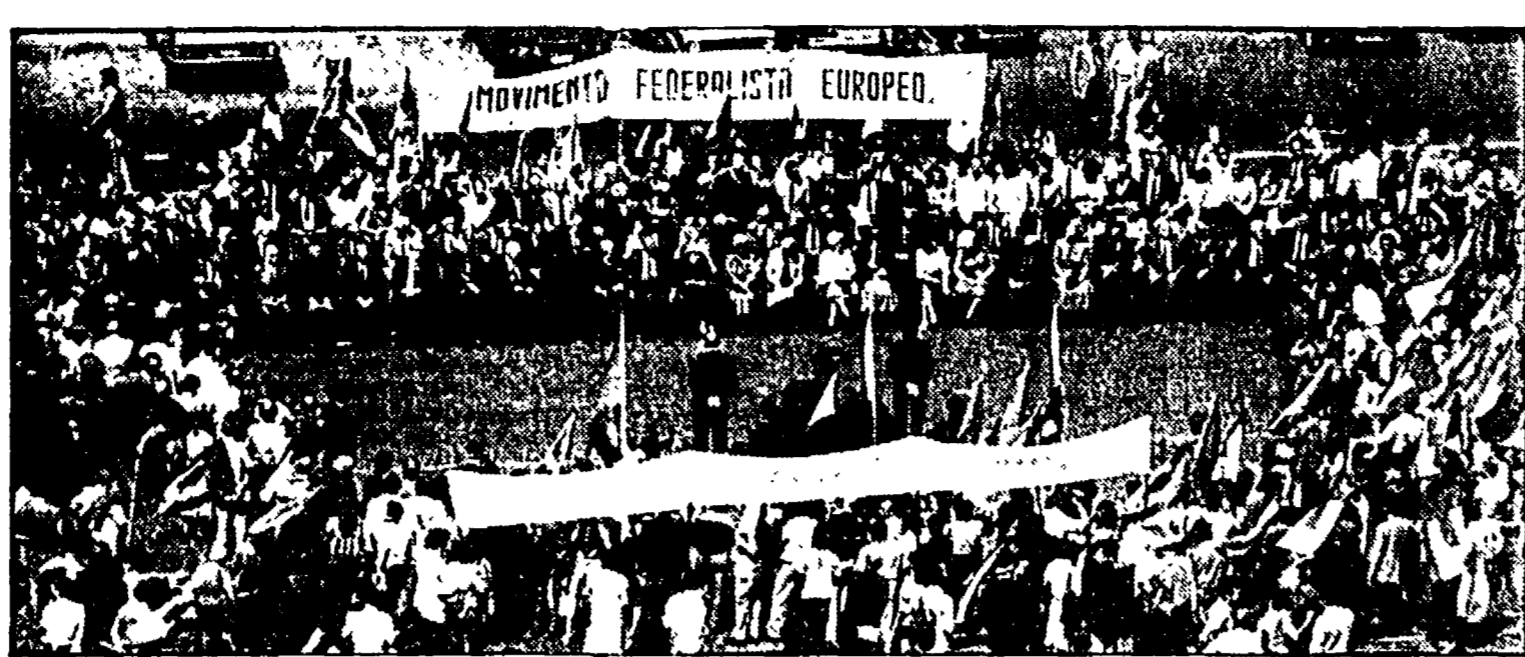
Uno scorcio di piazza Montecitorio durante i solenni funerali di Altiero Spinelli, spentosi venerdì a Roma