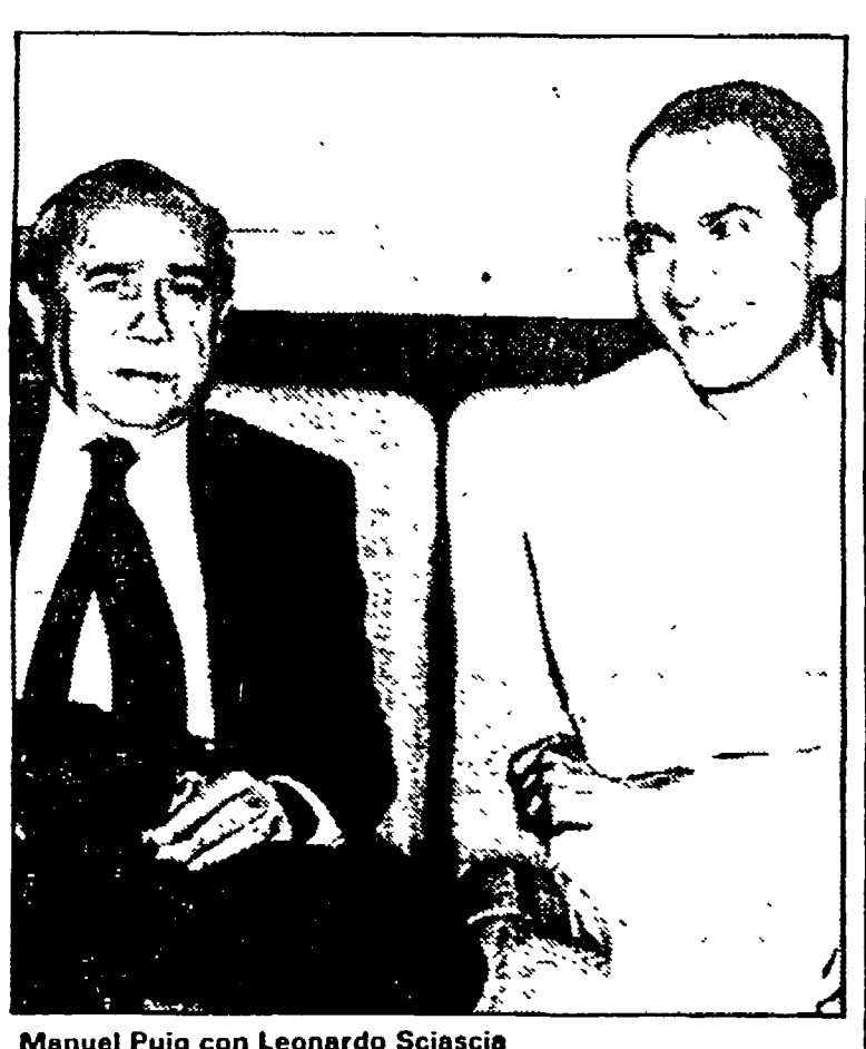
Manuel Puig con Leonardo Sciascia