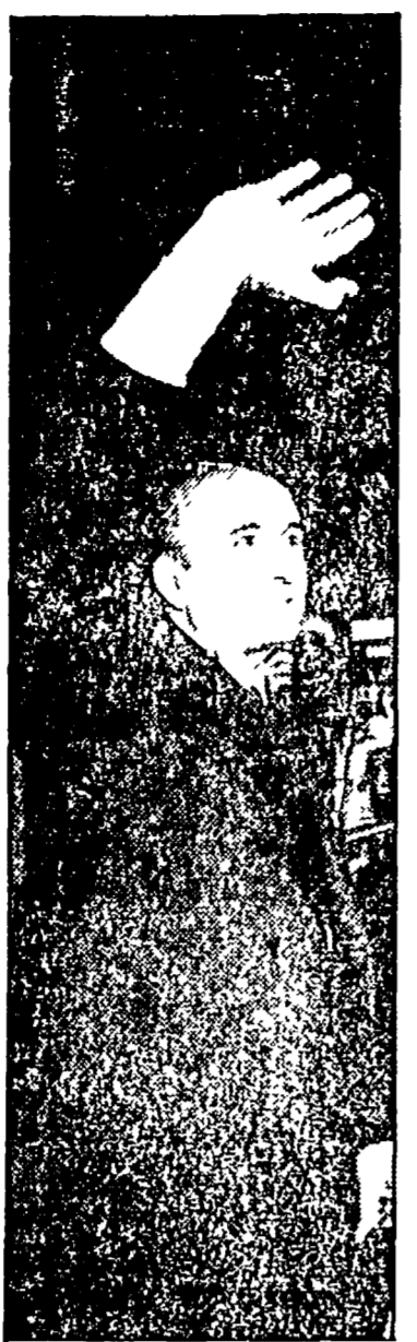
Il presidente del Consiglio Bettino Craxi è stato fatto sedere tra le delegazioni straniere presenti al congresso democristiano

ROMA — «Ringrazio per essere qui e saluto l'onorevole presidente del Consiglio...»