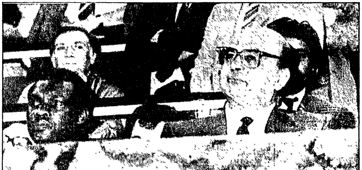
Il presidente del Consiglio Bettino Craxi è stato fatto sedere tra le delegazioni straniere presenti al congresso democristiano

ROMA — Giunto al congresso dal quale si attende finalmente una consacrazione plebiscitaria (o quasi), il leader democristiano non ha resistito naturalmente alla tentazione di esordire vantando il bilancio degli ultimi due anni della sua segreteria.