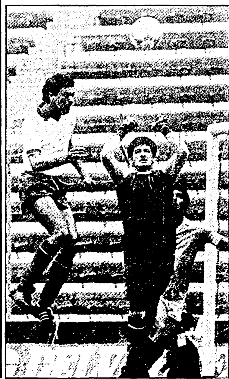
Bearzot sembra essere perplesso dopo l'ultimo allenamento degli azzurri. Ma De Napoli e Galderisi potrebbero risolvere i suoi problemi. Sotto, Altobelli in una fase della partita con il Guatemala e la sigla televisiva che accompagnerà le trasmissioni durante i mondiali