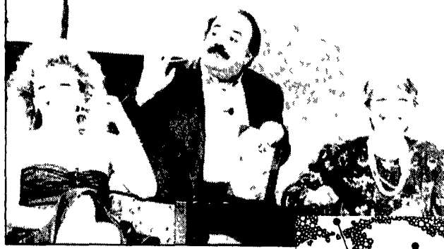
Un momento del «Maurizio Costanzo Show»