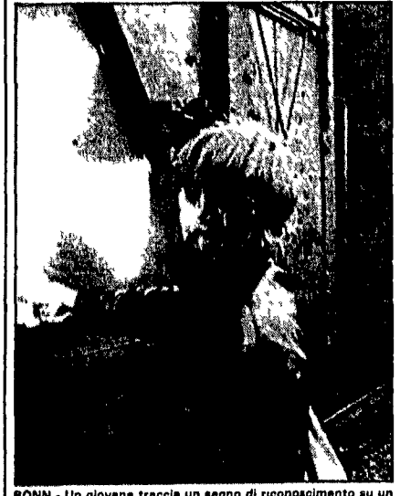
BONN — Un giovane traccia un segno di riconoscimento su un vagone pieno di latte contaminato

La platea ha reagito energicamente quando si è parlato di selezione sociale nell'università, dei rumori assordanti quanto giovani ancora esclusi dall'accesso agli studi superiori, e di quelli soprattutto che — una volta entrati — si perdono per strada e senza giungere alla laurea (sono addirittura il 70%). Abbiamo tutti invocato una politica di sostegno materiale, massiccia ed efficace, per evitare sia le esclusioni che gli abbandoni causati dalle condizioni economiche disagiate, invertendo la tendenza attuale. Ma abbiamo anche sottolineato un'importante preoccupazione che si continua negli studi, e cioè di una larga fascia di studenti che faticano fra mille difficoltà, offrendo loro servizi generali. Oggi nell'università il studente è solo. Certo non mancano le eccezioni, specie nei piccoli atenei, ma è innegabile che lo studente vive una condizione di solitudine. Un'esperienza di solitudine, in larga misura, caratterizzata dall'assenza, dall'epidemia della presenza fisica studentesca. E proprio verso lo studente è solo, e non conta. Non ha peso nelle scelte e nello svolgimento dell'attività che lo riguarda come destinatario dell'insegnamento. Finché durerà questa situazione, l'organizzazione didattica dell'università non migliorerà.