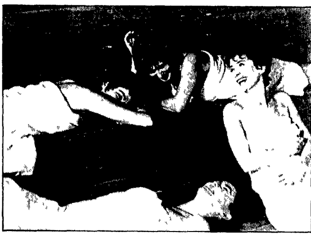
Un'inquadratura del film di Denys Arcand «Il declino dell'impero americano»