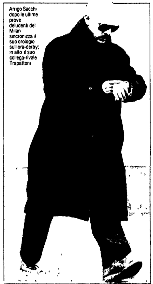
Arrigo Sacchi dopo le ultime prove deludenti del Milan sincronizza il suo orologio sull'ora-derby, in alto il suo collega-rivale Trapattoni