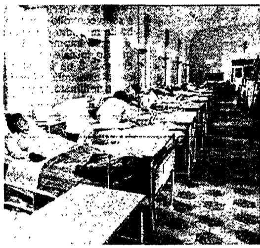
Una corsia del Policlinico di Roma

Il governo prende tempo Sempre in alto mare il rinnovo del contratto scaduto da due anni e mezzo