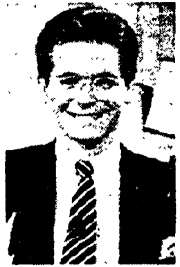
Alessandro Cecchi Paone