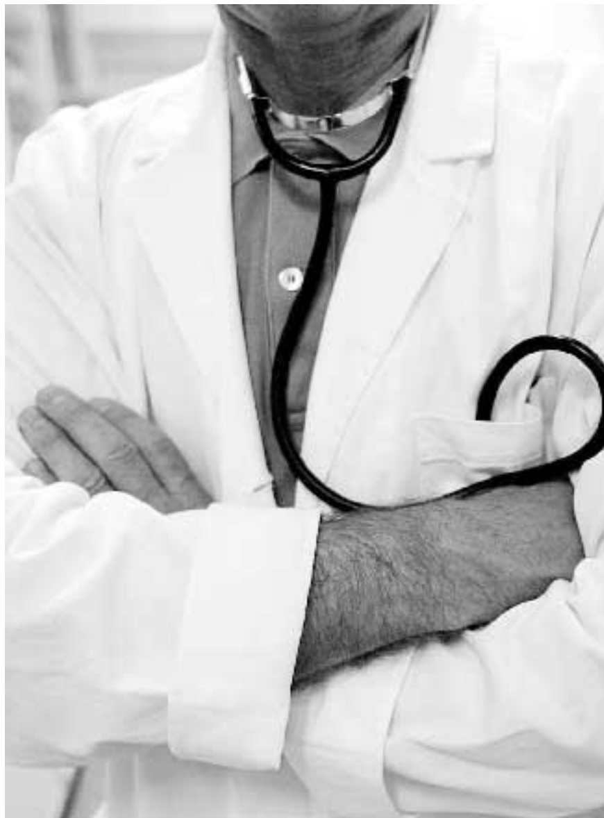
Ancora una volta medici a braccia incrociate