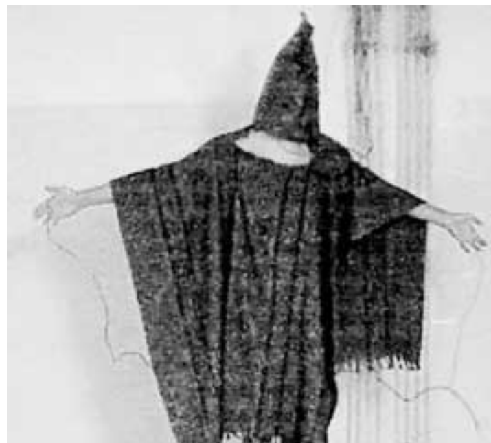
Un prigioniero incappucciato e costretto a stare immobile. «Se ti muovi, entreranno in azione gli elettrodi»

Il gruppo Ds della commissione Esteri (primo firmatario Valdo Spini) ha presentato un'interrogazione a risposta immediata sulla questione delle torture subite dai prigionieri iracheni. I deputati diessini vogliono sapere «quali siano le informazioni che il governo italiano abbia ritenuto di chiedere in proposito, quale sia il giudizio del governo italiano su questi episodi e quali conseguenze il governo italiano intenda trarne». Sul tema delle torture interviene anche il deputato Ds Pietro Folena che ha presentato un'interrogazione al ministro degli Esteri sulla situazione nel carcere di Nassiriya. Folena vuol sapere «dove vengono reclusi coloro che vengono arrestati dai militari del contingente italiano in Iraq. Qualora gli arrestati vengano rinchiusi nel carcere di Nassiriya - prosegue l'esponente del correntone - quali informazioni sono in possesso del governo riguardo alle gestioni del carcere e quali siano le condizioni di reclusione». Folena chiede inoltre quali controlli vengano esercitati dalle autorità italiane e se, nel penitenziario di Nassiriya «vengono rispettati scrupolosamente i diritti umani dei detenuti».