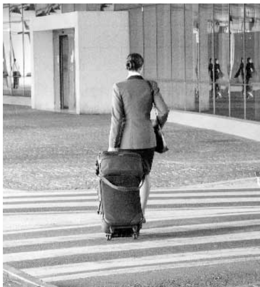
Una hostess Alitalia all'aeroporto di Fiumicino