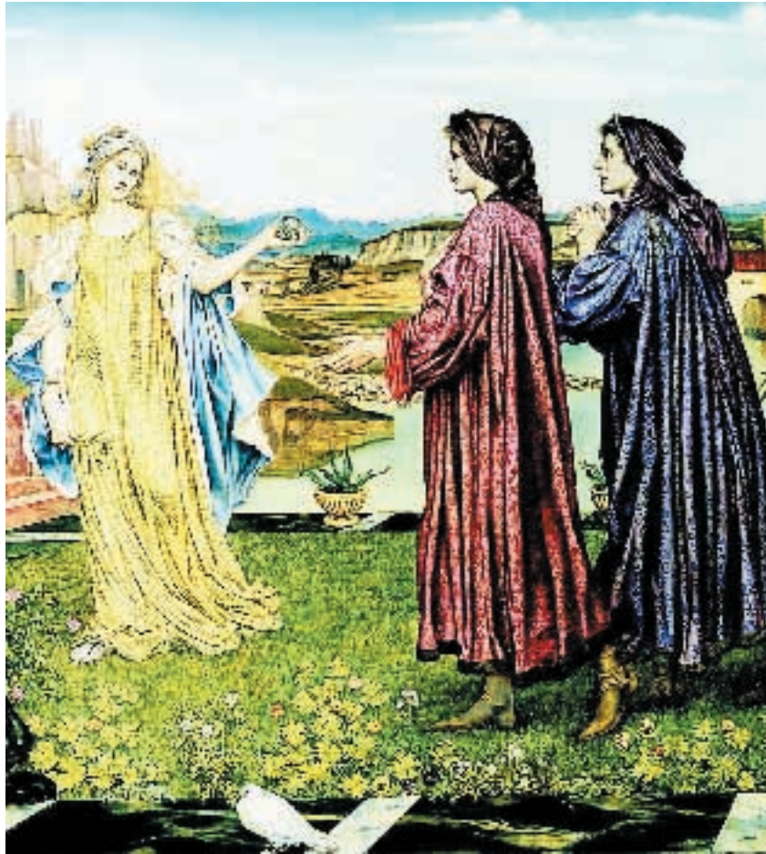
Evelyn De Morgan, «Il giardino dell'opportunità», 1892

Ma cosa cercavano davvero gli inglesi e gli americani che si recavano a Firenze nell'Ottocento? Quali luoghi visitavano? Dove e come vivevano? A questi interrogativi si propone ora di rispondere la mostra intitolata I giardini delle regine. Il mito di Firenze nell'ambiente preraffaellita e nella cultura americana fra Ottocento e Novecento (Galleria degli Uffizi fino al 31 agosto).