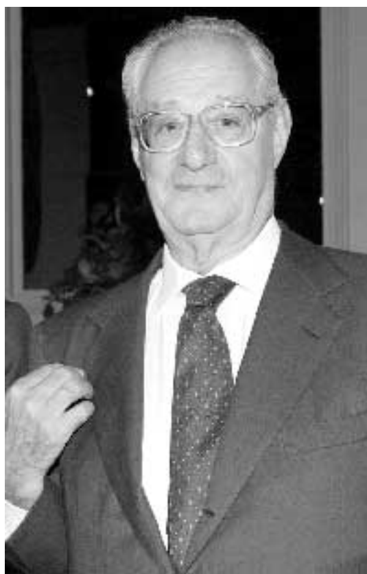
Cesare Romiti

MILANO I lavoratori dei Nuovi Cantieri Apuania hanno deciso il blocco totale della produzione «con decorrenza immediata». L'iniziativa è stata presa al termine dell'assemblea di ieri mattina promossa dalle Rsu e da Cgil, Cisl e Uil. Subito sono stati attuati dei presidi davanti ai tre ingressi dei cantieri. I lavoratori si sono riuniti di nuovo in assemblea nel primo pomeriggio per organizzare i turni dei presidi e le altre iniziative «a difesa del posto di lavoro». Obiettivo di queste azioni, si legge in un comunicato sindacale, è quello di «sollecitare impegni precisi da parte del governo sul piano industriale sugli assetti anche in considerazione del fatto che le due navi in costruzione sono praticamente finite ed altre commesse non ce ne sono». I cantieri navalmecanici di Marina di Carrara danno lavoro, in forma diretta e con l'indotto, a circa 1.300 operai. I Nuovi Cantieri Apuania sono di proprietà pubblica attraverso Sviluppo Italia. Il 27 aprile scorso c'è stato un incontro con Fincantieri sul cui esito i lavoratori e le organizzazioni sindacali «non sanno ufficialmente nulla, nonostante l'impegno del governo a riferire ogni passaggio della vicenda». «Nulla di ufficiale anche se ufficialmente si è venuti a sapere che l'incontro non è stato positivo - si legge sempre nel comunicato sindacale - da qui la decisione dei lavoratori di intensificare le iniziative di lotta».