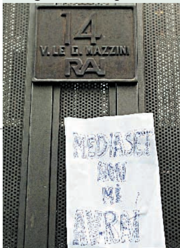
Protesta alla sede Rai di viale Mazzini