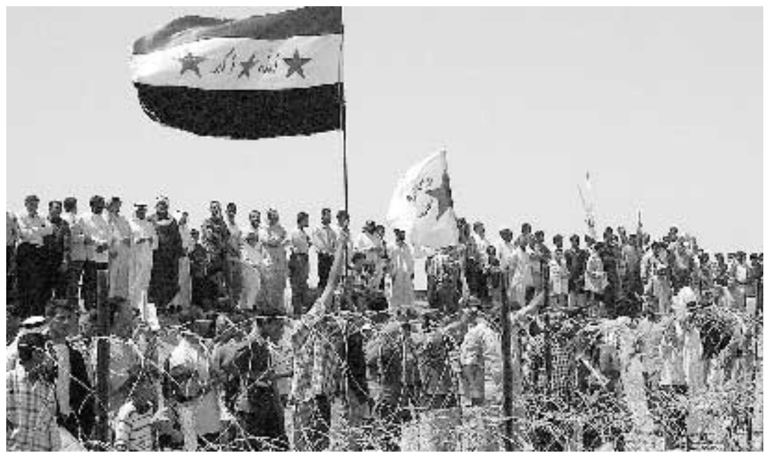
Una manifestazione di iracheni davanti alla prigione di Abu Ghraib a Baghdad