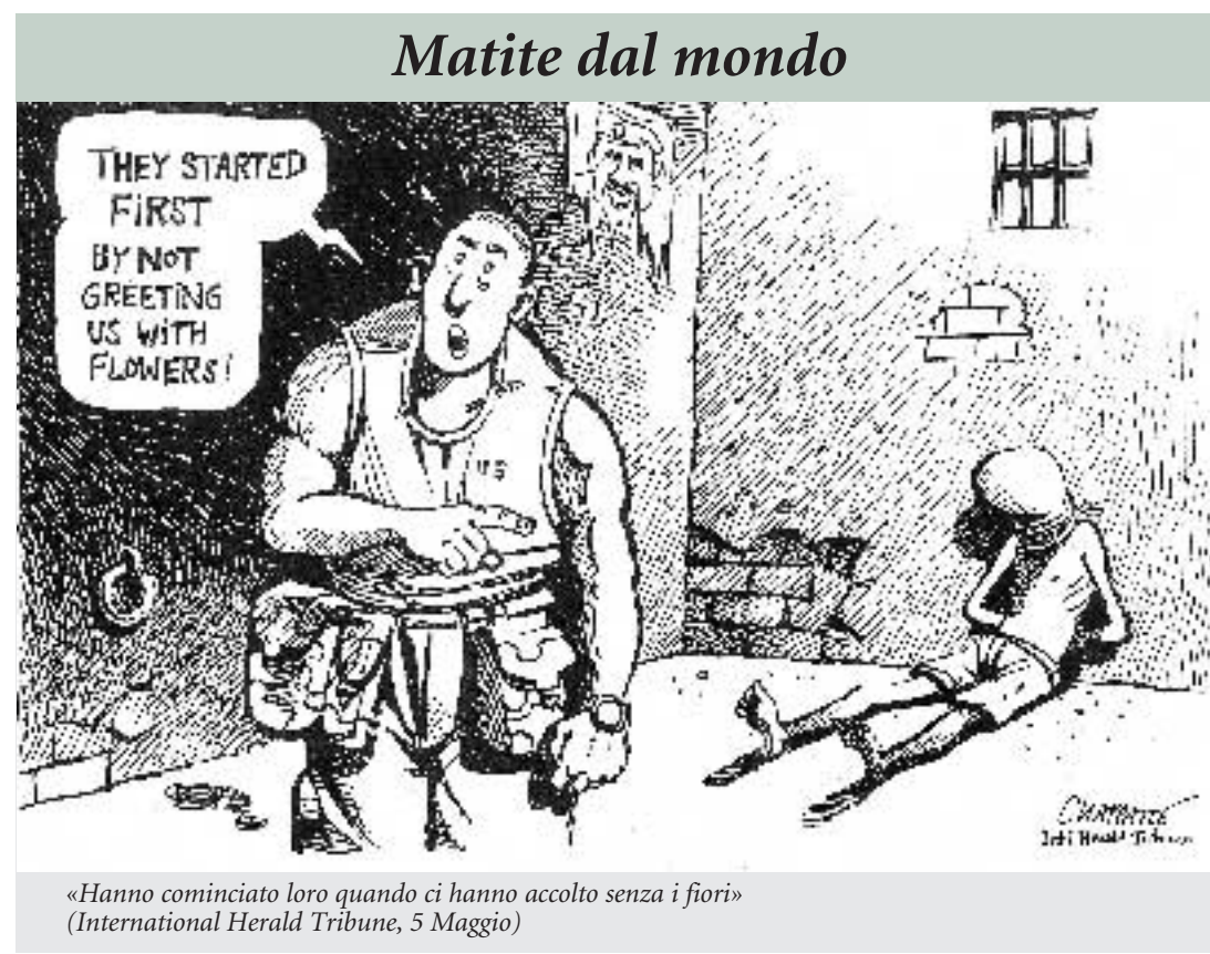
«Hanno cominciato loro quando ci hanno accolto senza i fiori» (International Herald Tribune, 5 Maggio)

La presentazione di una mozione parlamentare per il ritiro immediato delle truppe è un primo passo concreto che la politica italiana può e deve compiere per porre fine alla guerra. Perché seguendo le orme della Spagna il nostro disimpegno potrebbe favorire la partenza degli angloamericani da quel territorio innescando un effetto domino e favorendo un reale passaggio delle