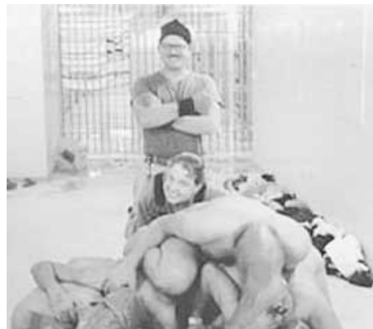
Soldati Usa posano dietro una piramide di prigionieri iracheni denudati

«Le Hawaii mi hanno fatto comprendere le potenzialità e le opportunità dell'America». Ricordando le tematiche sociali ed etniche della sua esperienza alle Hawaii, con queste parole il generale Antonio M. Taguba (il militare che ha compilato il dossier sulle torture subite dai prigionieri iracheni di Abu Ghraib per mano di soldati Usa), nel 1997, fissava la sua idea di «coesione tra le etnie». «È una possibilità - ripeteva - che non dobbiamo trasformare in una barriera». Adesso che l'esercito Usa è impantanato nel mosaico politico, sociale ed etnico dell'Iraq, le sue parole suonano come un ammonimento. Taguba, 53 anni e originario delle Filippine, faceva parte della Terza Armata Usa, con compiti logistici e di analisi circa l'evoluzione politica di paesi compresi dall'Africa orientale fino all'Asia centrale. Ha svolto servizio anche in Afghanistan. Il suo curriculum militare abbraccia oltre tre decenni. Figlio di un ergente Usa, catturato dai giapponesi nel '42, il generale Taguba ha sempre fatto riferimento all'esperienza del padre nelle galere del Giappone durante la Seconda Guerra Mondiale, durante i suoi spostamenti che lo hanno visto prima in Germania, poi a Okinawa e in Corea del Sud.