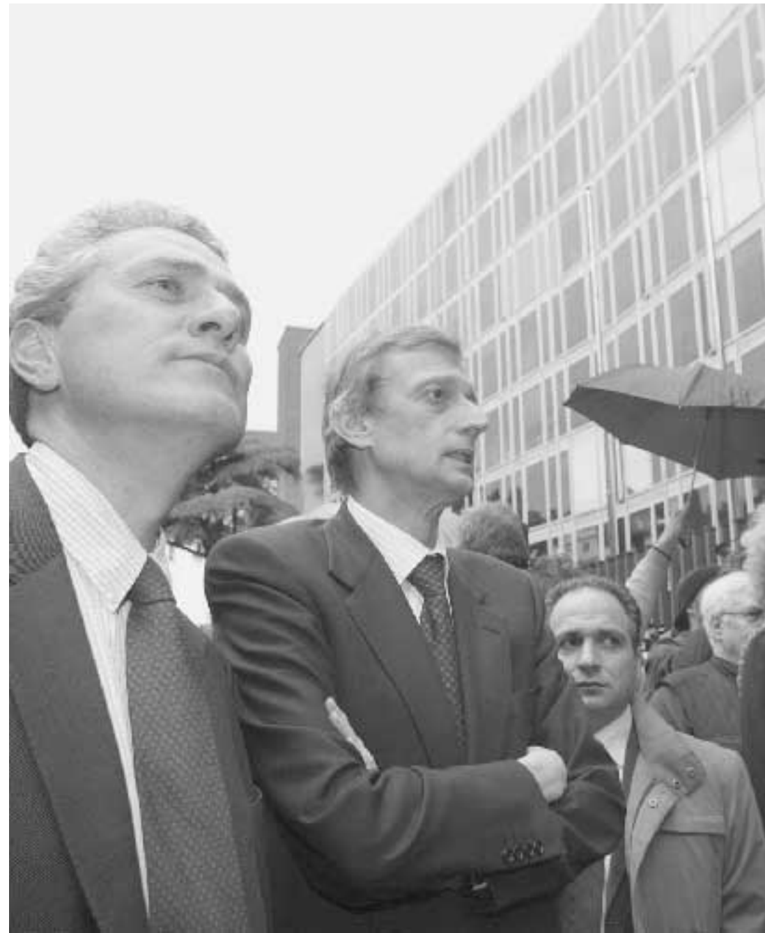
Francesco Rutelli e Piero Fassino, alla manifestazione organizzata dall'Usigrai davanti alla sede Rai

Le prime firme dell'appello al Quirinale sono di Umberto Eco, Guido Rossi, Gae Aulenti e Bachelet