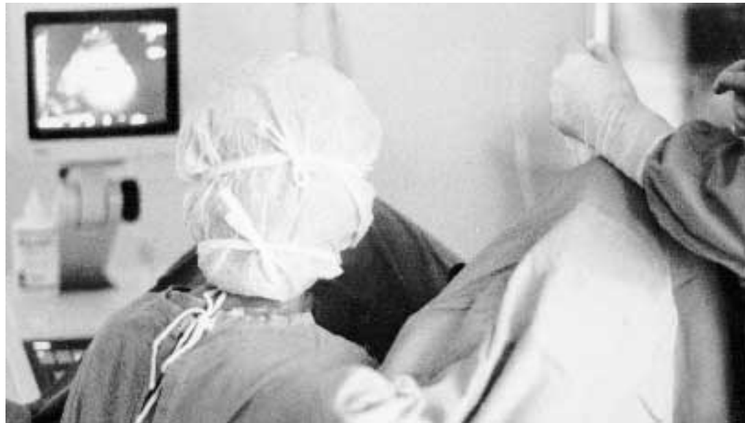
Una fase di fecondazione assistita

La diagnosi genetica preimpianto viene usata da molti anni negli Stati Uniti per evitare la nascita di bambini con difetti genetici. Questo nuovo utilizzo però potrebbe creare qualche pro-