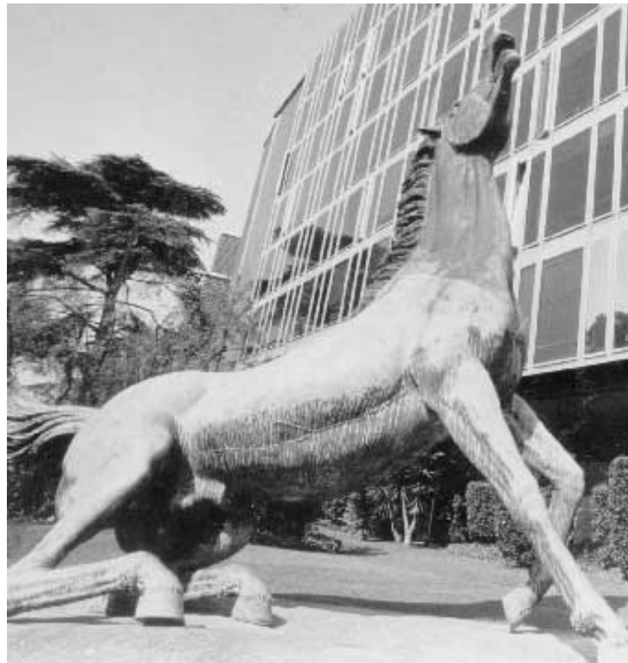
L'esterno della sede Rai di viale Mazzini