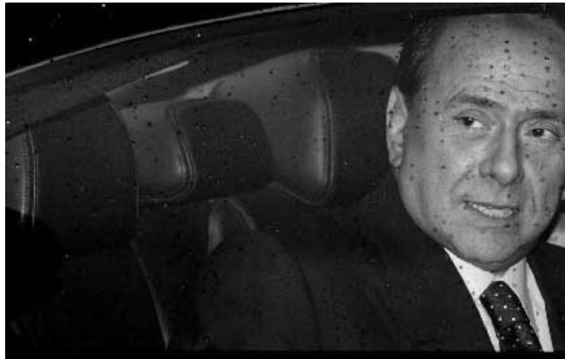
Silvio Berlusconi dopo l'incontro con il presidente francese Jacques Chirac a Parigi.

Berlusconi addolorato dalle immagini: «Ma resteremo». Torna il proclama: abbasserò le tasse