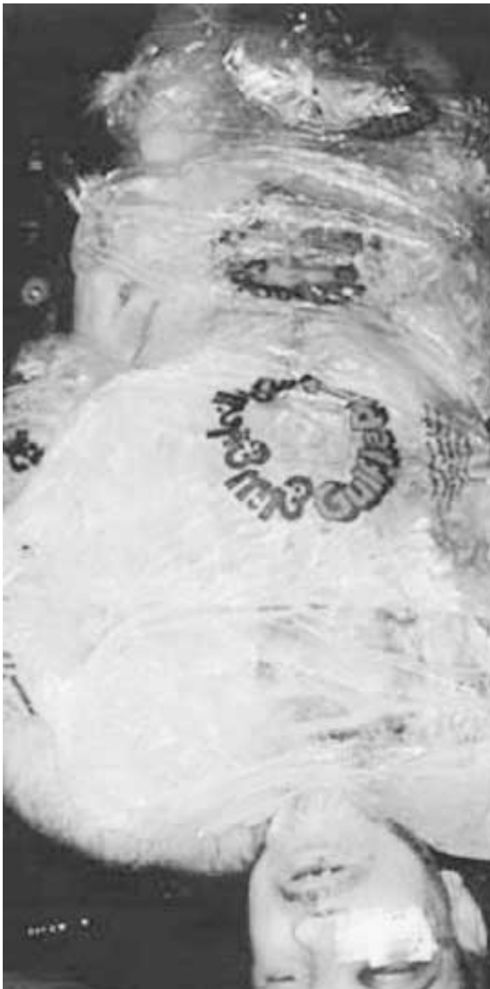
Il corpo di un prigioniero iracheno, avvolto nel cellophane e ricoperto di ghiaccio