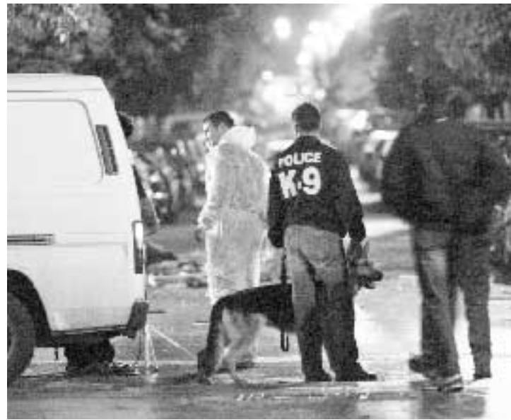
A sinistra: le immagini dell'attentato di ieri in un quartiere centrale di Atene. Sotto: una veduta dei lavori allo Stadio Olimpico della capitale