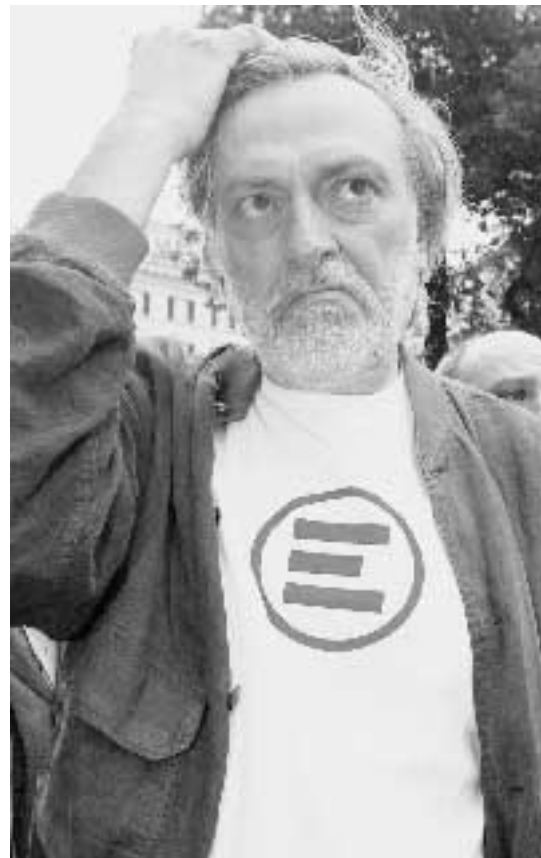
Sopra Gino Strada. A destra la protesta a Londra