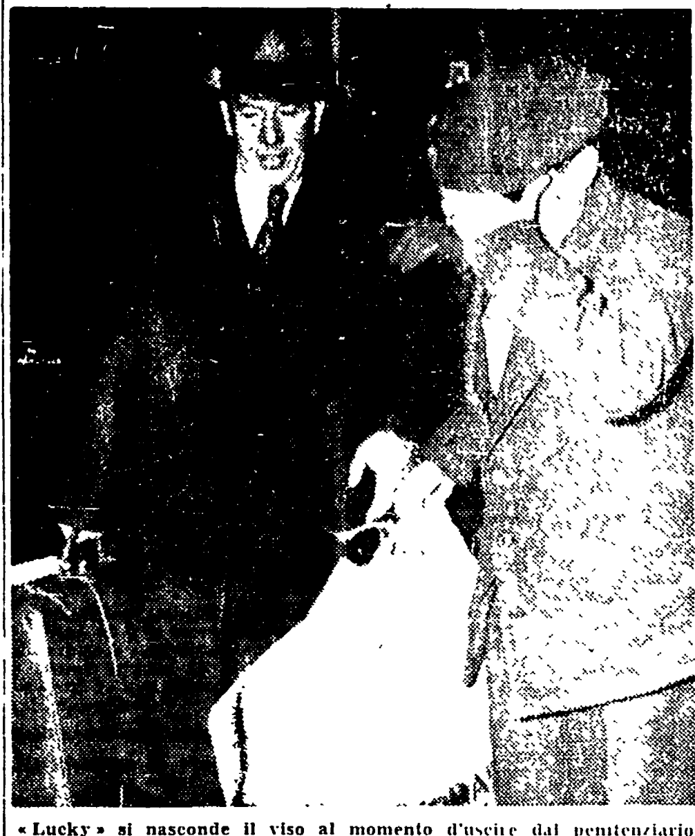
«Lucky» si nasconde il viso al momento di uscire dal penitenziario