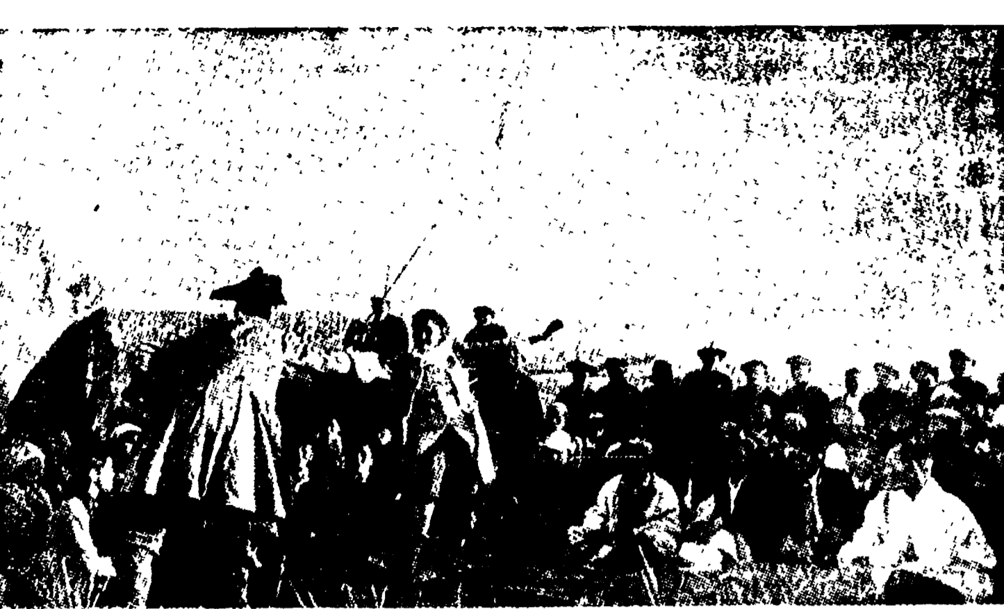
Una commedia di Goldoni in uno spettacolo all'aperto nell'Azerbaigian