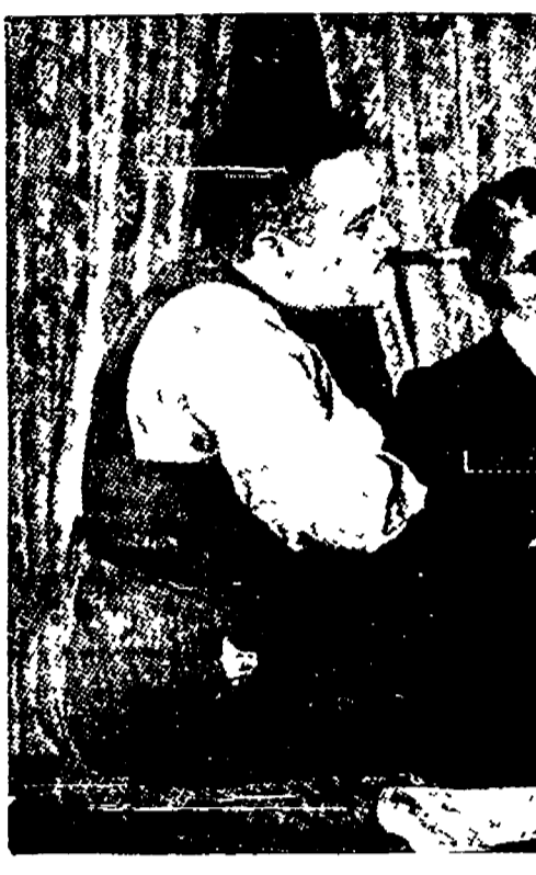
Una scena di «Svegliati e canta» di Clifford Odets nell'edizione del Group Theatre