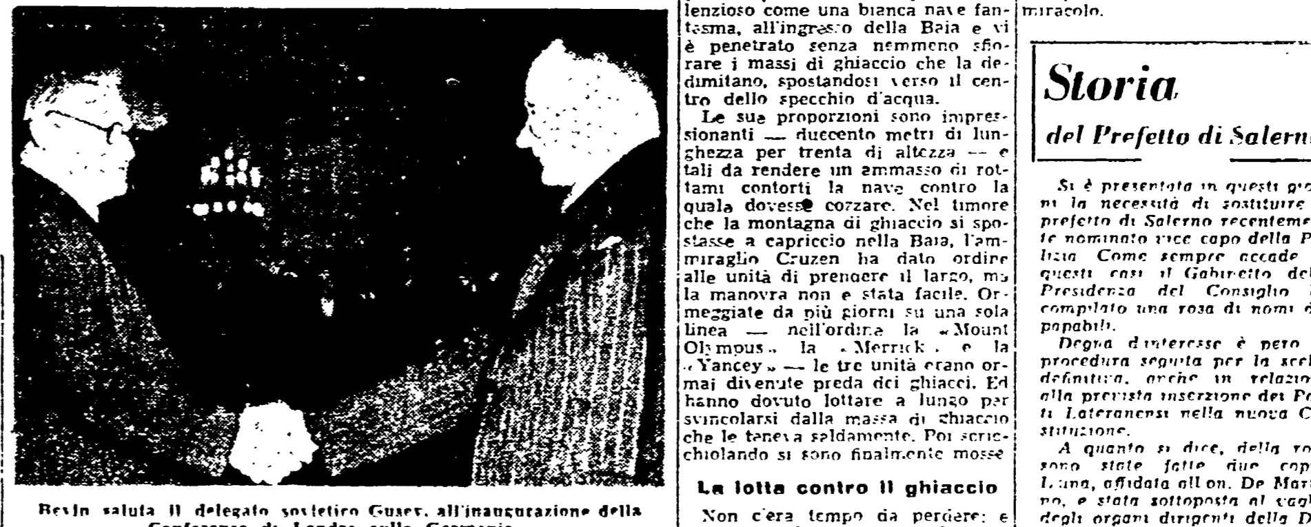
Bevin saluta il delegato sovietico Guere, all'inaugurazione della Conferenza di Londra sulla Germania.

Si è presentata in questi giorni la necessità di scegliere un prefetto di Salerno recentemente nominato vice capo della Polizia. Come sempre accade in questi casi il Governatore della Provincia ha prescelto il nome di un certo prefetto di Salerno.