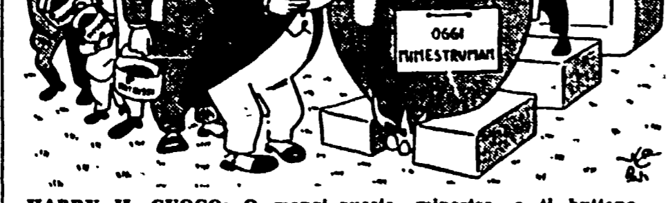
HARRY IL CUOCO: O mangi questa minestra, o il butano della Svezia