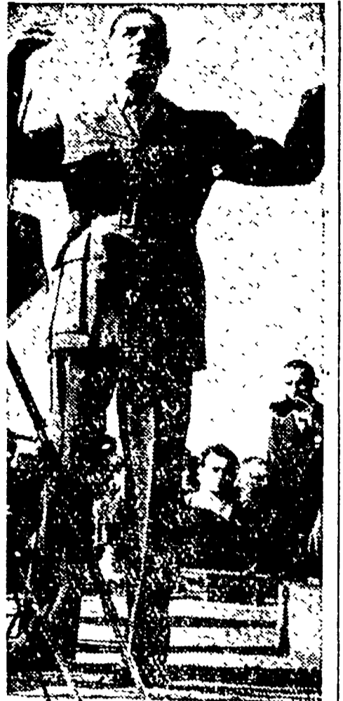
Gollardi d'Italia e d'Austria a confronto a Roma