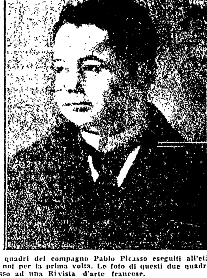
Se non andiamo errati, queste riproduzioni di due quadri del compagno Pablo Picasso eseguiti all'età di dodici anni appaiono, qui in Italia, pubblicate da noi per la prima volta. Le foto di questi due quadri furono donate l'anno scorso da Picasso ad una rivista d'arte francese.