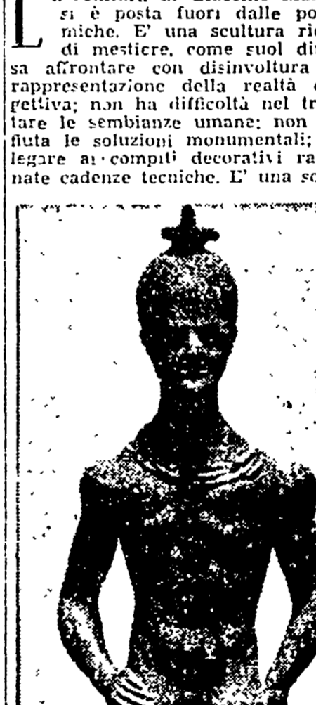
Giacomo Manzù - Il re (1931)

La scultura di Giacomo Manzù si è posta fuori dalle polemiche. E' una scultura ricca di mestiere, come suoi disegni. Non so fino a qual punto abbiano influito nella determinazione governativa le lamentele delle associazioni cattoliche e simili. In ogni caso, onestamente, noi non crediamo che gli umori bigotti della bigotte e dei preti ignoranti, C'è per fortuna un cattolicesimo, quello vero, molto più largo e generoso, che non ha più nulla di corrotto.