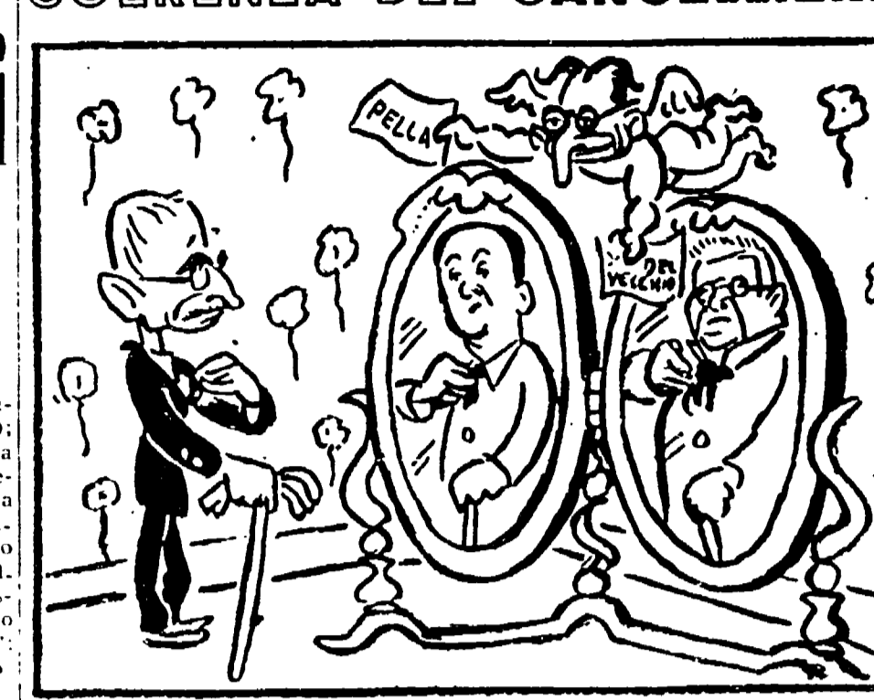
Ho espresso il parere che gli Unificazioni dei Ministeri del Tesoro e delle Finanze... (Dalle «Dichiarazioni programmatiche» di De Gasperi - «Il Popolo», 26-1-1947).

Linaioli allo specchio spoggi oggi di avere altri due volti