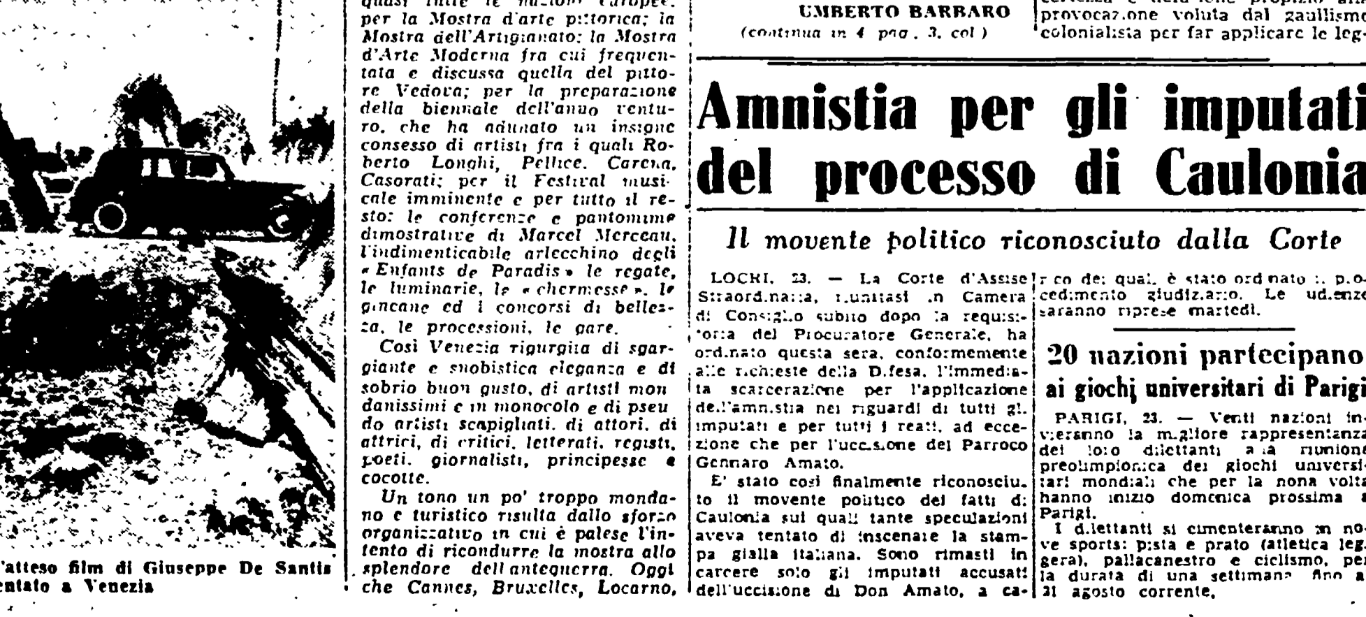
UMBERTO BARBARO (continua in 4 pag. 2, col)