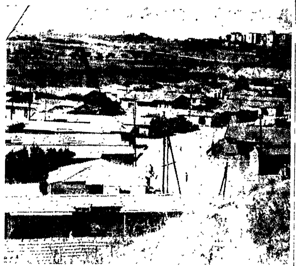
L' dalla liberazione di Roma che si parla delle borgate: tre anni sono passati e nulla o quasi è stato fatto. Solo D'Onofrio e Sereni hanno tracciato un piano di risanamento, che solo per le forti pressioni esercitate sul Ministro del LL.PP. si è riusciti a far attuare. E' certo, però, che se in Campidoglio, sulla Robecchini il piano D'Onofrio-Sereni non sarà portato a termine. Perché? Perché Robecchini è l'amministratore dei gentiluomini terrifici Noga e Pacelli, padroni dell'immobiliare e dei Beni Stabili. Se Robecchini cura gli interessi dei grossi proprietari, non potrà mai curare gli interessi della povera gente!

Nella giornata di oggi, possibilmente nella mattinata, recati col certificato elettorale a 1. sezione assegnata. Se non hai ancora ricevuto il certificato, potrai richiederlo in giornata al Palazzo della Esposizione (Via Nazionale).