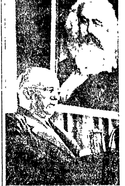
Wilhelm Pieck, uno dei capi del SED, il partito socialista unificato tedesco.