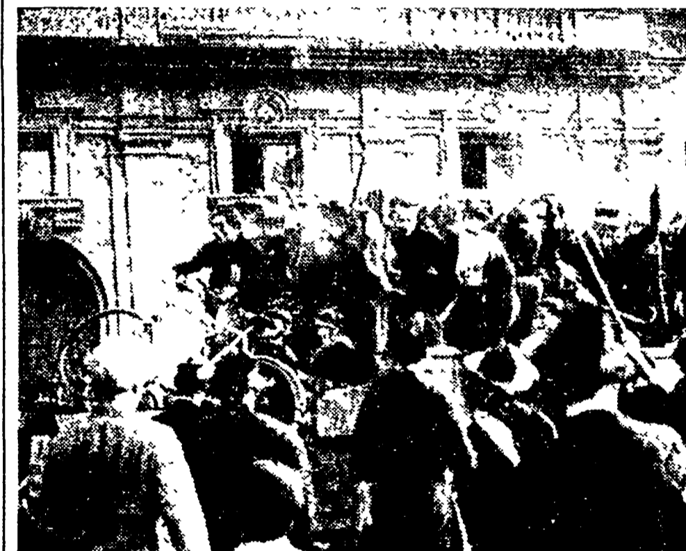
Al canto degli inni della rivoluzione e la reazione fascista proteggeva gli interessi della speculazione agraria e industriale.