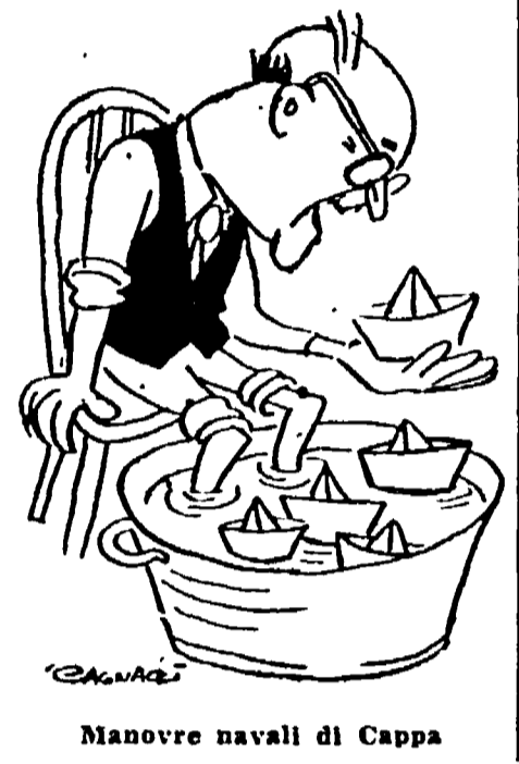
Manovre navali di Cappa