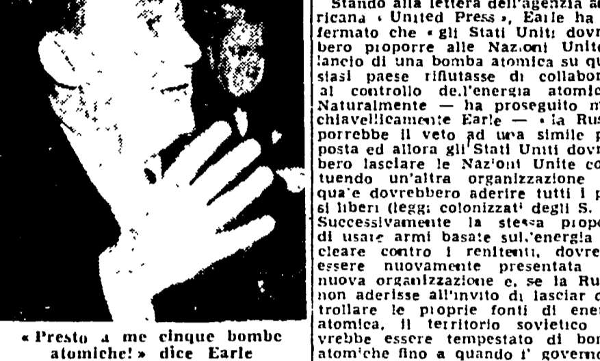
«Presto a me cinque bombe atomiche!» dice Earle

Questa è l'ultima proposta germinata nel cervello del noto bellicista Earle