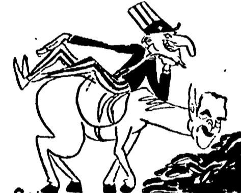
A Merzagora piacciono le carrube. Le carrube piacciono Merzagora...